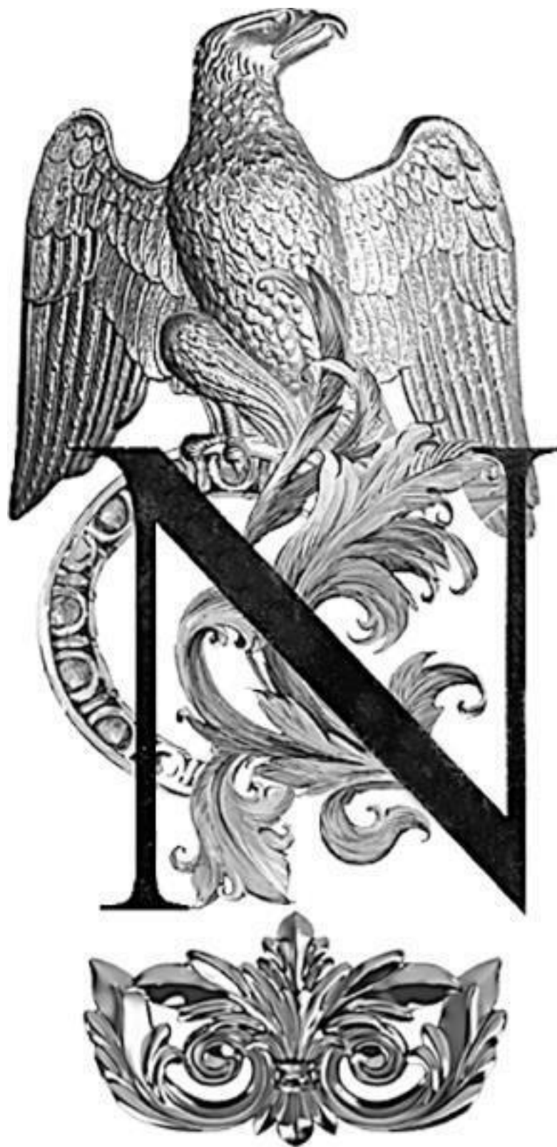
RONALD FREDERIC DELDERFIELD Imperial SUNSET The Fall of Napoleon, 1813-14