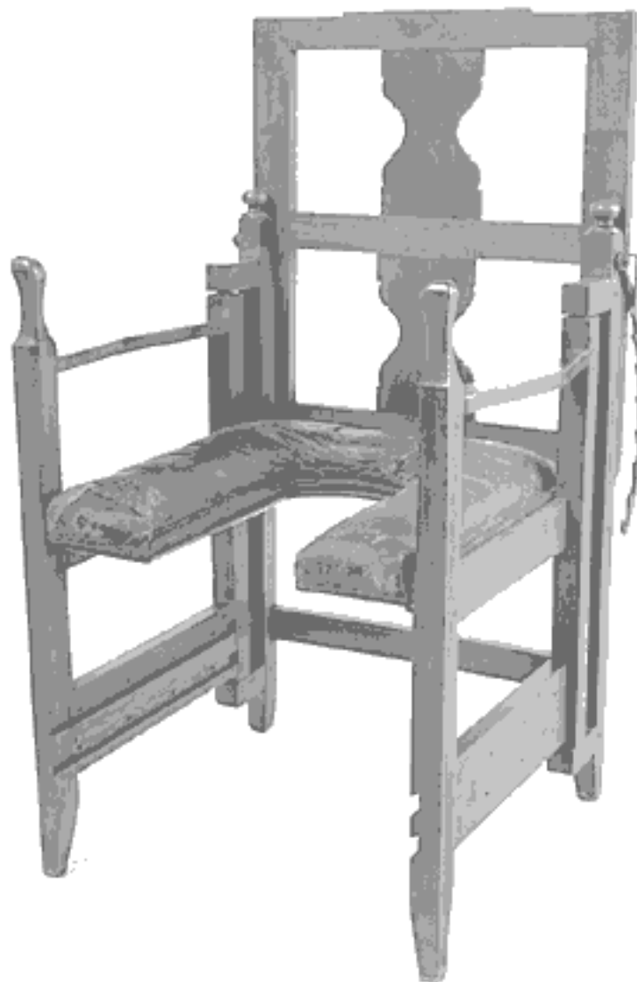
Родильное кресло XVII века из коллекции музея Уэллкома (Лондон).

По мере того как акушерская практика переходила от повитух к врачам-мужчинам, менялась и конструкция родильного кресла. Женщине было удобнее рожать в низком кресле, дающем ей возможность упираться ногами в пол, хотя повитухе приходилось сгибаться в три погибели и с вытянутыми руками ждать, когда появится головка младенца. Как только родовспоможением занялись врачи-мужчины (примерно с 1700 года), ножки у родильного кресла начали удлиняться. Высокое кресло было менее удобно для роженицы, зато врачу не нужно было наклоняться. В конце концов будущим матерям предложили тужиться лежа, а не сидя, то есть отказаться от использования силы тяжести. Как ни печально, подобное изменение ввели в обиход не в интересах пациенток, а в интересах врачей.