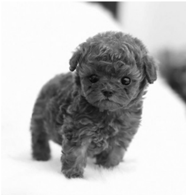
Ил. 3. Сырок (Cheese), пудель стандарта теасир. В 2018 году был выставлен на продажу на сайте одного из южнокорейских зоомагазинов