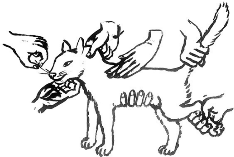
Ил. 4. Александр Повзнер. Без названия, 2020. Бумага, тушь, 62 × 87 см