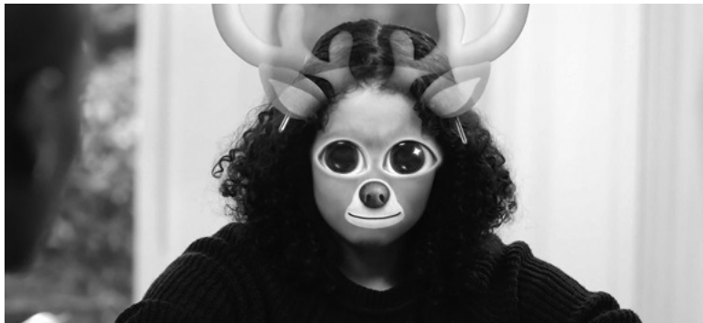
Ил. 2. Кадр из сериала «Годы» (Years and Years), эпизод 1. Совместное производство BBC One и HBO