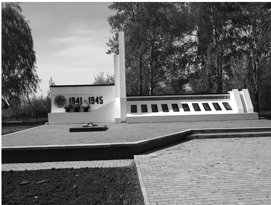
Ил. 1. Памятник Великой Отечественной войне в селе Караул служит местом памяти всех погибших в этих местах в XX в. Проект Дмитрия Котова, памятник установлен в 2019 г.

Стыдливо поставили памятник Тамбовскому Мужику или крестьянину. Так вы [городские власти] напишите, в связи с чем этот памятник и где он поставлен 51 , почему в этом месте поставлен. Если уж говорить правду. А то такая вот она полуправда получается. Да, памятник есть тамбовскому крестьянину. Чего, зачем, а почему он тут стоит, а почему тамбовскому крестьянину? Почему не воронежскому крестьянину? <...> Эти места стерли из памяти 52 .