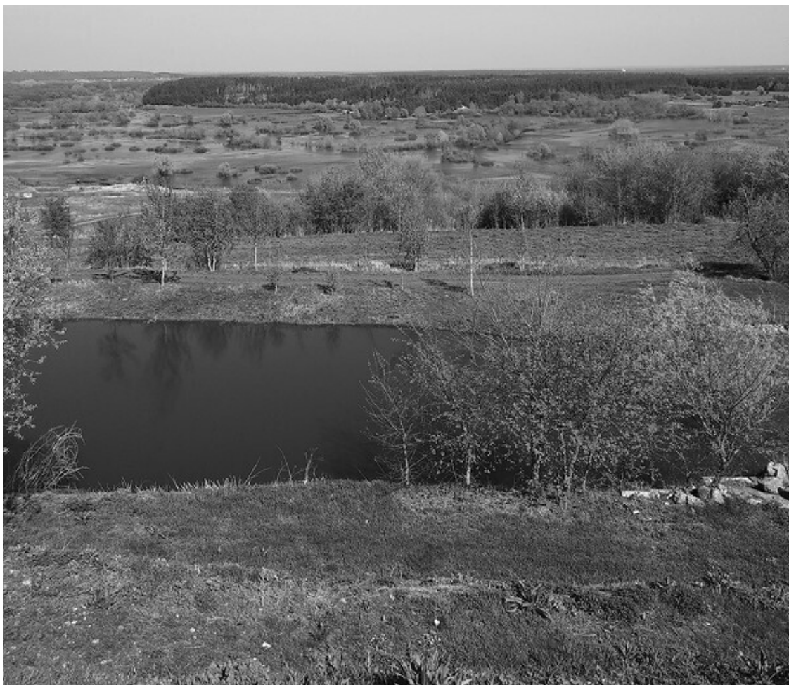
Ил. 2. Заливные луга вокруг реки Вороны около села Карандеевка.