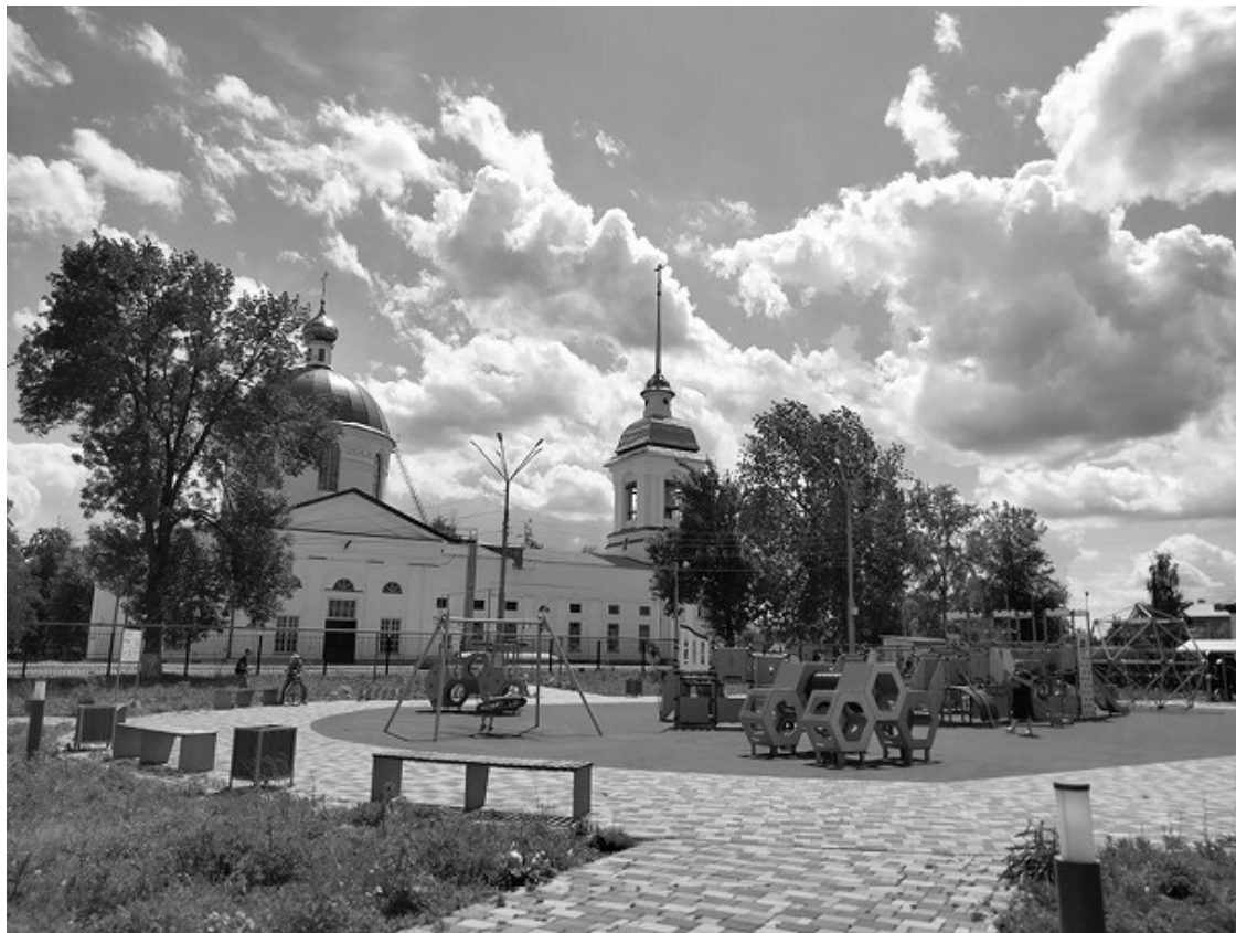
Ил. 4. Территория вокруг Христорождественского собора после реконструкции. 2022 г.

должает тенденцию к расширению хронологического контекста поминовения. Память о красноармейцах, погибших во время крестьянского восстания, не только расширена за счет памяти всех жертв Гражданской войны, но и стала памятью о всех жертвах этого конфликта, и более того – герои и жертвы войны Гражданской все более отчетливо соединяются в коммеморациях с погибшими во время Великой Отечественной войны.