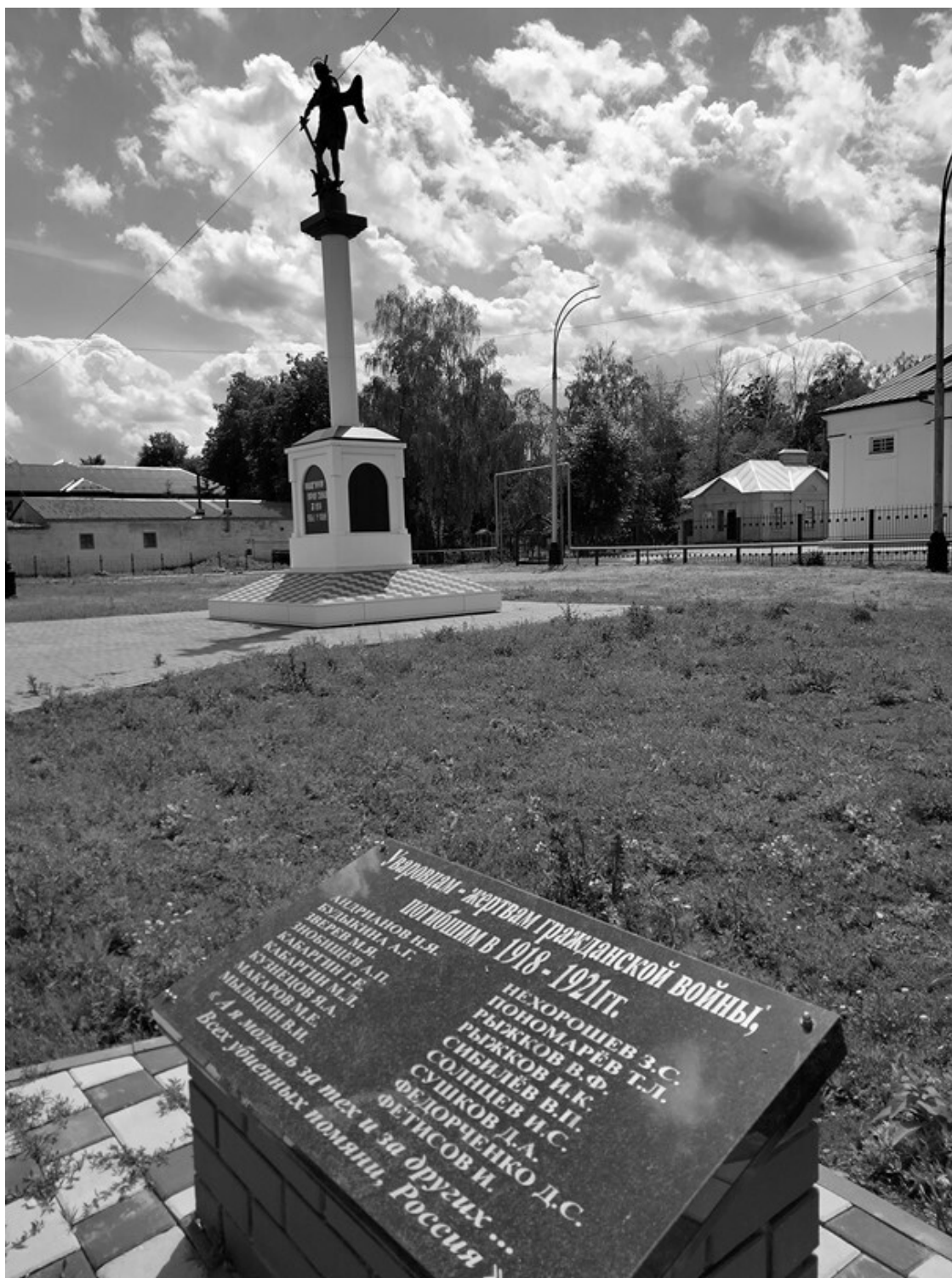
Ил. 3. Скульптура архангела Михаила у Христорождественского собора. 2022 г. Автор скульптуры Виктор Остриков.

На примере одного городского объекта мы можем увидеть динамику развития представлений о Тамбовском крестьянском восстании и специфику практик его поминовения. Характер этой динамики проявлялся в частичном переосмыслении местной традиции почетных захоронений и колебался от установки на забвение до попыток поименного сохранения памяти о героях/жертвах. В наши дни «стела единства» представляет местным жителям новое, «примирительное» прочтение трагических событий 100-летней давности. Нынешний монумент про-