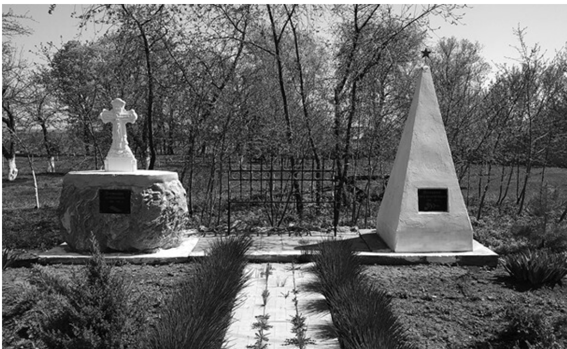
Ил. 3. Памятники крестьянам (слева) и красноармейцам (справа) в селе Карандеевка во дворе отеля «Русская деревня».