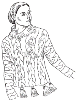
Рис. 1. Пуловер с кисточками