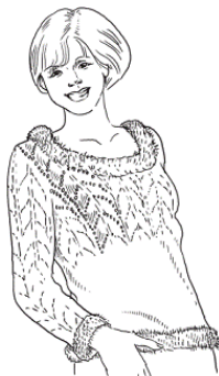
Рис. 3. Бирюзовый пуловер

Вам потребуется: 400 (500) г пряжи бирюзового цвета (55 % хлопка, 45 % полиакрила, 95 м/50 г), 100 г бирюзовой меланжевой пряжи (50 % хлопка, 47 % полиакрила, 3 % полиамида, 50 м/50 г), 50 г бирюзовой фантазийной пряжи (100 % полиамида, 90 м/50 г), прямые и круговые спицы № 6.