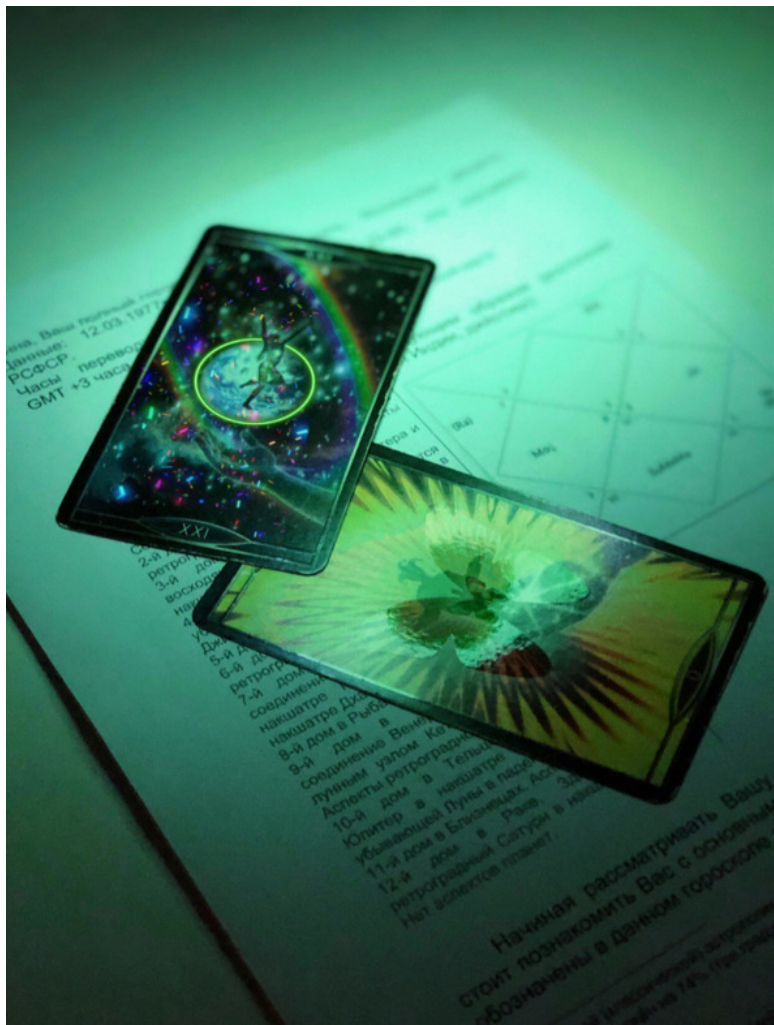
Карты Мир и Шут на фоне распечатанной натальной кар-