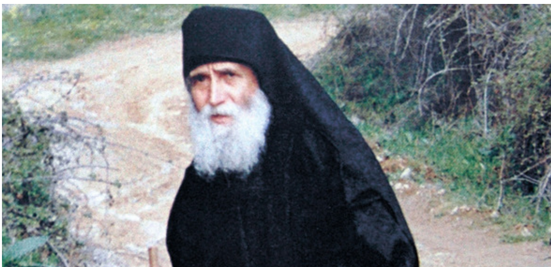
Паисий Святогорец (25.07.1924—12.07.1994гг)