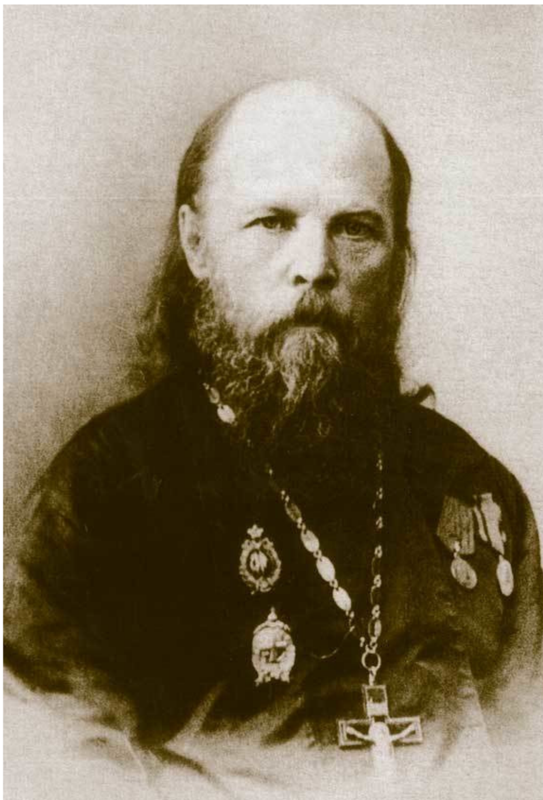
Св. прав. Алексей (Мечев), Московский (17.03.1859—22.06.1923)