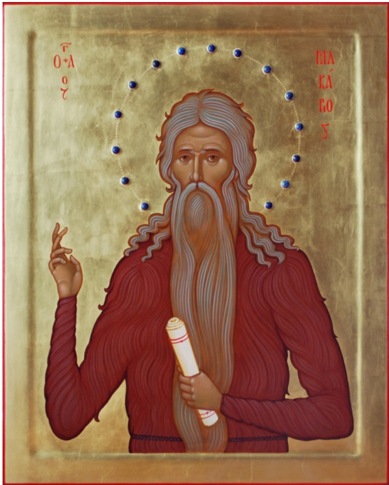
Преподобный Макарий Великий (300—391гг)