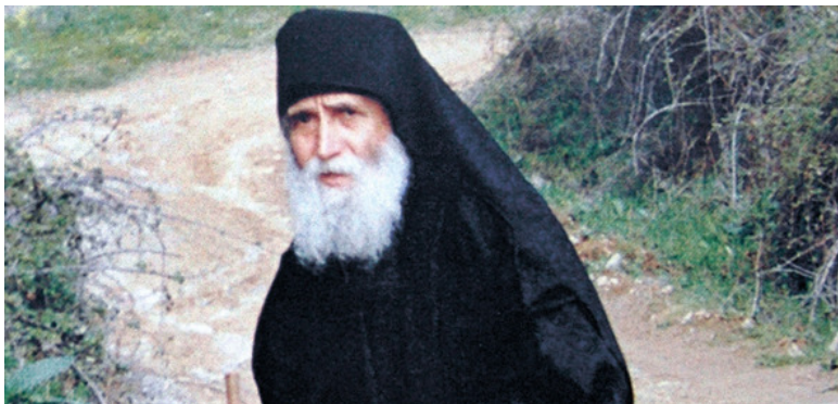
Паисий Святогорец (25.07.1924—12.07.1994гг)