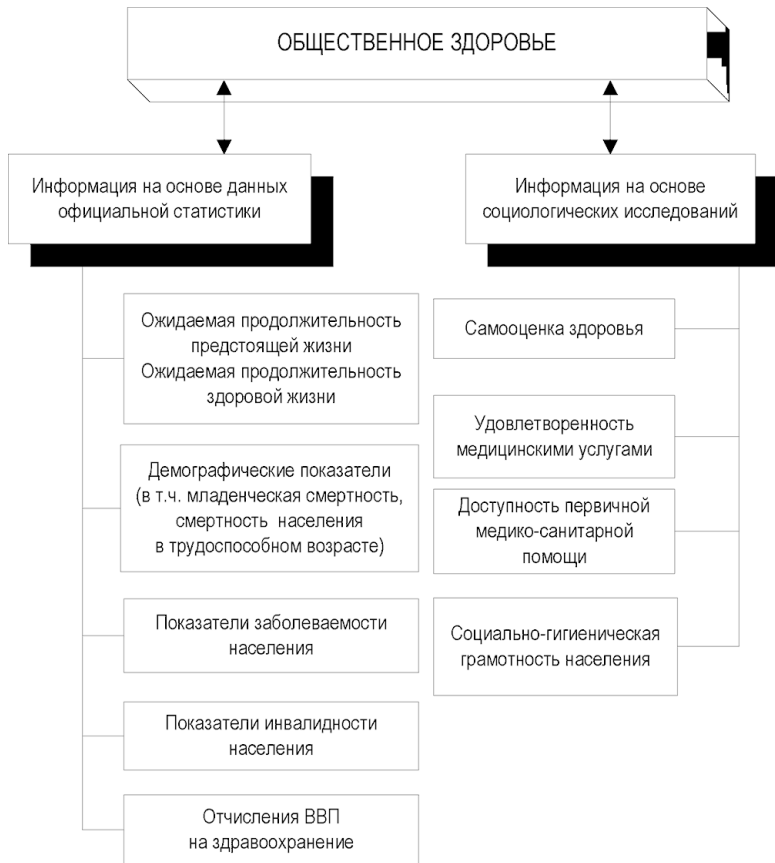
Рис. 1.2. Показатели, характеризующие общественное здоровье