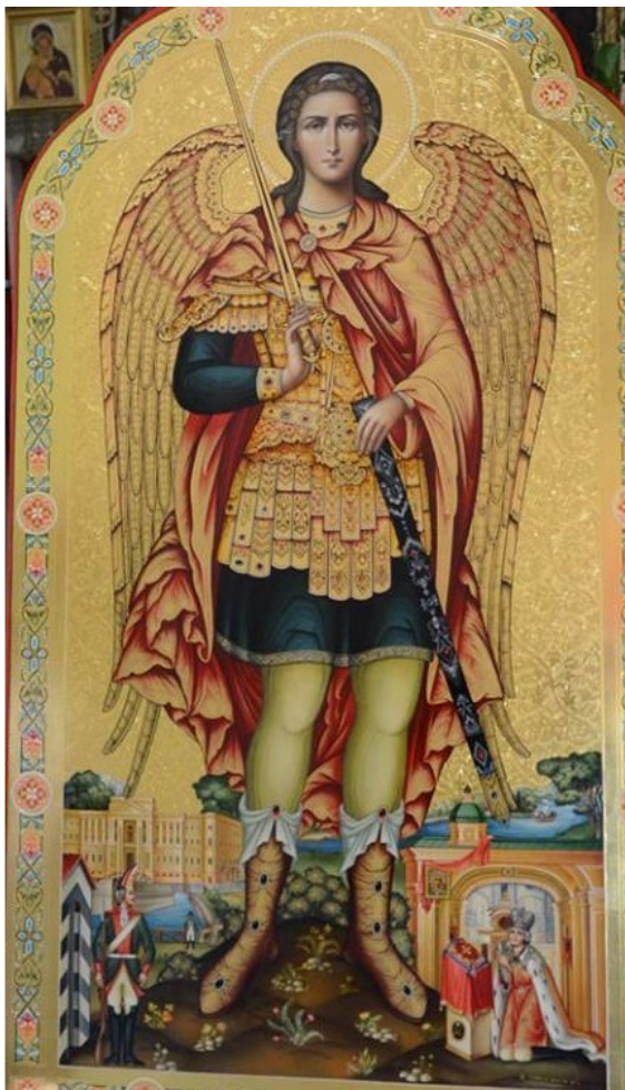
Архангел Михаил с предстоящими ему Царем Николаем I и Царем Павлом I