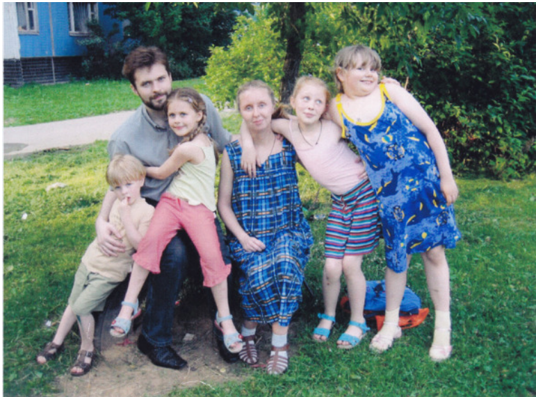
июнь 2006г, на прогулке после командировки в Малоя- рославец