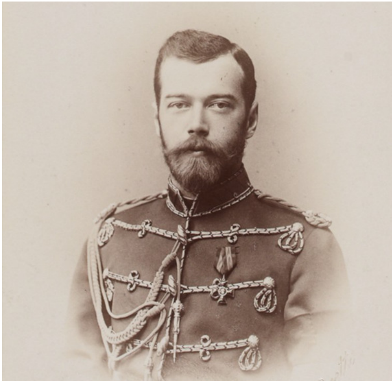
Царь-Мученик Николай Александрович