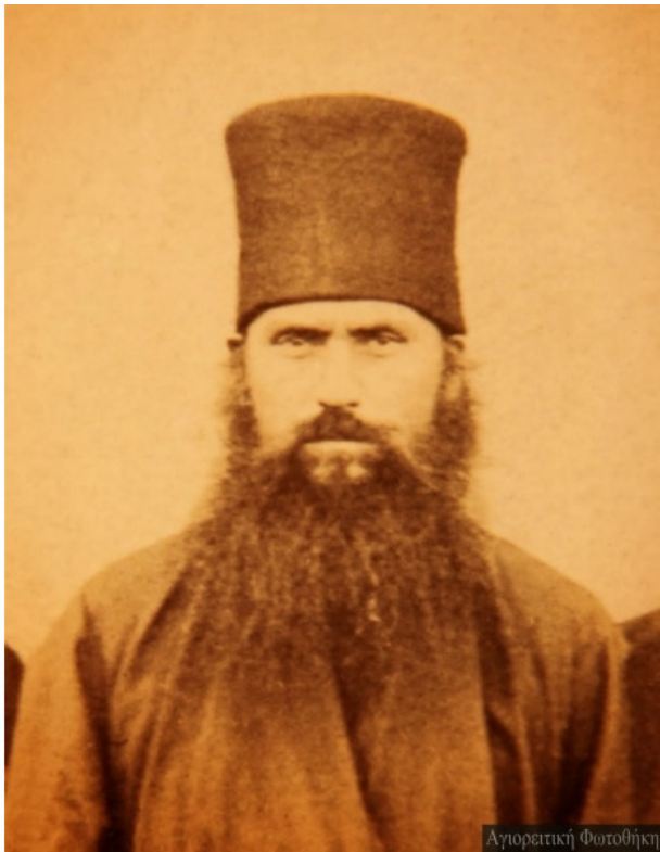
Преподобный Силуан Афонский (25.09.1866— 24.09.1938)