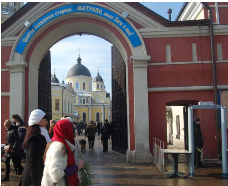
Покровский женский монастырь с мощами святой блаженной Матроны Московской