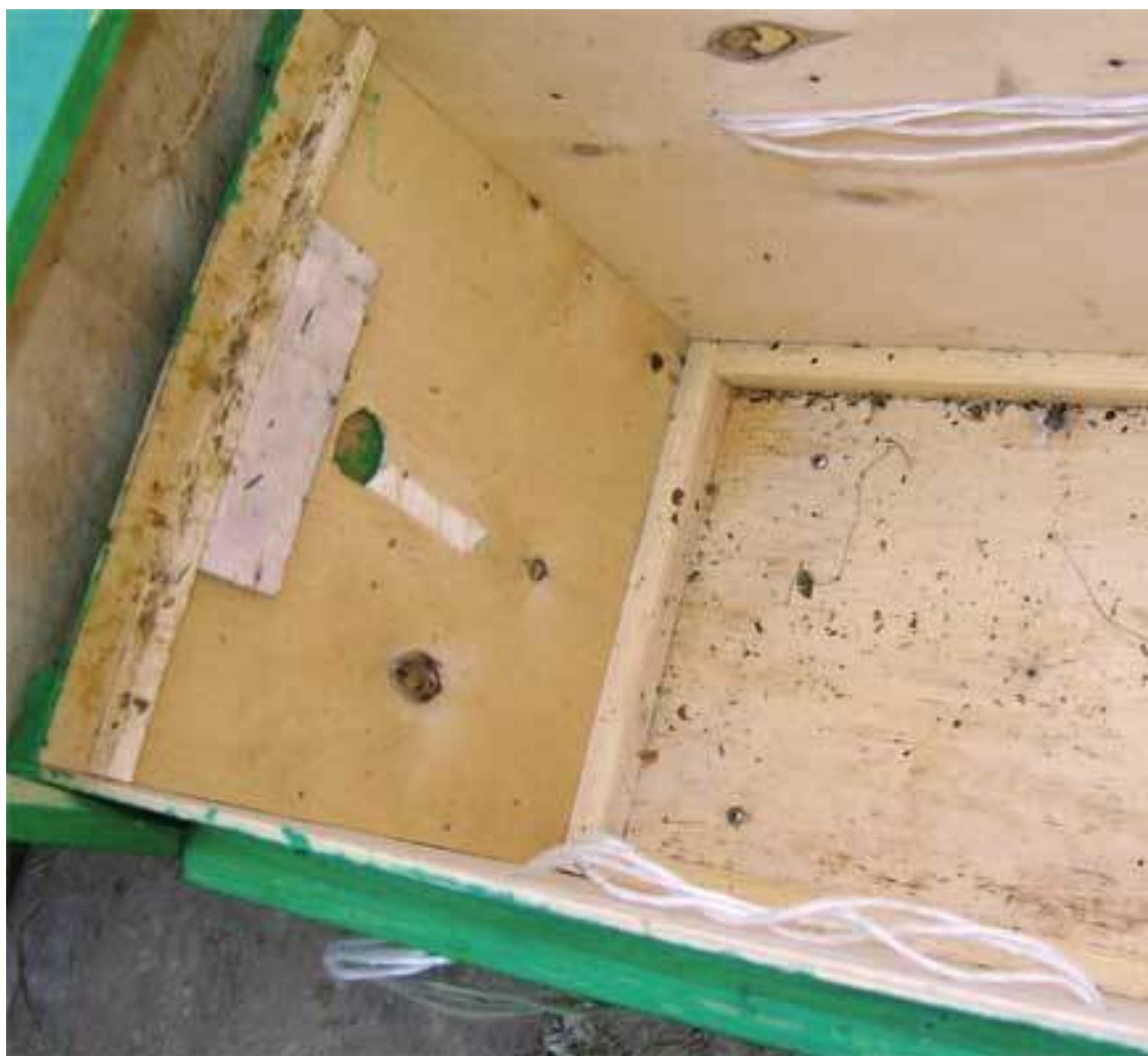
Материал – фанера