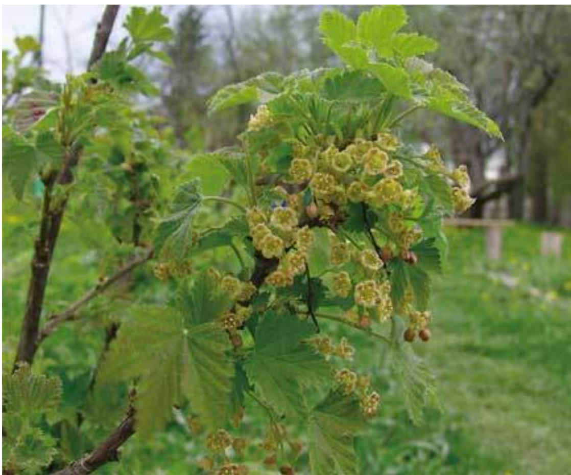
Смородина в цвету

Ваши пчелы должны быть обеспечены необходимым весенним медосбором для нормального развития семьи, летним для товарного меда и осенним, способствующим наращиванию молодых пчел в зиму.