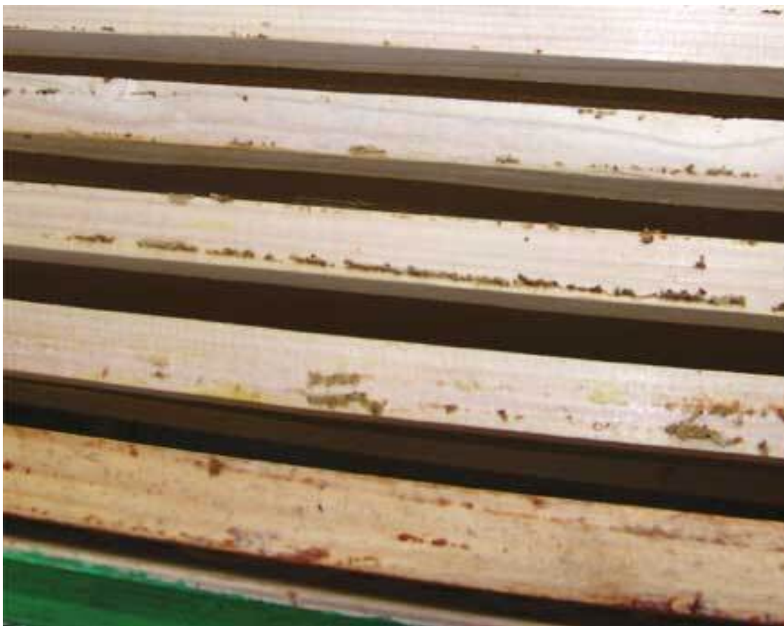
Помещается от 6 до 8 рамок