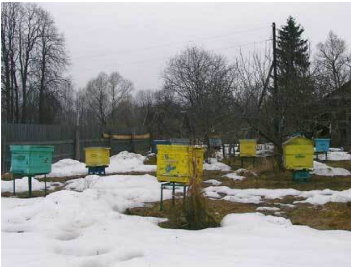
Пасека с десятилетним стажем