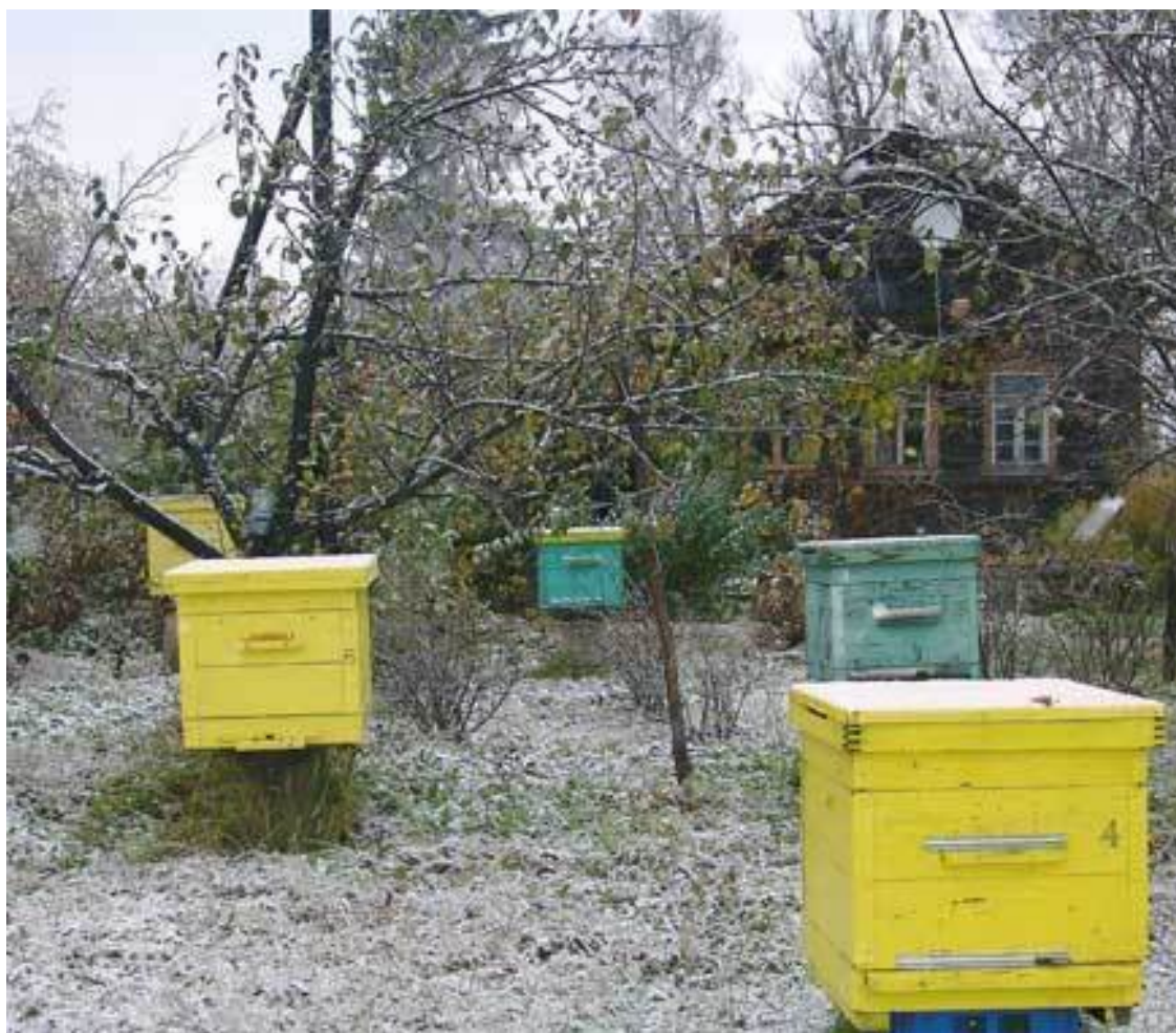
Улей на пластмассовом ящике