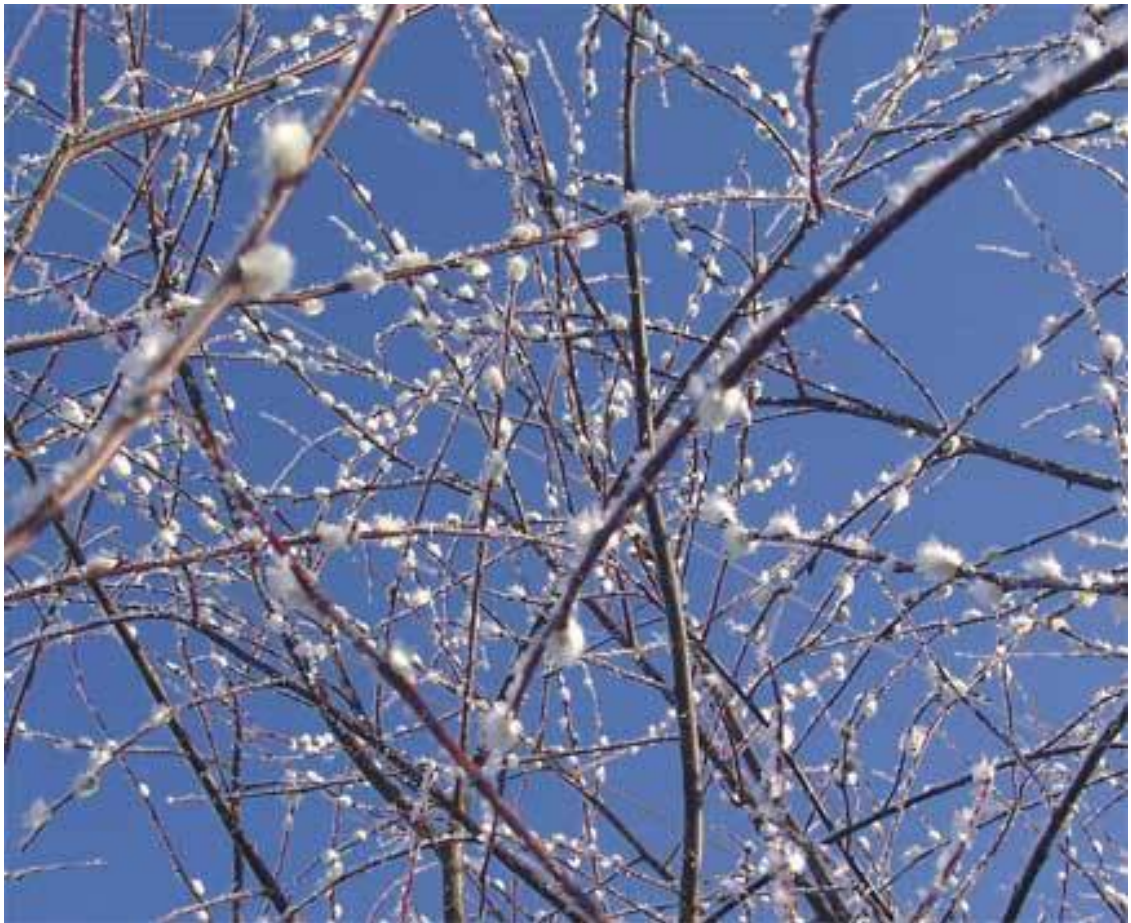
Зацвела верба. А на календаре только 26 марта

И началось! Все лето супружеская пара ходила по пасеке с глубокомысленным выражением на лицах, производя непонятные манипуляции с рамками и пчелами. Всего за месяц число ульев на их участке выросло с одного до четырех. В период роения они всей семьей громко стучали кастрюлями и даже стреляли из ружья в воздух и каждые два дня срывали маточники. Они были уверены, что меду по осени у них будет не просто много, а очень много, и даже искали потенциальных покупателей.