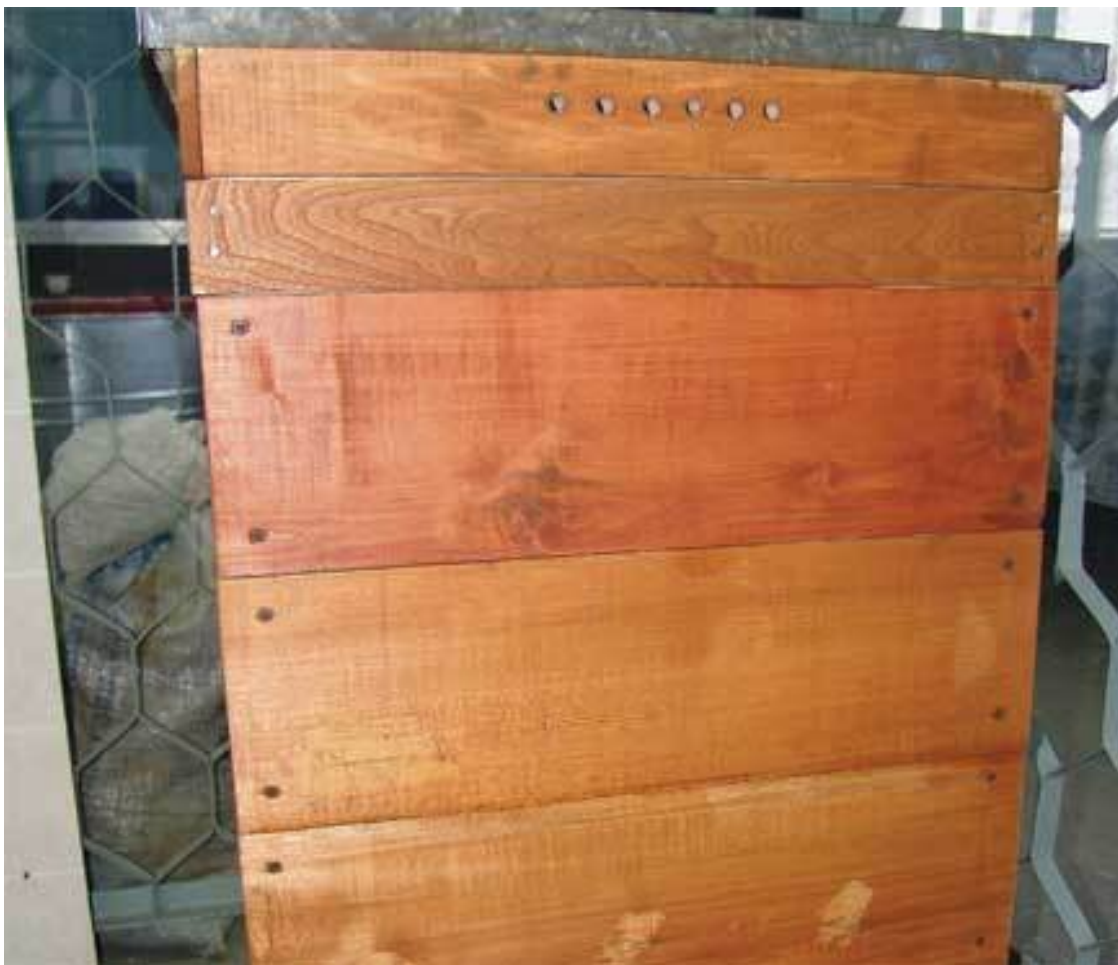
Улей. Заполненный медом, он может весить от 30 до 60 кг

Можно ли самому взять и придумать какое-нибудь оригинальное устройство? Еще в конце восьмидесятых годов прошлого века насчитывалось более 500 различных систем ульев, поэтому вряд ли стоит начинать пчеловодческую практику с улья собственной конструкции. Опыт говорит, что со временем такую самоделку из-за многих недочетов все равно приходится заменять стандартным ульем.