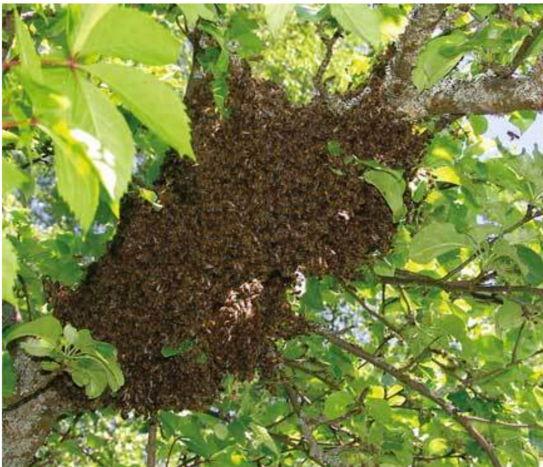
Рой на яблоне ветке