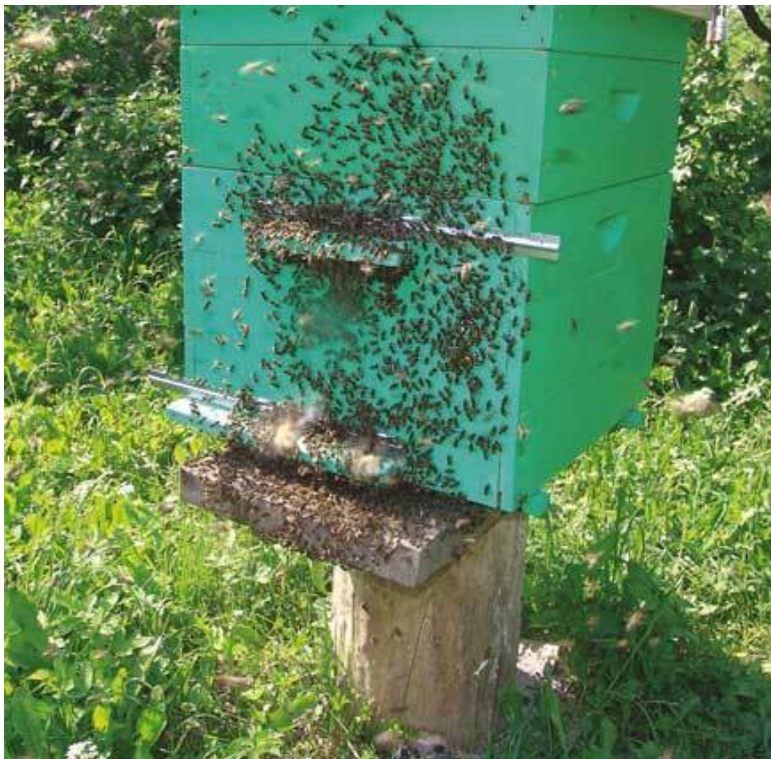
Улей на деревянном пне – пьедестале

Представляете, как бывает «весело» в таком доме, когда едким дымом затянуто все пространство, а вокруг выются рассерженные пчелы. Нет, я знаю таких людей, им это нравится, но мы будем жить так, как учили деды и прадеды. Не мудрить от большого ума и держать ульи не в человеческом жилище, а на улице.