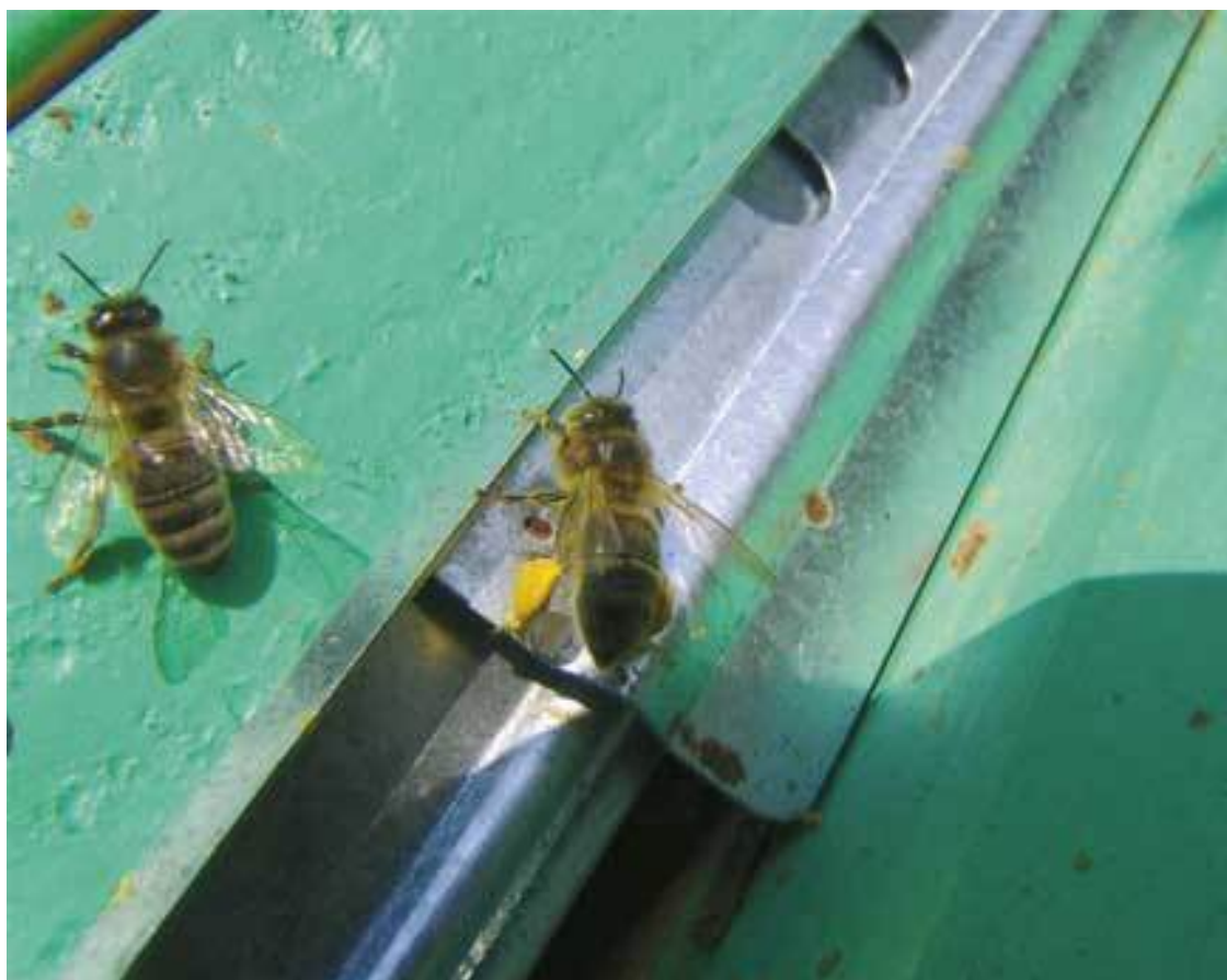
Летковый заградитель в деле