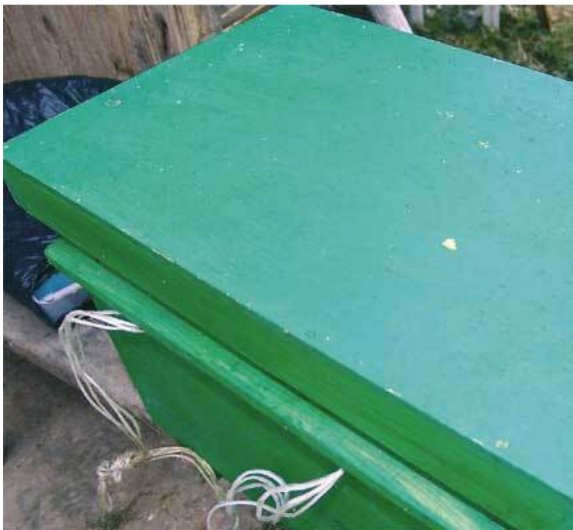
Переносной ящик – вещь в хозяйстве необходимая