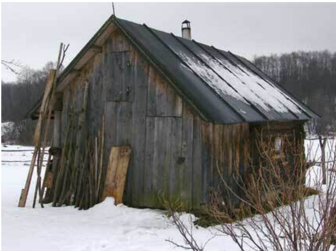
Сарай или баня вполне годны для зимовника

Оттого начинающему пчеловоду надо научиться оберегать и новые и старые соты от моли и мышей. Используйте для этого специальные герметичные ящики, для надежности обитые жестью или очень тонким металлом. Если в них не хватает места, сушь можно разместить в свободных ульях и магазинных надставках. Основное требование – закрытые летки, плотное прилегание деревянных частей друг к другу и полное отсутствие щелей, сквозь которые могут проникнуть грызуны. Такие ульи желательно обвязать еловыми ветками. Нельзя размещать сотохранилище в том же самом помещении, где зимуют пчелы. Из-за влажности воздуха соты могут покрыться плесенью, а имеющаяся в них перга – испортится.