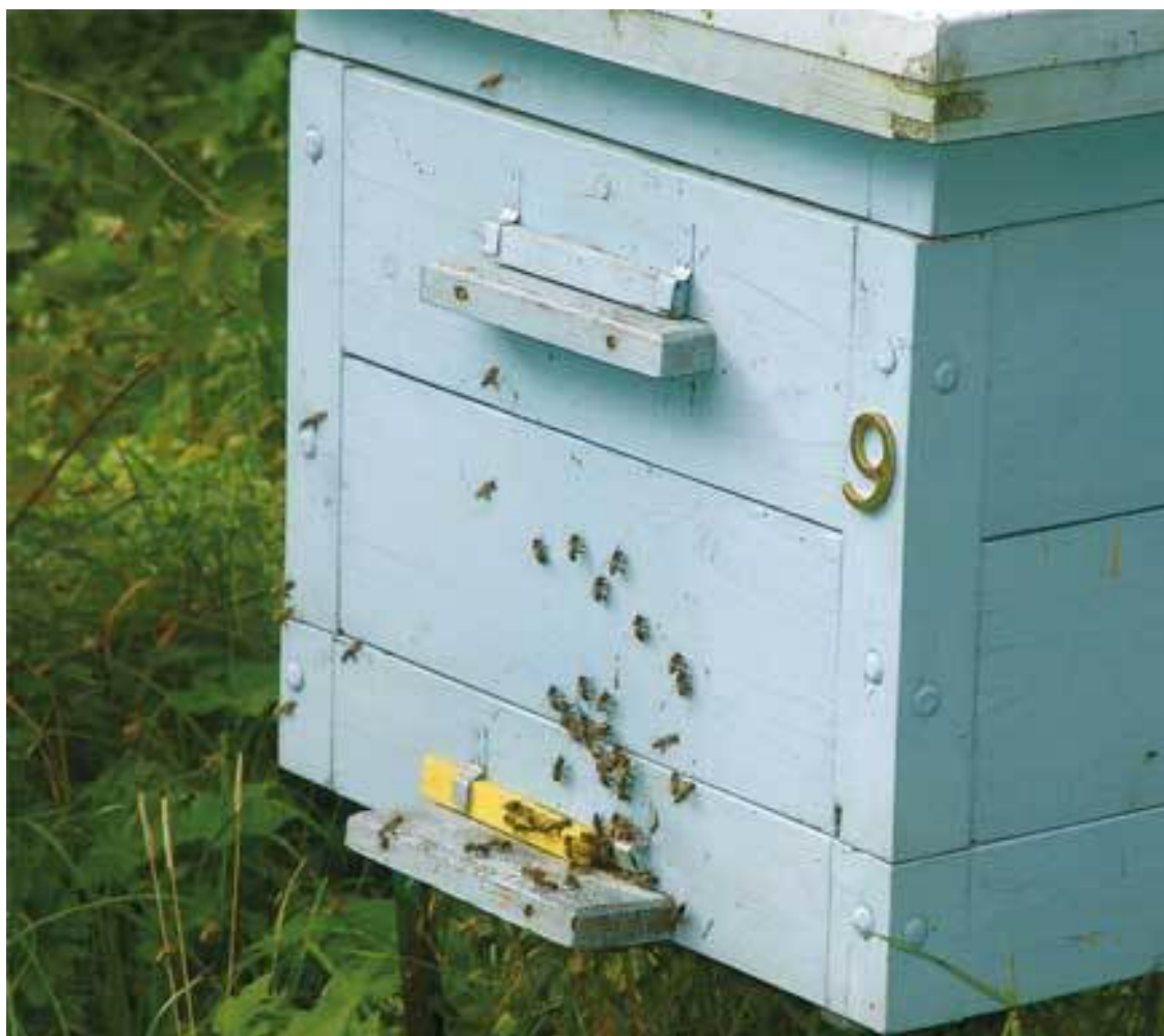
Улей на металлической подставке