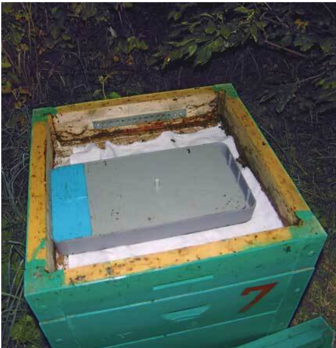
Подкормка пчел с помощью кормушки