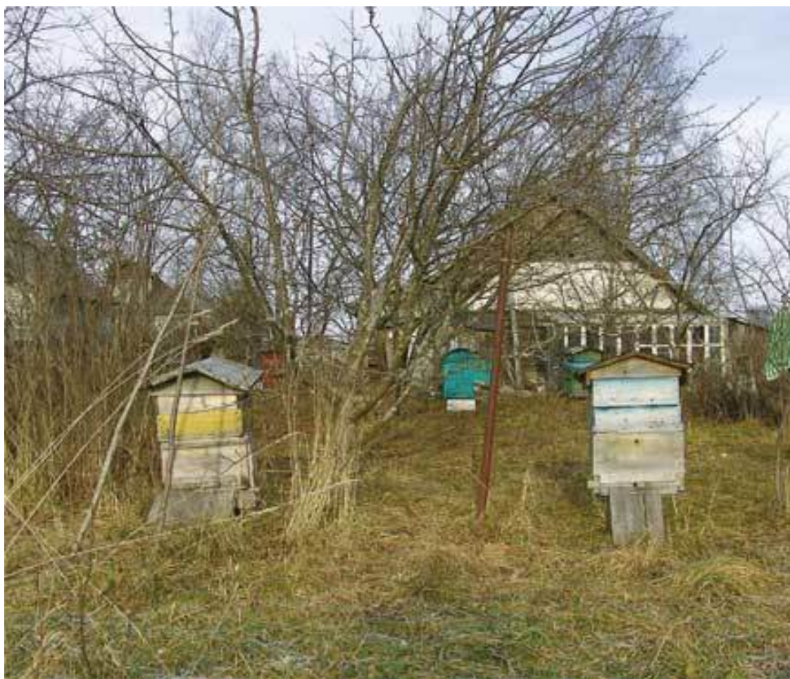
Пасека, которой более четверти века

Только не надейтесь, что ваши возможные соседи – пчеловоды со стажем, встретят появление у себя под боком новой, вашей, пасеки с распростертыми объятиями и хлебом-солью. Не ходите к ним и не спрашивайте советов, как разместить ульи и как заниматься с пчелами. Начинающих пчеловодов чаще всего воспринимают с иронией. Вам с глубоким вздохом расскажут обо всех трудностях пчеловодческой практики. Вам даже могут искренне посочувствовать. Скажут: «Такой хомут на шею, да еще добровольно». Если подобной реакции не будет у всех на виду, а будет одно поддакивание каждому вашему слову, вас все равно причислят к людям недружественным, к тем, перед которыми не стоит раскрывать секреты мастерства. Будьте начеку, можете бесплатно такой совет получить, что потеряете всякое желание заниматься пчелами.