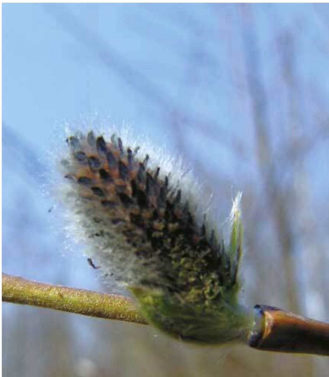
Ива до начала цветения