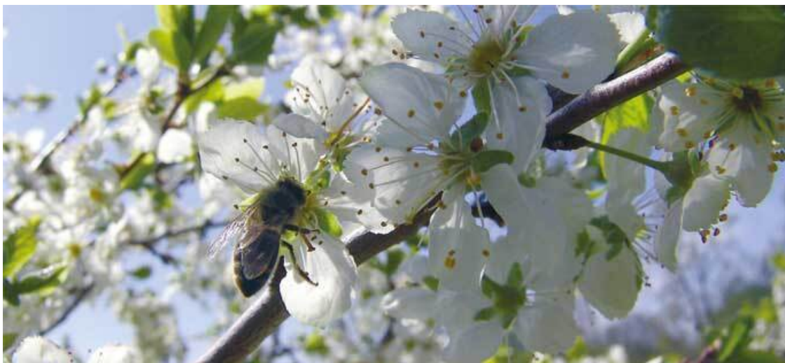
Слива в цвету

А как убедиться, говорит человек тебе правду или лукавит? Ведь для него-то наипервейшая задача продать свой мед. Зато про мед со своей собственной пасеки вы будете знать почти все, что вас интересует. Так что отправляйтесь в деревню.