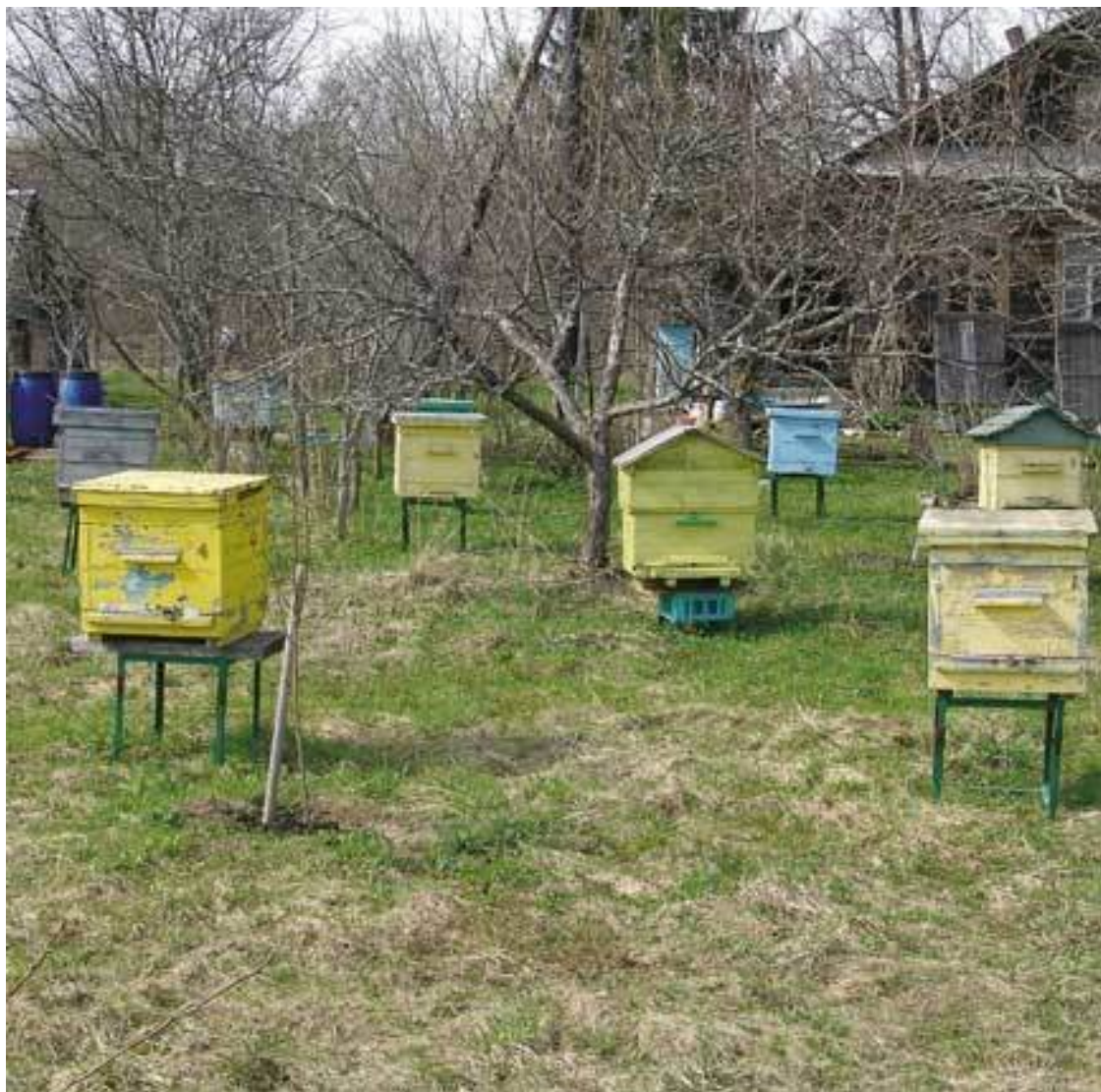
Вариант возможного расположения ульев

Устойчивость такого сооружения проверена временем, сильным ветром и непогодой. Использовал я в качестве подставок и обычные пластмассовые ящики из-под бутылок. Тоже неплохо держат улей. Теперь остановился на подставках, сваренных из металлического уголка.