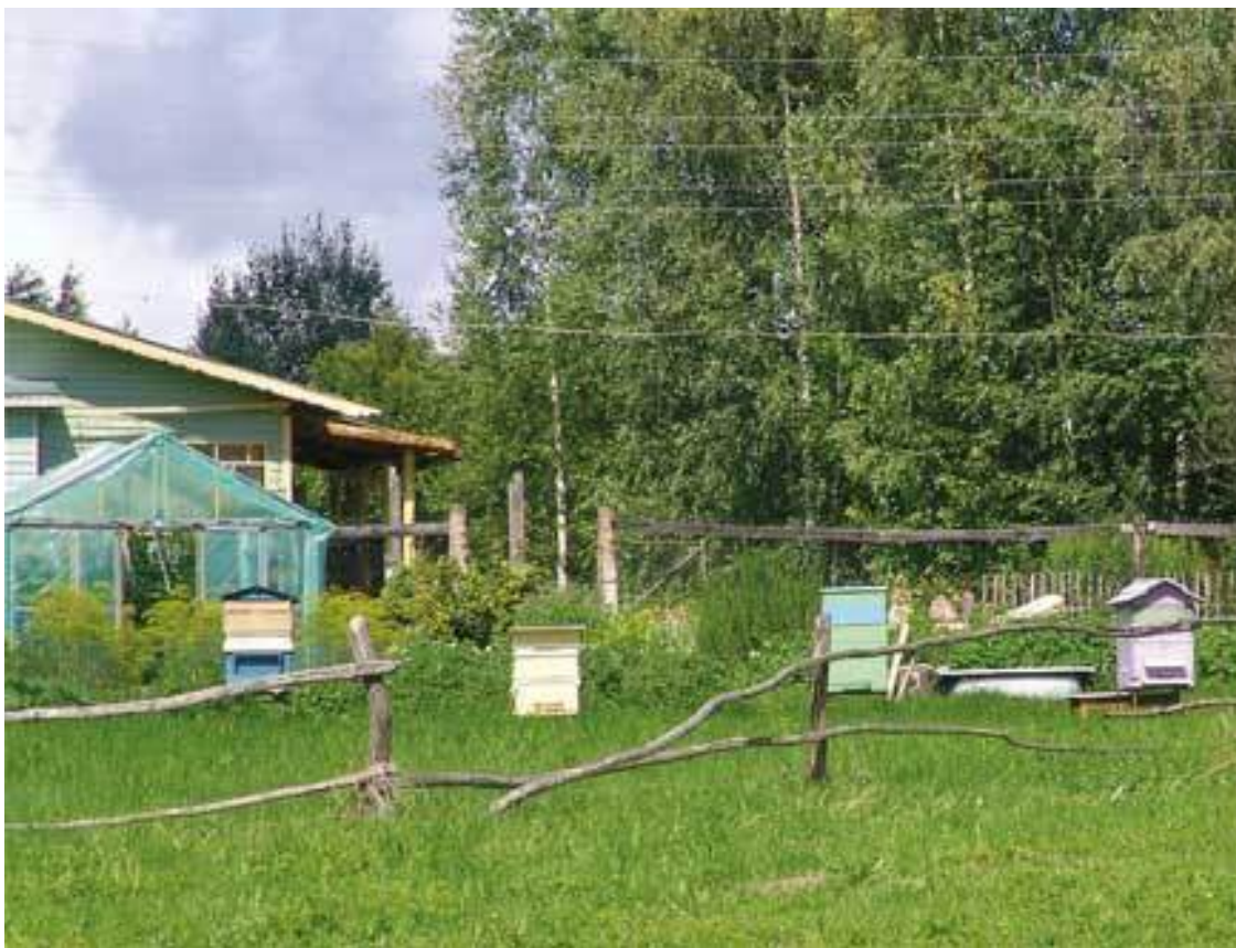
Пасеке – второй год