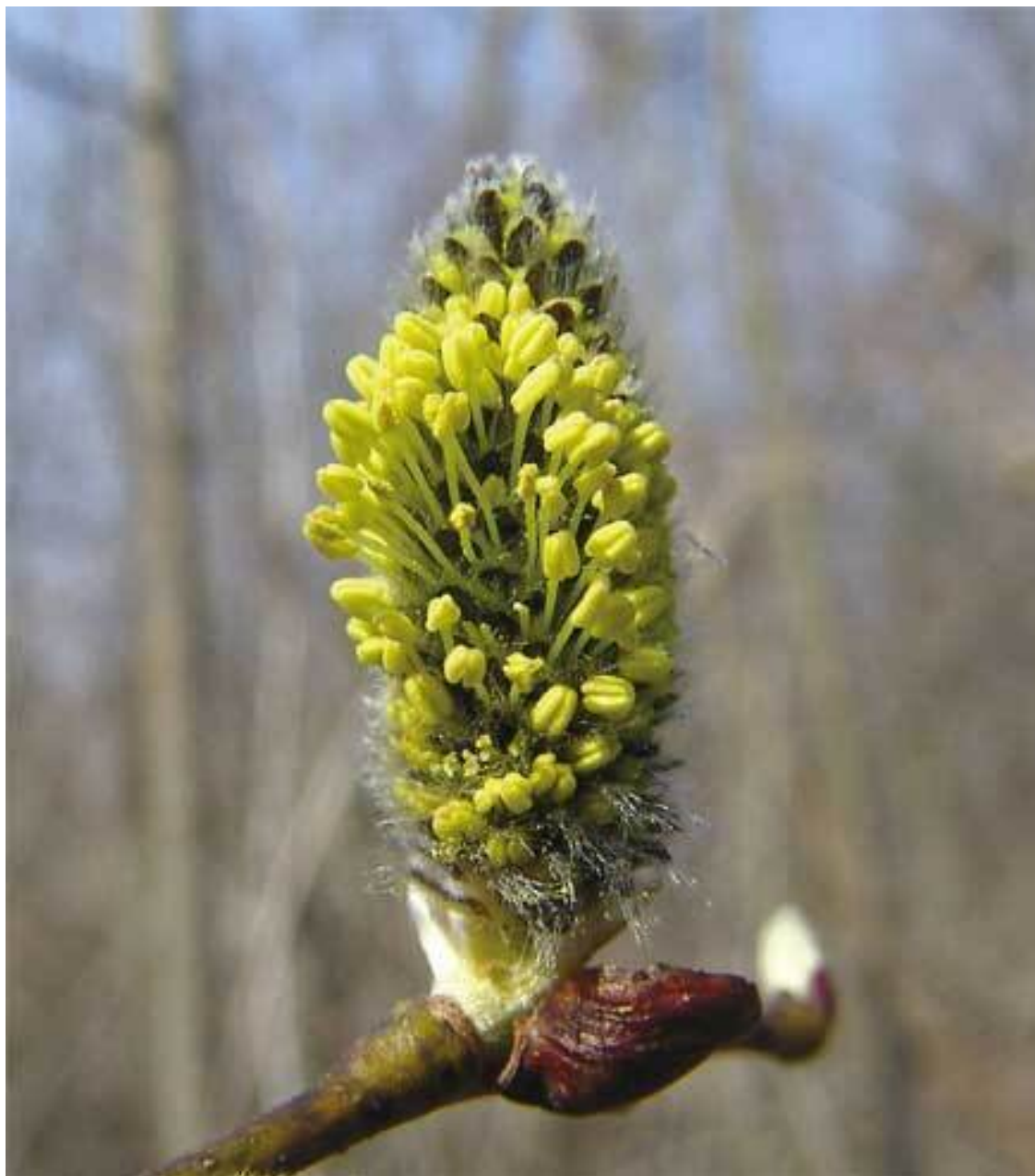
Во время цветения