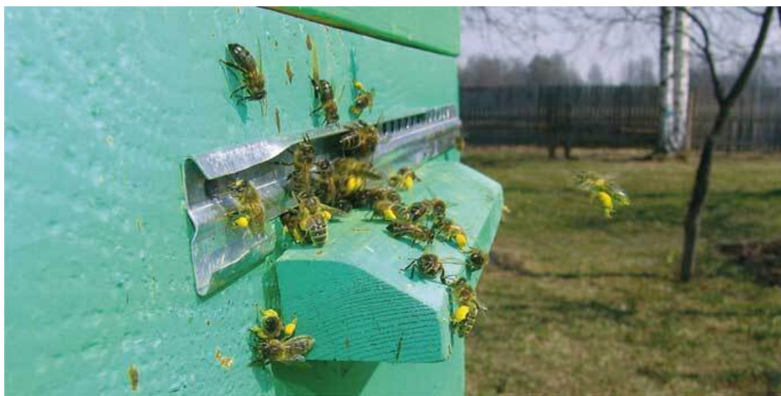
Пчелы носят в улей первую пыльцу

Что со всем этим научным богатством делать? на собственное усмотрение. Можно заучить, можно пропустить мимо ушей. Приятно, конечно, однажды блеснуть познанием в области энтомологии в приятной компании и показаться образованным человеком, но можно и не утруждать себя такой вот теорией.