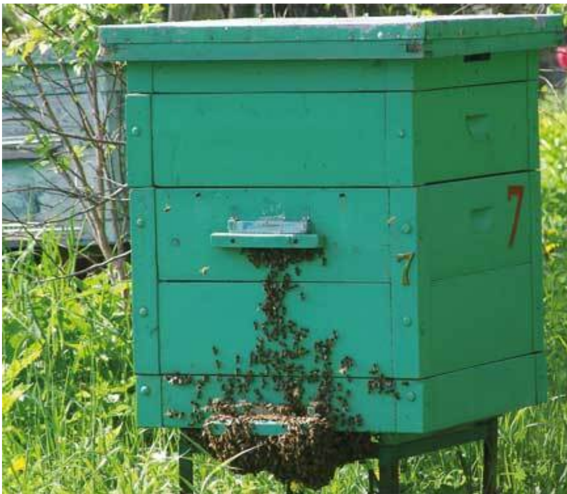
Дадановский улей. На гнезде пока установлена одна магазинная надставка

Ульи-лежаки (мне лично они очень нравятся, жил бы в деревне постоянно – только бы их и использовал), особенно рассчитанные под 20, 22 и 24 рамки, слишком массивны, тяжелы и сложны для транспортировки в зимовник. Их хорошо ставить на пасеке без дальнейших перемещений, но это неприемлемо для пчеловодов, проживающих зимой в городе.