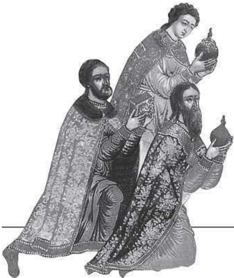
На обложке изображены картины французского художника Джеймса Жозефа Тиссо (1836–1902) «Поклонение пас-