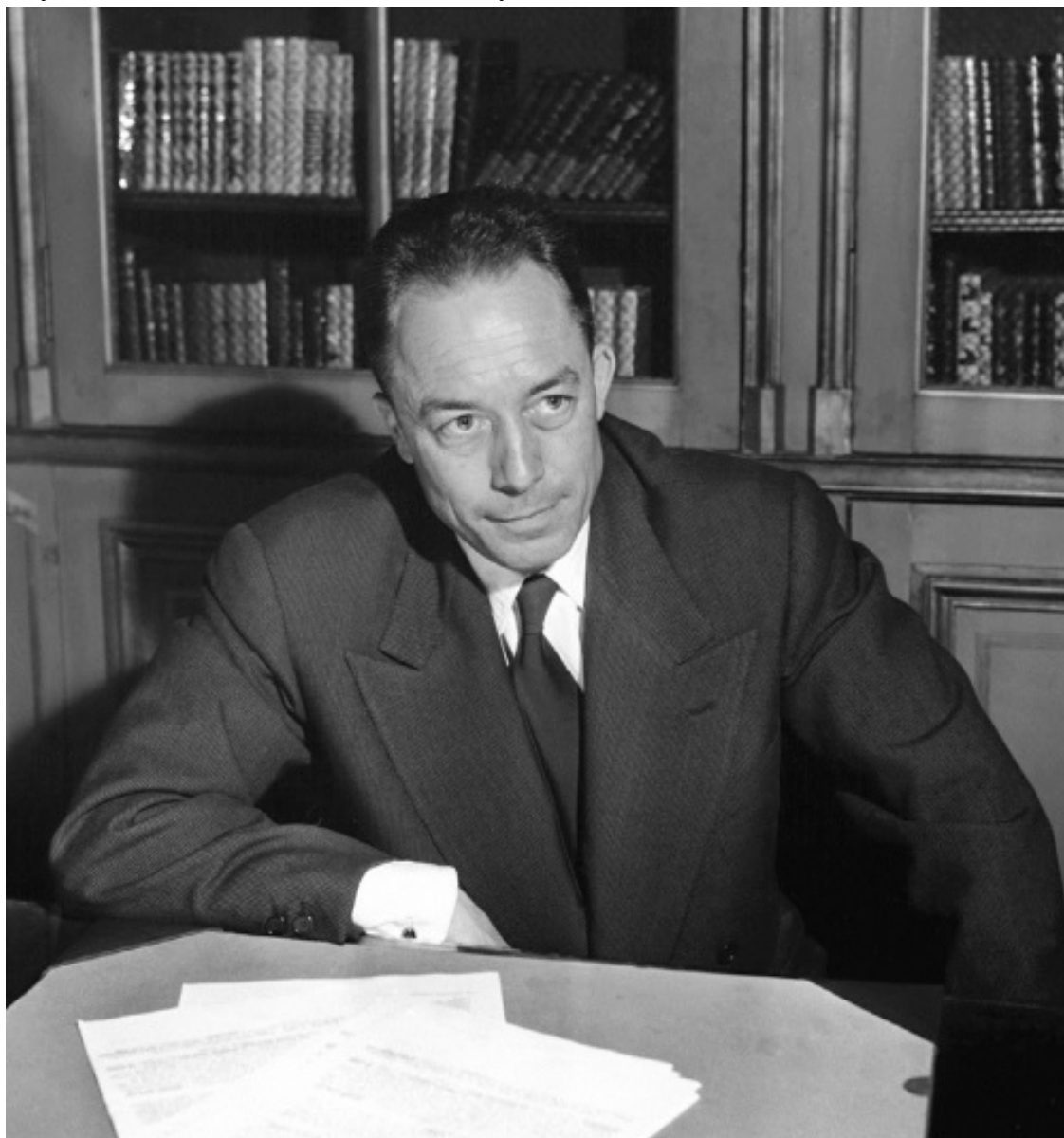
Альбер Камю – французский писатель и философ, близкий к экзистенциализму

Что это за инстинкт? С одной стороны, это крик самой природы, а с другой – слепой порыв к полному обладанию людьми даже ценой их уничтожения.