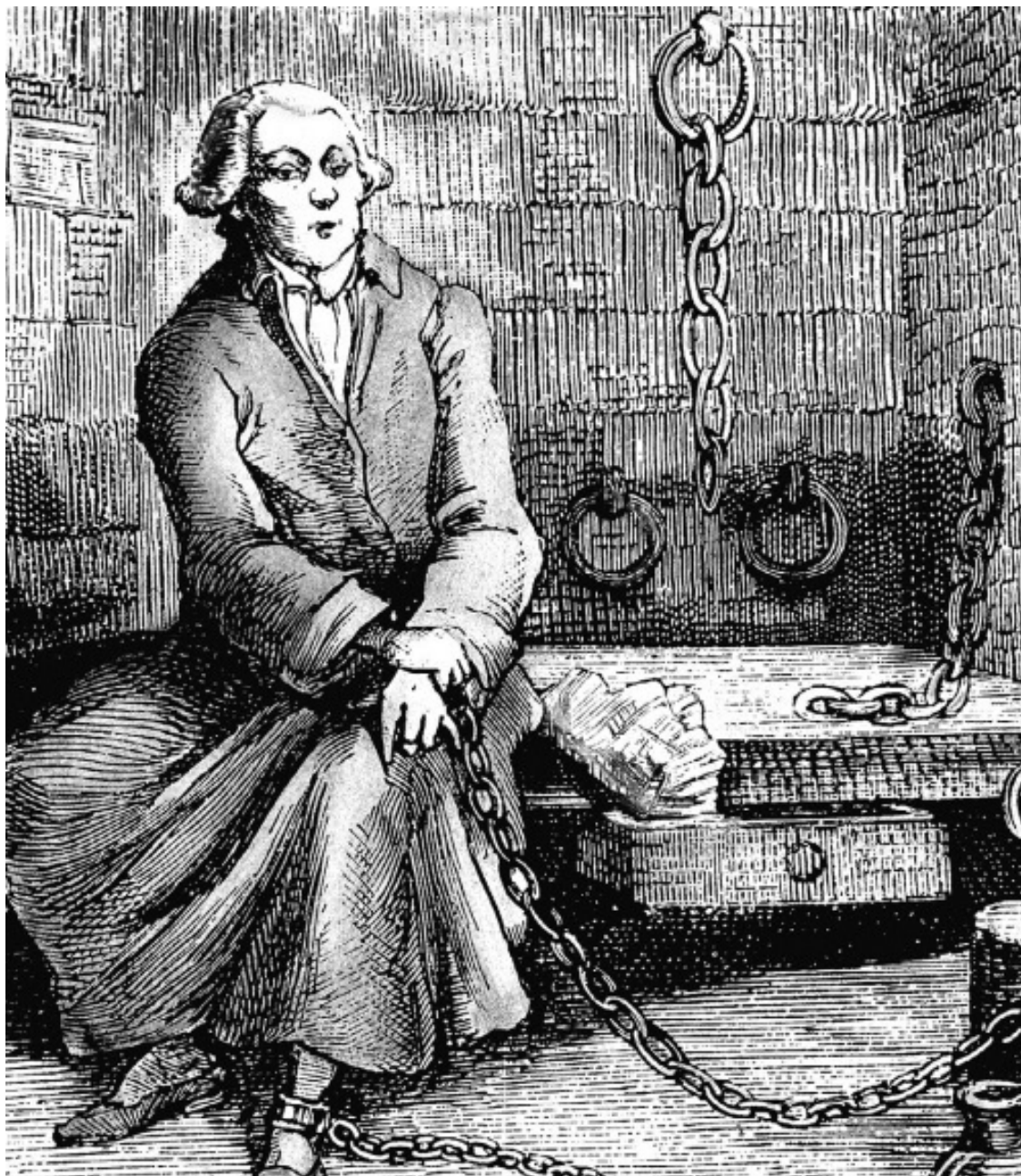
Маркиз де Сад в тюремной камере

Обладать тем, кого убиваешь, совокупляться с воплощенным страданием, – вот мгновение тотальной свободы, ради которого и задумана вся организация жизни в замках. Но с того момента, когда сексуальное преступление уничтожает объект сладострастия, оно уничтожает и само сладострастие, которое существует только в миг уничтожения. Значит, надо подчинять себе новый объект и снова его убивать, а затем следующий и за ним – бесконечную череду всех возможных объектов. Так возникают мрачные скопления эротических и криминальных сцен, застылость которых в романах Сада парадоксальным образом оставляет у читателя впечатление омерзительной бесполости.