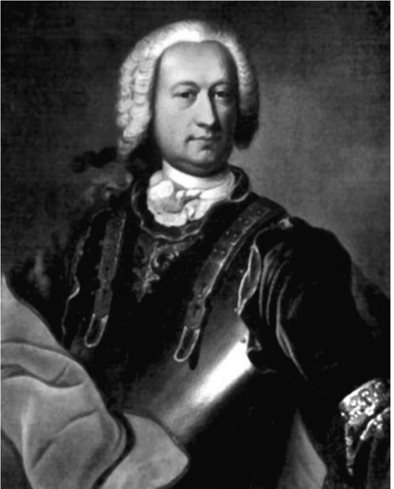
Донасьен Альфонс Франсуа де Сад, вошедший в историю

однако же оставляет за собой право нарушать эти законы.