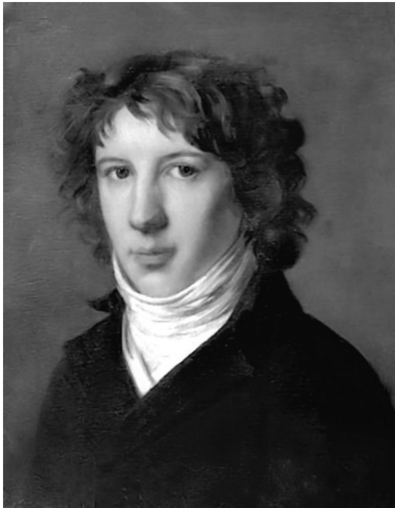
Луи Антуан Сен-Жюст – также известный просто как Сен-