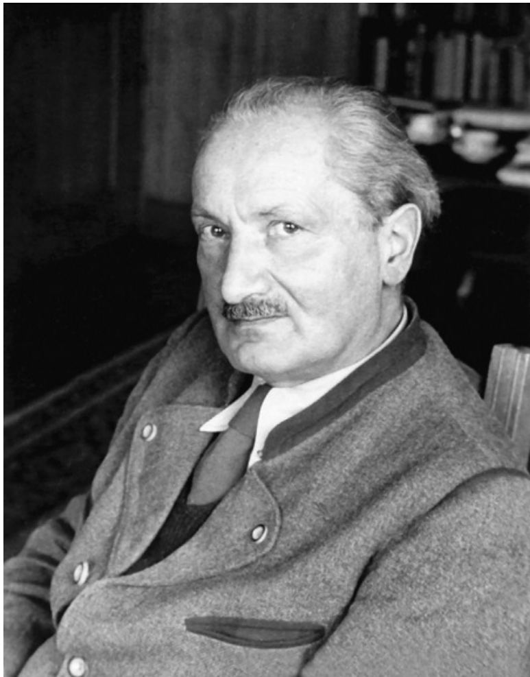
Мартин Хайдеггер – немецкий философ.