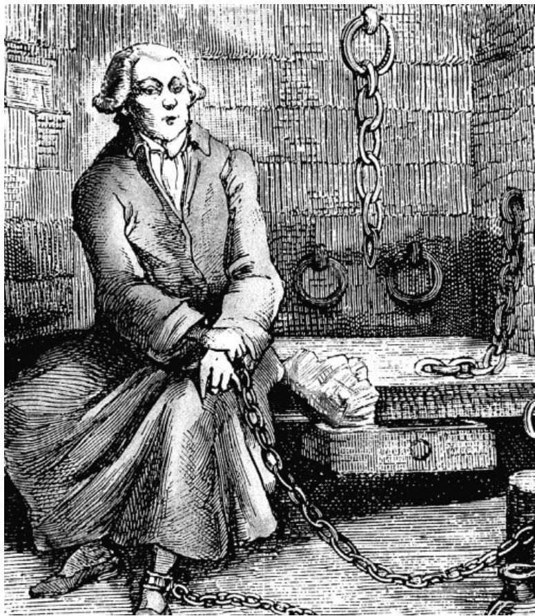
Маркиз де Сад в тюремной камере

Обладать тем, кого убиваешь, совокупляться с воплощенным страданием, – вот мгновение тотальной свободы, ради