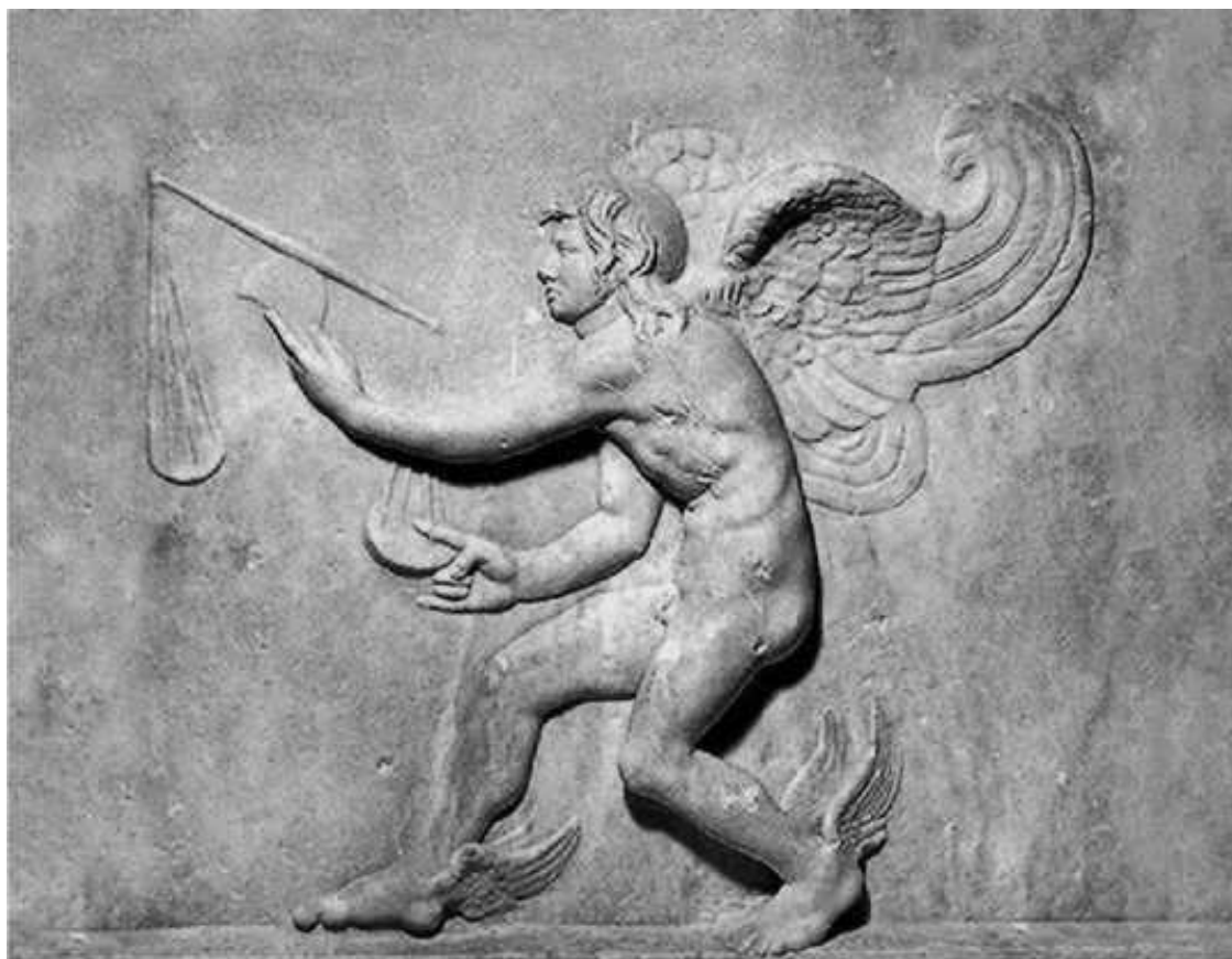
Кайрос работы Лисиппа. Древняя Греция. IV в. до н. э.

Если ты будешь медлить, если будешь пребывать в нерешительности и раздумьях и позволишь, чтобы Кайрос от тебя отвернулся, показал свою гладкую лысину и убежал, то считай, что свой Шанс для Счастья на этот раз ты упустил. По словам Каллистрата, «прядь волос на его лбу говорит о том, что его легко поймать, когда он к тебе приближается лицом к лицу, но если он уже пролетел мимо, то это значит, что срок для действия истек, и если благоприятным моментом – Кайросом – пренебречь, то его уже нельзя вернуть... и следующего Шанса придется ждать очень долго».