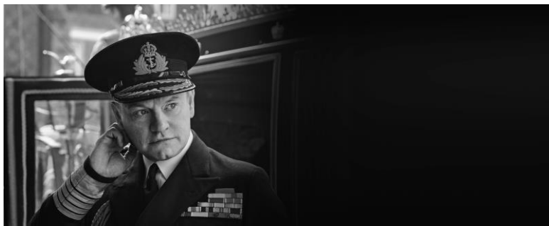
КОРОЛЬ ГЕОРГ VI (1895–1952)

Устроителем этой встречи стал кузен Георга VI лорд Луис Маунтбеттен по прозвищу Дики, который, как и король, в свое время был курсантом колледжа в Дартмуте. Судьба семьи Маунтбеттенов тесно переплелась с судьбой династии Виндзоров еще во времена правления королевы Виктории. Дики, как и Георг VI, был одним из ее правнуков, а его отец Луис-старший перед началом Первой мировой войны стал первым лордом Адмиралтейства. Однако, хотя после 46 лет безупречной службы на Королевском флоте он и занимал высокий пост, по происхождению Луис-старший был немцем.