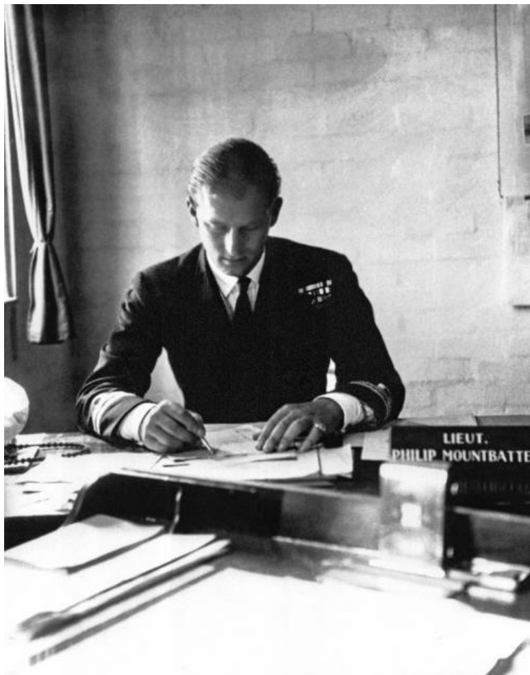
Филипп Маунтбеттен с лентой ордена Подвязки на пра-