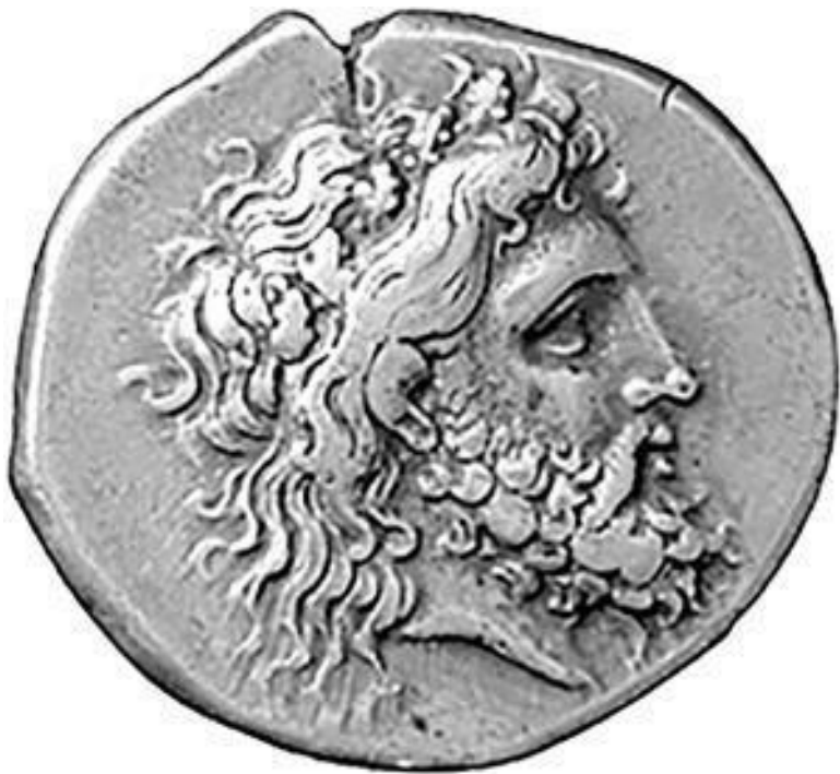
Antony Andniwds THE HEREEKS