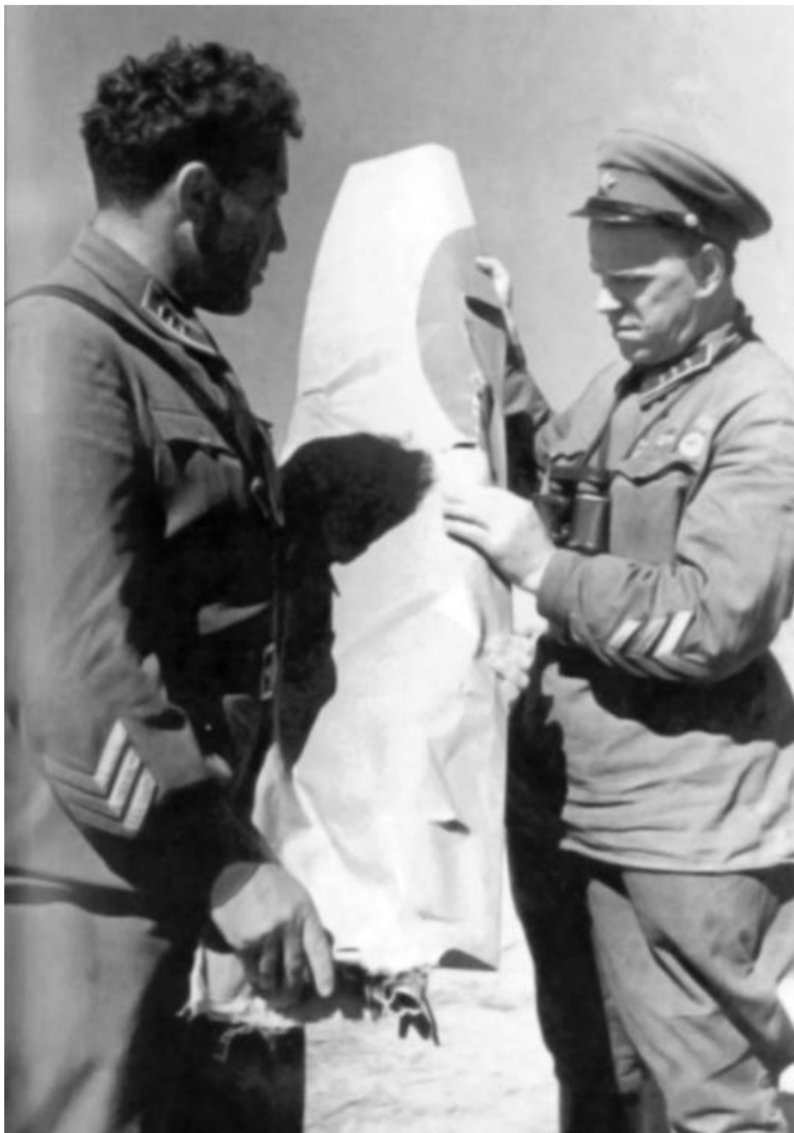
Зримые результаты поддержки с воздуха. Командующий советской авиагруппой на Халхин-Голе Я.В.Смушкевич демонстрирует Г.К. Жукову кусок перкаля со сбитого японского самолета.

До 22 июня 1939 г., когда состоялось крупное воздушное сражение, прибывшая в Монголию «команда звезд» сделала очень многое для повышения боеспособности советских ВВС на Халхин-Голе. Прибыли новые авиачасти, устаревшие самолеты были выведены из состава