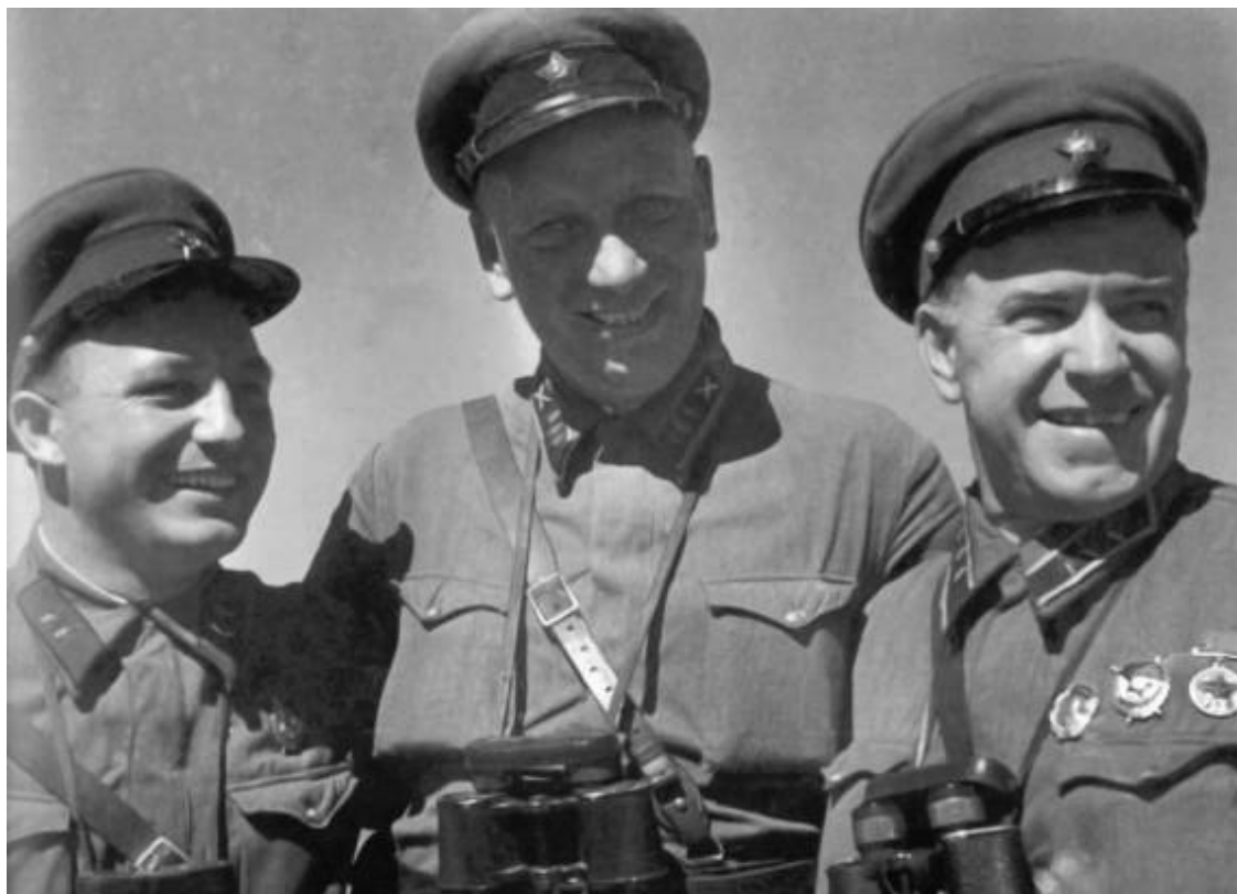
Победители. Г.К. Жуков, Н.Н. Воронов и М.С.Никишев на Халхин-Голе, август – сентябрь 1939 г.

Жукову в тяжелых сражениях 1941 г. Требовалось собирать силы и не позволять противнику ослаблять фланги и второстепенные направления.