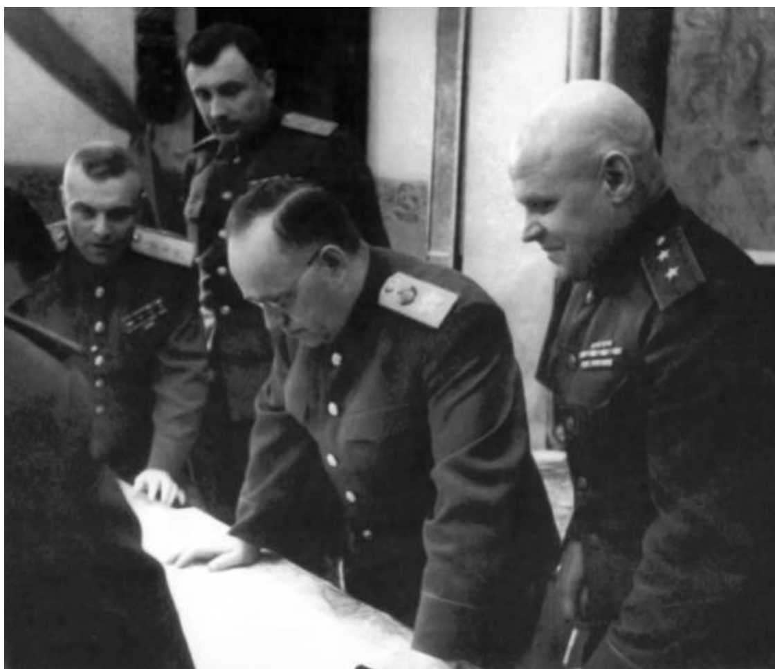
Жуков над картой. 1945 г.

Чтобы мемуары «заиграли», были действительно объективными и интересными вне зависимости от литературных талантов военачальника, нужна была огромная работа. Идеальный вариант представляется таким. Создается группа офицеров, имеющих академическое образование и опыт работы в штабах. Анализируя оперативные документы, офицеры готовят список вопросов, на которые старается возможно детально ответить полководец. Уже эти записи имеет смысл обрабатывать литературно. Литераторы просто не обладали достаточными знаниями, чтобы задавать действительно грамотные вопросы полководцам великой войны. Поэтому многие вещи, к сожалению, оказались безвозвратно утрачены.