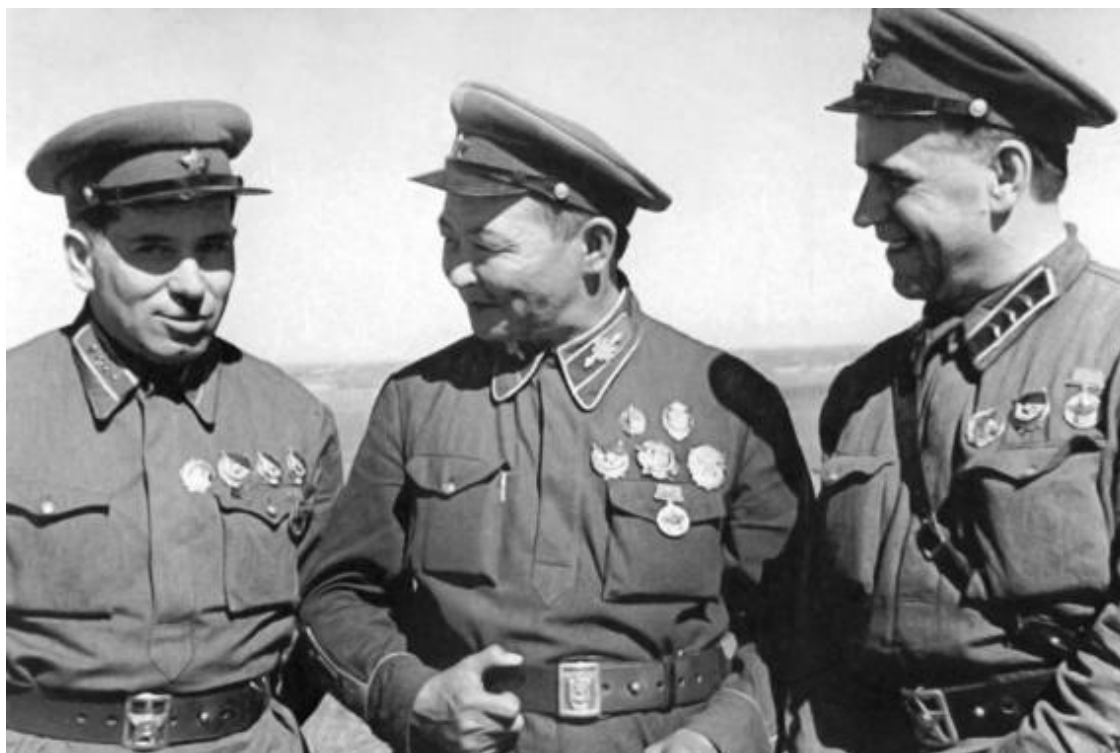
Командующий фронтовой группой командарм 2-го ранга Г.М.Штерн, командующий армией МНР маршал Х. Чойбалсан и командующий 1-й армейской группой комкор Г.К. Жуков.

ском военном округе. Предположить, что Георгий Константинович за несколько лет службы в Белоруссии приобрел бесценный опыт действий в пустынях и степях, было бы безумием. Служивший с 1936 г. в Монголии Фекленко знал театр военных действий гораздо лучше. Более подходящим в сравнении с Жуковым кандидатом был, например, служивший в 1930–1933 гг. в Туркестане кавалерист Д.И. Рябышев. В конце концов, можно было вернуть на пост первого командира особого корпуса в Монголии – И.С. Конева. Он еще со времен Гражданской войны был знаком с дальневосточным ТВД.