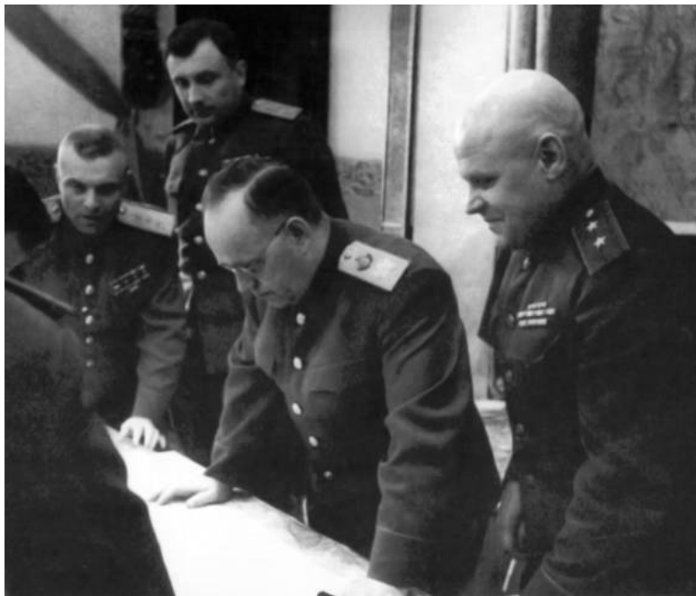
Жуков над картой. 1945 г.

детально ответить полководец. Уже эти записи имеет смысл обрабатывать литературно. Литераторы просто не обладали достаточными знаниями, чтобы задавать действительно грамотные вопросы полководцам великой войны. Поэтому многие вещи, к сожалению, оказались безвозвратно утрачены.