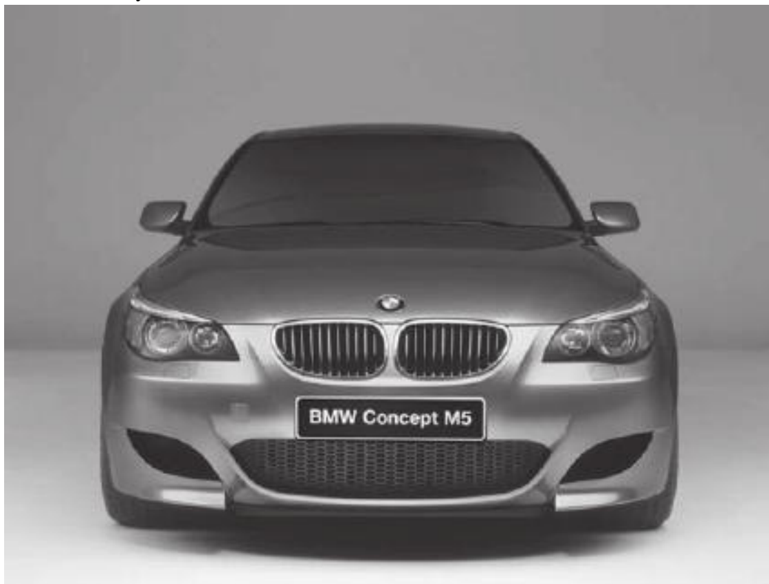
Рис. 3.2. Автомобиль «БМВ»

Чтобы убедиться в исправности амортизаторов машины, качните автомобиль сильным нажатием на крыло: если амортизаторы исправны, то автомобиль вернется в неподвижное состояние после двух колебаний.