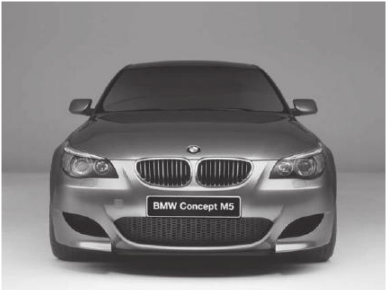
Рис. 3.2. Автомобиль «БМВ»

Чтобы убедиться в исправности амортизаторов машины, качните автомобиль сильным нажатием на крыло: если амортизаторы исправны, то автомобиль вернется в неподвижное состояние после двух колебаний.