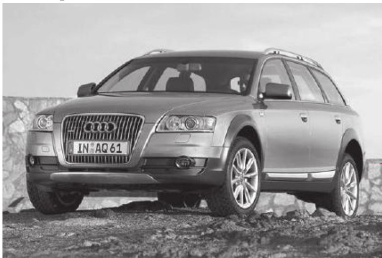
Рис. 3.1. Автомобиль «Ауди»

ных, поскольку сделан из оцинкованного листа (рис. 3.1). Но это относится только к автомобилям, выпущенным после 1986 года (ранее кузова не оцинковывались). Отметим, что покупать машины старше 1986 года не рекомендуется не только из-за кузова, но и по другим понятным причинам (это просто-напросто самый настоящий хлам на колесах).