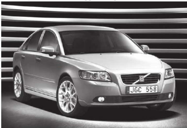
Рис. 3.3. Автомобиль «Вольво»

крепких и устойчивых к коррозии (рис. 3.3).