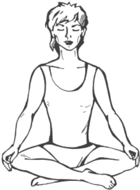
Рисунок 2. Сукхасана

Постарайтесь при этом расслабиться. Отрешитесь от посторонних мыслей и представьте, что вы очень богаты. Впитайте в себя этот образ, слейтесь с ним воедино. Ощутите себя счастливым, получите радость от прибыли, которую