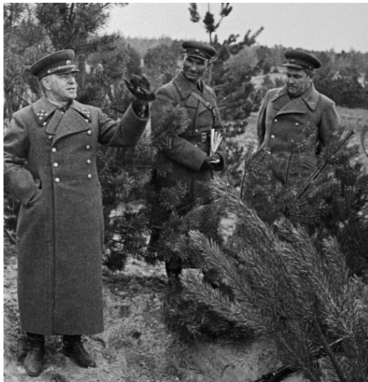
Жуков (первый слева) в дни блокады Ленинграда