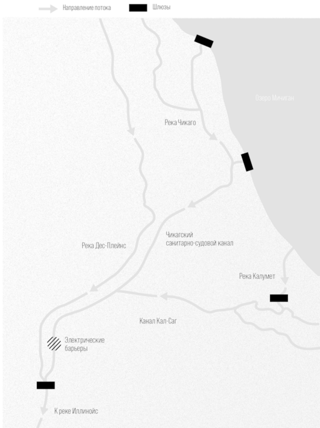
Чикагский санитарно-судовой канал развернул реку в сторону от озера

Первый электрический барьер ввели в эксплуатацию 9 апреля 2002 г. Он должен был защитить от рыбок с лягушачьей мордочкой, которые называются бычки-кругляки. Эти бычки родом из Каспийского моря активно поедают икру других рыб. Они обосновались в озере Мичиган, и появилось подозрение, что через Санитарно-судовой канал рыбы проникнут в реку