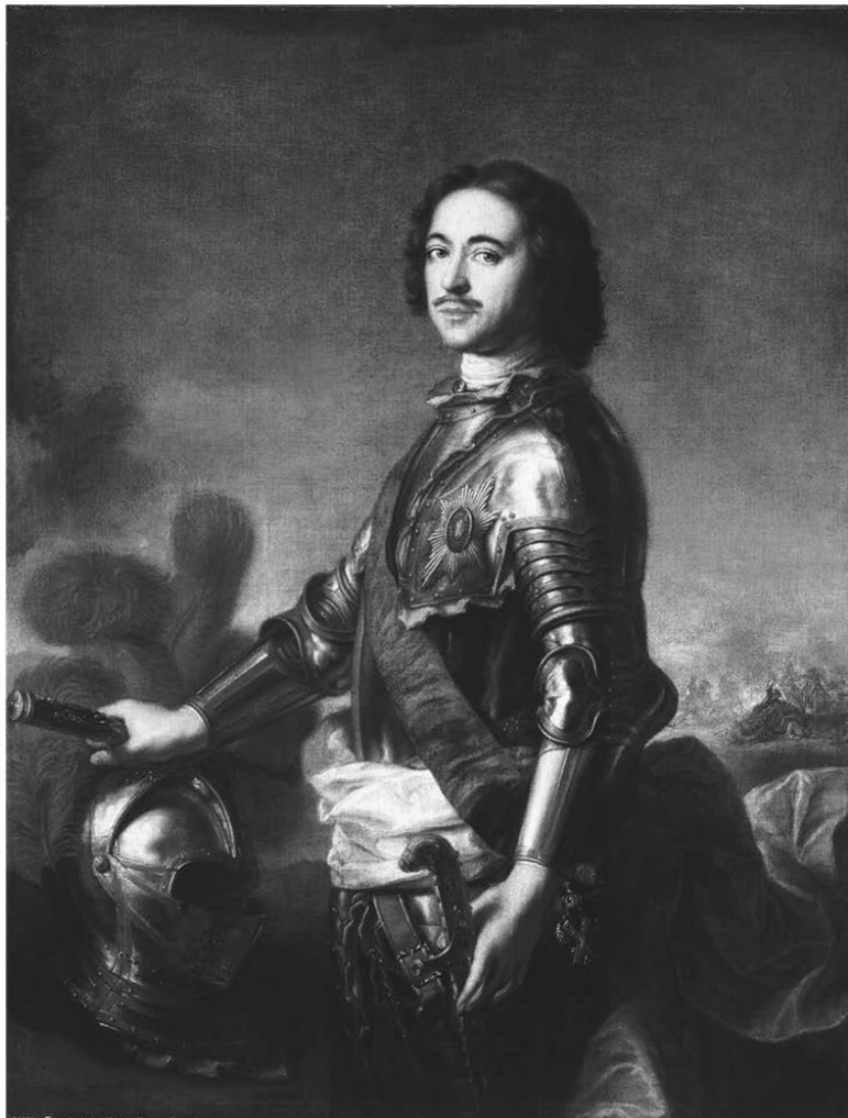
Ж.-М. Натье. Портрет императора Петра 1. 1717 г.