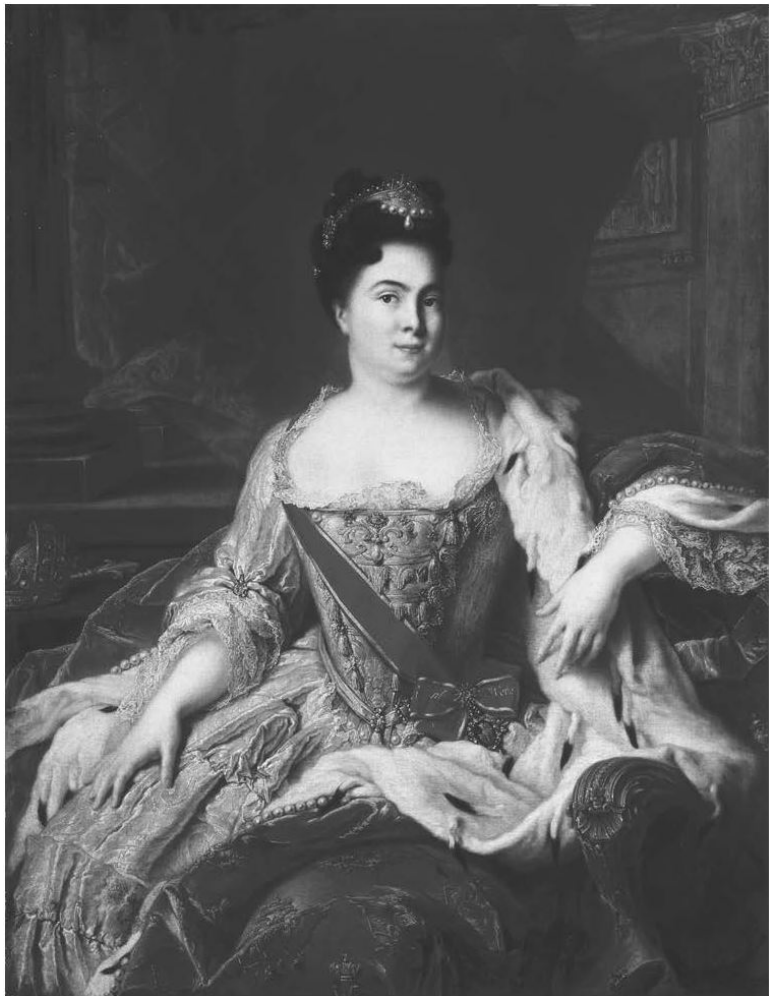
Ж.-М. Натье. Портрет императрицы Екатерины I. 1717 г.