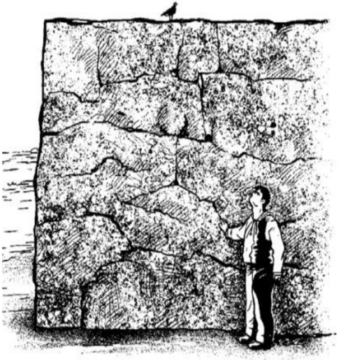
Рис. 2. Задача Эдисона: надо без всяких орудий сдвинуть с места трехтонную гранитную скалу в 100 футов длины и 15 футов высоты

Дознаемся же сами, какова должна быть толщина этой скалы. Прежде всего определим по весу ее объем. Скала гранитная, а сколько весит кубический метр гранита, мы можем узнать из справочника. В «таблице удельных весов» разных материалов находим, что удельный вес гранита, круглым числом, 3. Это значит, что кубический сантиметр гранита весит 3 г или кубический метр гранита весит 3 т. Одно вытекает из другого, потому что в кубическом метре миллион кубических сантиметров, а в одной тонне – миллион граммов. Но если каждый кубический метр Эдисоновой глыбы весит 3 т, а весу в глыбе как раз 3 т, то ясно, что объем ее – всего один кубический метр. При таком небольшом объеме глыба однако растянулась в длину на 100 футов, а в высоту – на 15 футов.