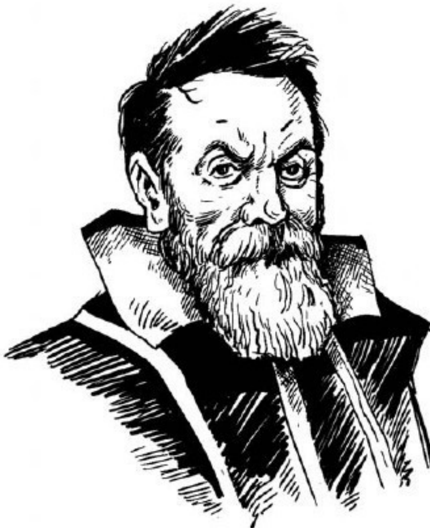
Рис. 7. Галилей, основатель физики

Вероятно, вам интересно будет прочитать подлинный отрывок из его книги, где он говорит о падении тел и где мысли, сейчас изложенные, установлены были впервые. Отрывок представляет спор между двумя учеными. Один держится старинного взгляда на падение вещей, взгляда, установленного древним мыслителем Аристотелем; учения Аристотеля слепо придерживались все ученые, жившие во времена Галилея. Другой участник спора – сам Галилей.