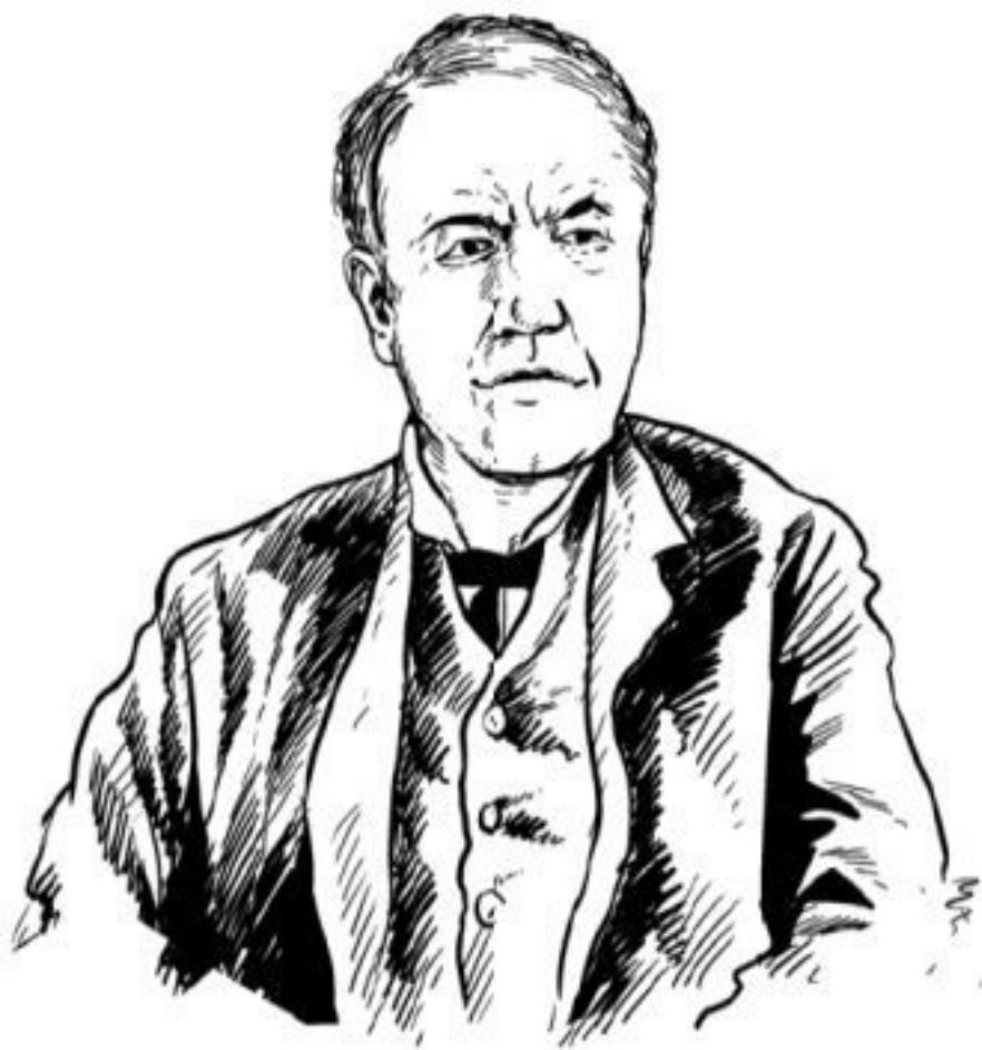
Рис. 1. Томас Алва Эдисон (1847–1931), американский изобретатель и предприниматель

Вообразите, что вы очутились на тропическом острове Тихого океана без всяких орудий. Как сдвинули бы вы там с места груз в 3 т, например гранитную глыбу в 100 футов длины и 15 футов высоты?