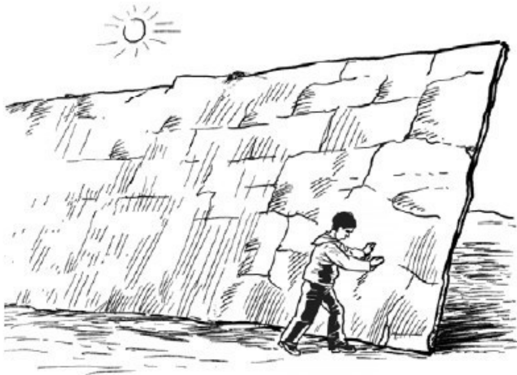
Рис. 3. Вот какова скала в задаче Эдисона

Очевидно, она очень тонка. Прикинем, какой она толщины. Объем, как известно, получается умножением длины на ширину и на толщину. Следовательно, разделив объем на длину и на ширину, мы узнаем толщину. Так и поступим с объемом нашей скалы: разделим 1 кубометр сначала на 100 футов (т. е. на 30 м) потом на 15 футов (т. е. примерно на 5 м), а еще лучше – сразу на 30 \times 5 , т. е. на 150. Что же получится? Всего \frac{1}{150} м, или около 7 миллиметров.