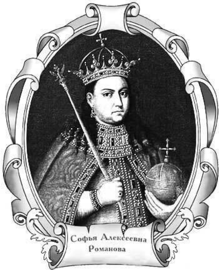
Софья Алексеевна Романова