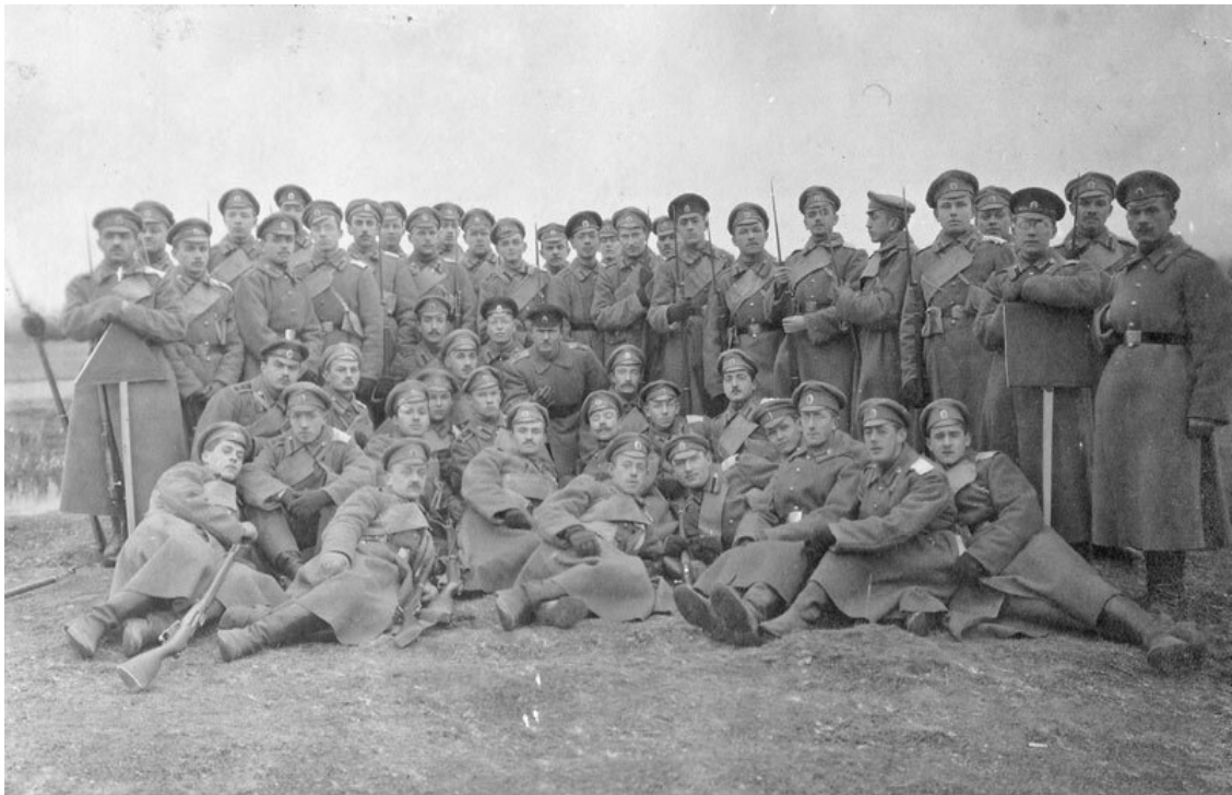
«Служба дозоров», октябрь 1916 г.