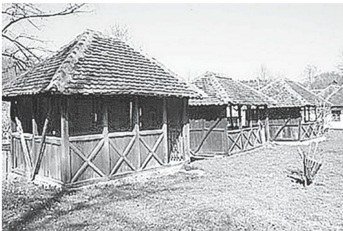
Собрашице в сербском селе Бранковина

Исторические факты часто используются или же искажаются политиками для доказательства собственной правоты. Противопоставление «пришлых» сербов «коренным» албанцам используется для обоснования претензий последних на исконно сербские земли. Гипотезу автохтонности сербов на Балканах западные историки и политики не признают и не рассматривают, что не только несправедливо, но и ненаучно. В науке подход к гипотезам таков: пока одна из них не получает обоснования, нужно рассматривать все логичные версии. Или не рассматривать ничего. А то ведь как-то некрасиво получается: византийцам в данном вопросе доверяют, а славянам и галлам – нет.