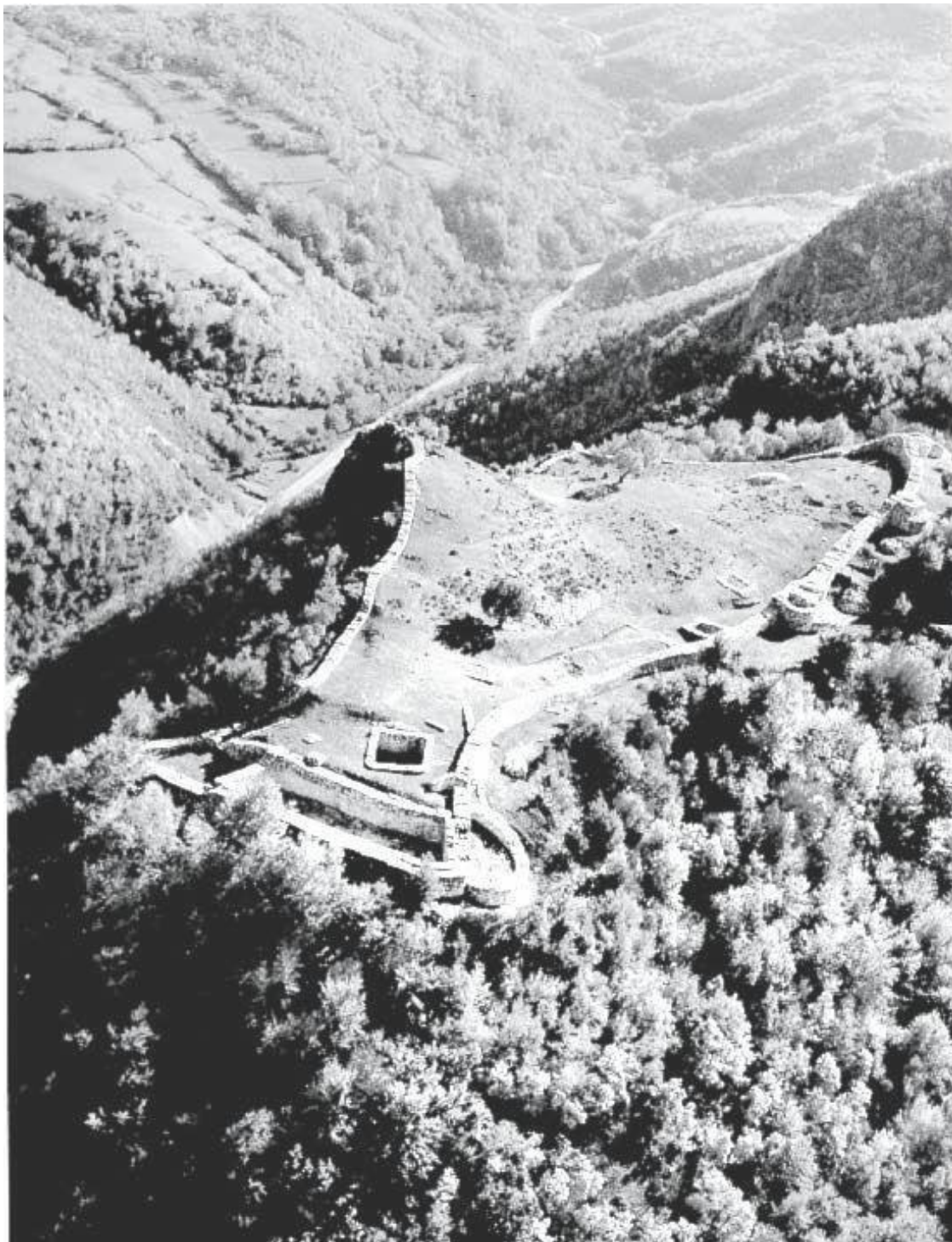
Древний город Стари-Рас. Начало XXI в.

О предках Властимира, правившего в Рашке, известно немного. Прадед его Вышеслав правил сербами на Балканах с 730 по 780 год. Вышеславу наследовал его сын Радослав, княживший с 780 по 822 год. Радослав передал бразды правления своему сыну Просигию, отцу Властимира. Если допустить, что Вышеслав был первым самостоятельным сербским князем, то Властимиру досталось крепко стоявшее на ногах княжество. Три поколения – это довольно солидный срок.