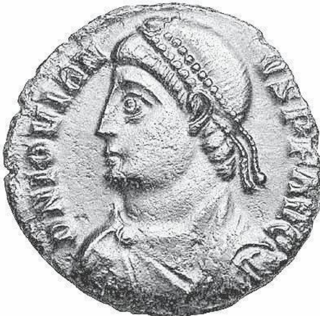
Монета с профилем Флавия Клавдия Иовиана

тем, что в 332 году здесь родился будущий император Рима Флавий Клавдий Иовиан, который правил всего семь месяцев, но успел восстановить христианство в качестве официальной религии Римской империи и вернул христианской церкви все привилегии, отнятые у нее его предшественником Юлианом, рьяным сторонником язычества.