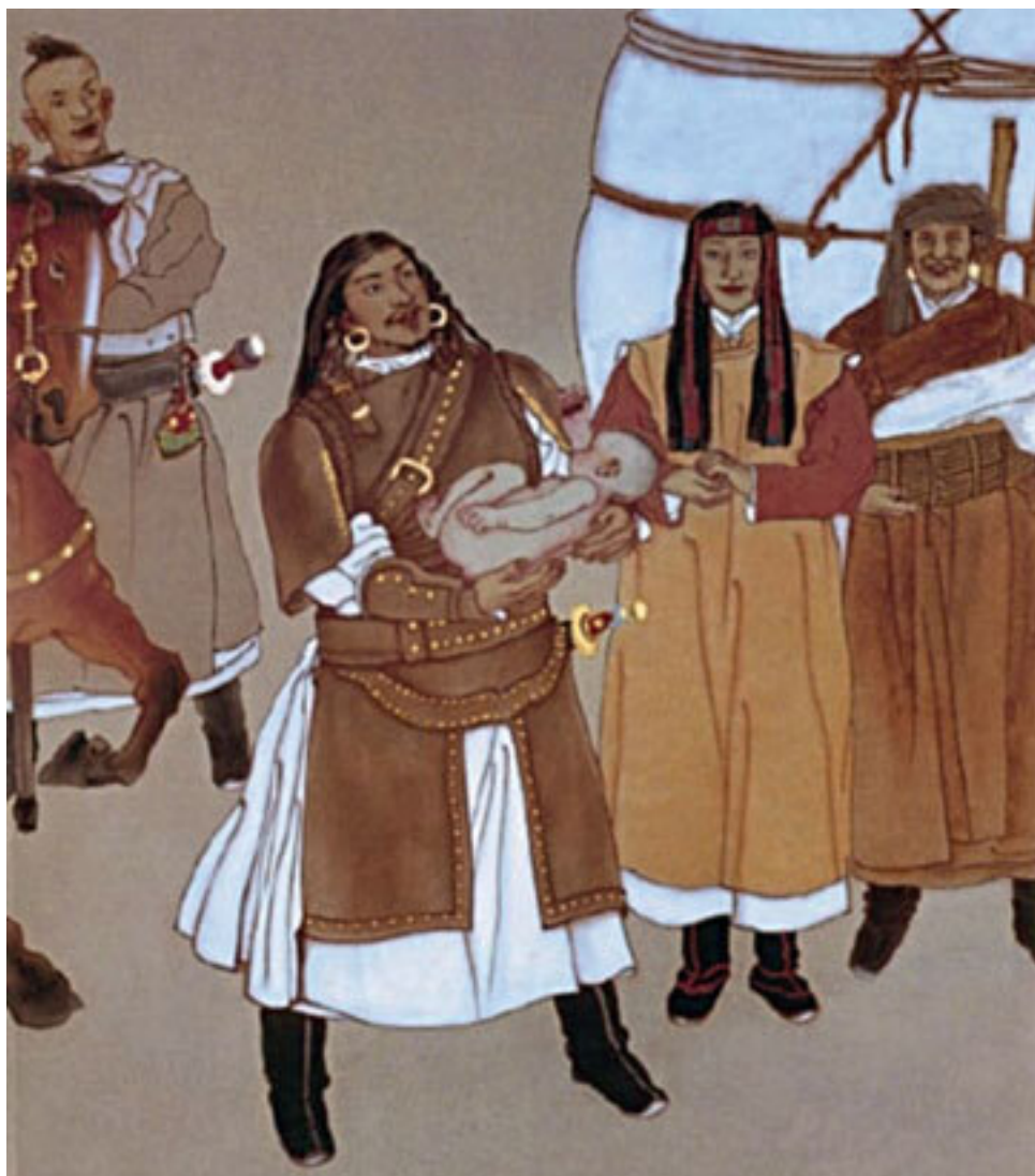
Есухэй-батор и Огэлун с новорожденным Тэмужином. Современная настенная живопись. Мемориал Чингисхана в Ордосе (КНР)