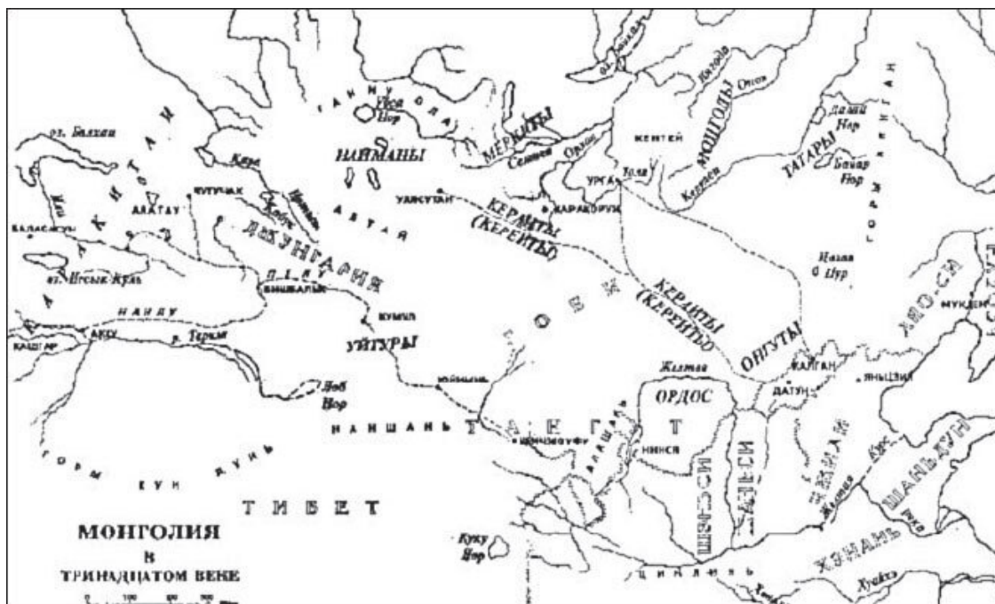
Монголия в XIII веке.

Последующие события, о которых повествуют наши источники, пожалуй, безоговорочно свидетельствуют о правоте последних суждений.