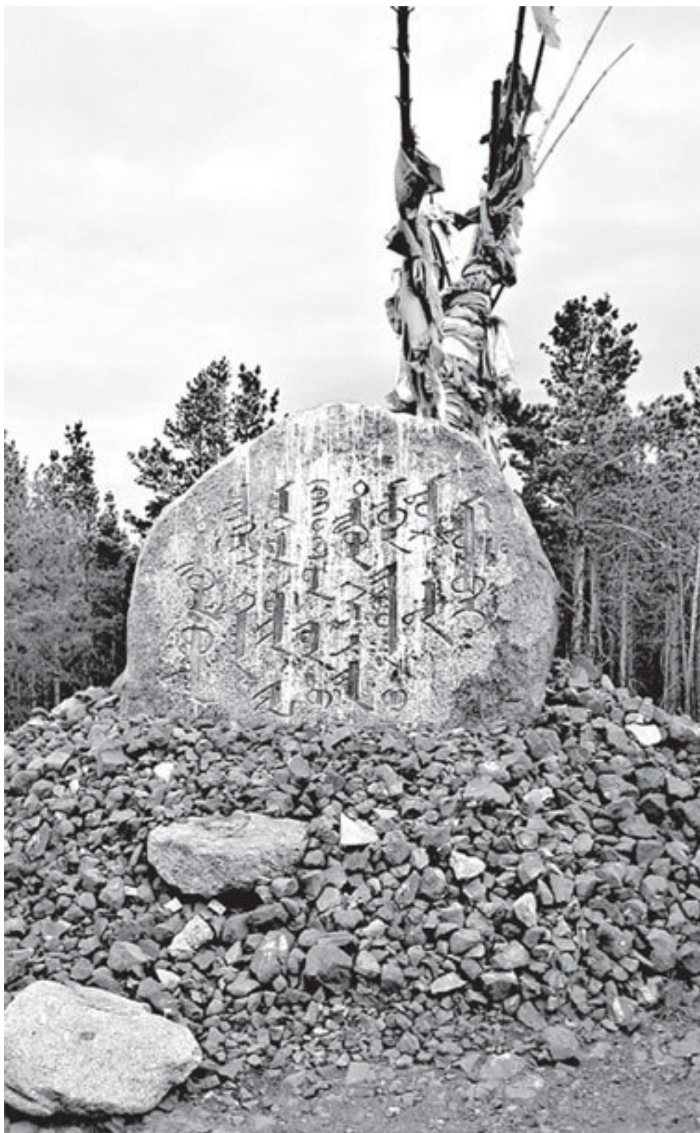
Памятный камень, установленный в долине Дэлун болдог (Хэнтэйский аймак, Монголия) на предполагаемом месте рождения Тэмужина-Чингисхана.

История рождения Тэмужина-Чингисхана овеяна многочисленными легендами. В частности, примечательны слова Чингисхана, с которыми он впоследствии (в период их противостояния) обратился к сыну Торил-Ван-хана, Сэнгуму: «Родился я в “отцовском дэле (халате. —