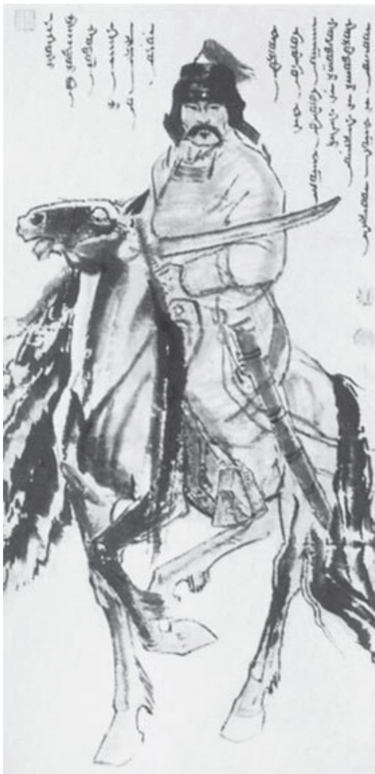
Есукхэй-батор – отец Тэмужина – Чингисхана.

В конце концов, царство утвердилось за ним (Он-ханом. – А. М.)» 121 .