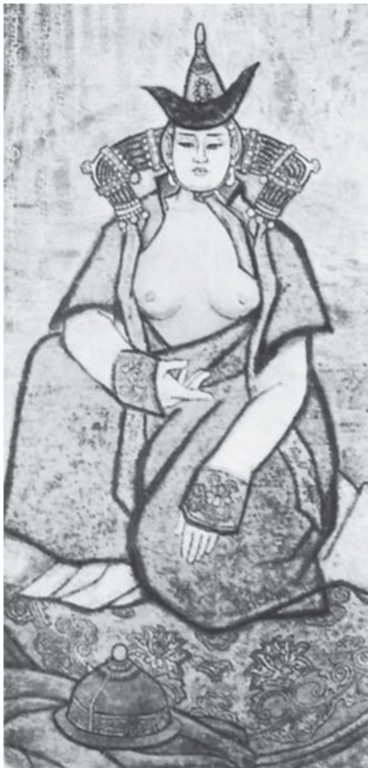
Огэлун – мать Тэмужина – Чингисхана.

Однако в смутные времена войн и набегов, дабы не подвергать себя риску дальних поездок за невестами, монголы не брезговали и их умыканием, в первую очередь, из племен, с которыми они враждовали, как это сделал с помощью братьев Есухэй-батор: «Охотившийся в