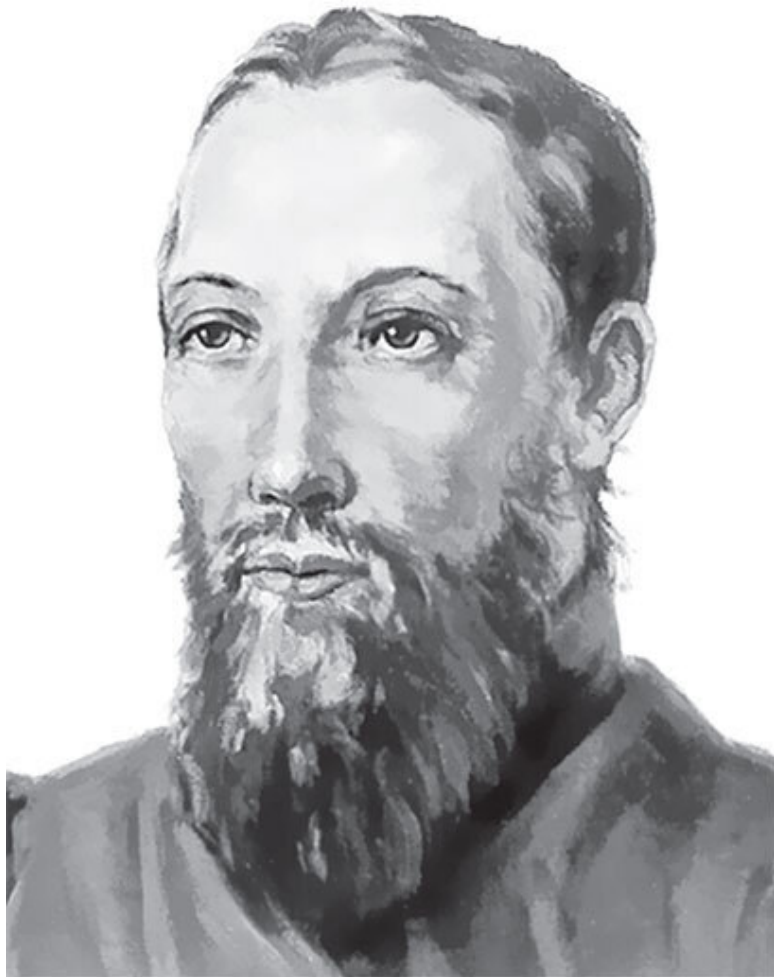
Н. Я. Бичурин (о. Иоакимф) (1777–1853) – выдающийся русский востоковед, один из основоположников российской