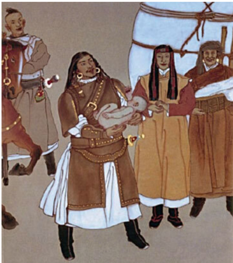
Есухэй-батор и Огэлун с новорожденным Тэмужином. Современная настенная живопись. Мемориал Чингисхана