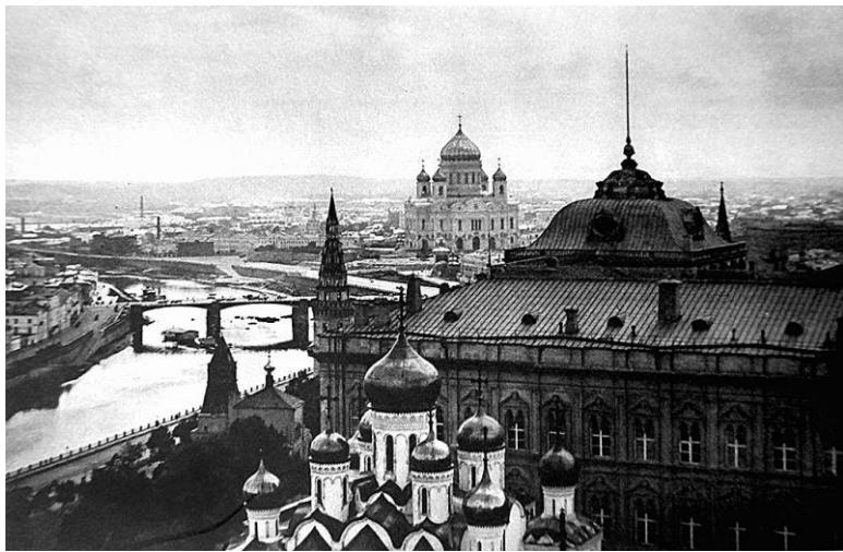
Илл. 1.8. Вид с колокольни Ивана Великого на запад. На дальнем плане – храм Христа Спасителя. (Alexys A. Sidorow. Moskau... )

плотно застроенный участок, примыкающий к Дому Союзов, между Охотным Рядом, Тверской, Георгиевским переулком и Большой Дмитровкой. К 1930 году обследование этого участка площадью почти 28 тысяч квадратных метров было завершено. В докладе, представленном в мае 1930 года, подтверждалось, что использование этого третьего участка потребует переселения 1500 жителей, а также разрушения разных нежилых зданий, стоящих рядом, в том числе гостиницы, приносящей государству ежегодную прибыль в размере 550 тысяч рублей, и общая стоимость построек, стоящих на территории обследованного участка, оценивалась в 3054240 рублей. Окончательное решение строить Дворец Советов на месте храма Христа Спасителя было принято в июне 1931 года (ГА РФ. Ф. Р-3316. Оп. 64. Д. 562. Л. 1–3, 23,51).