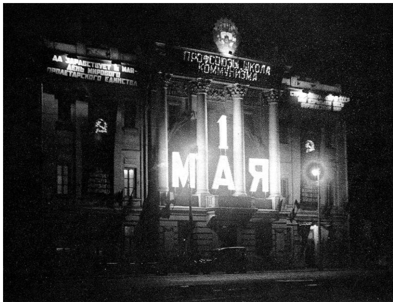
Илл. 1.7 Дом Союзов, украшенный к 1 мая. (Alexys A. Sidorow. Moskau... )