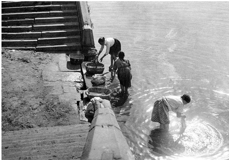
Илл. 1.4. Прачки на Москве-реке. (Alexys A. Sidorow. Moskau... )