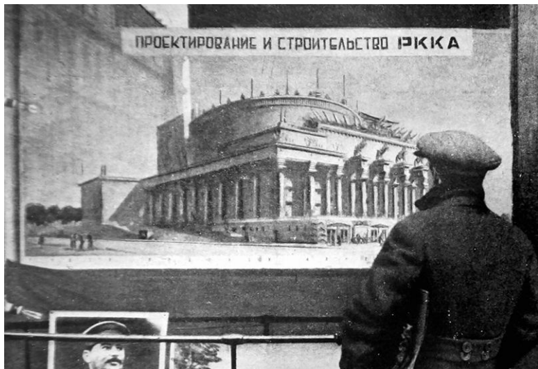
Илл. 1.6. Витрина на улице Горького. ( Архитектура СССР . 1934. № 1)

В 1920-е годы московские съезды комсомола, первомайские парады и праздничная иллюминация происходили главным образом в культурных пространствах дореволюционной России. Не считая немногочисленных новых зданий, большинство советских учреждений разместились в бывших дворцах и купеческих особняках. Московский купеческий клуб в стиле модерн, построенный в 1907–1909 годах, сделался в 1927 году Театром рабочей молодежи. Особняк в неомавританском стиле, построенный в конце XIX века для одного из Морозовых (богатеишей династии крупных про-