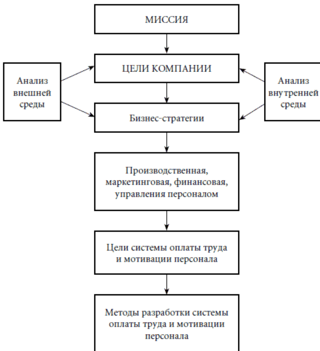
Рис. 1.1. Алгоритм разработки системы оплаты труда и мотивации персонала

Для определения целей предприятия можно использовать стандартный алгоритм, представленный на рис. 1.1.