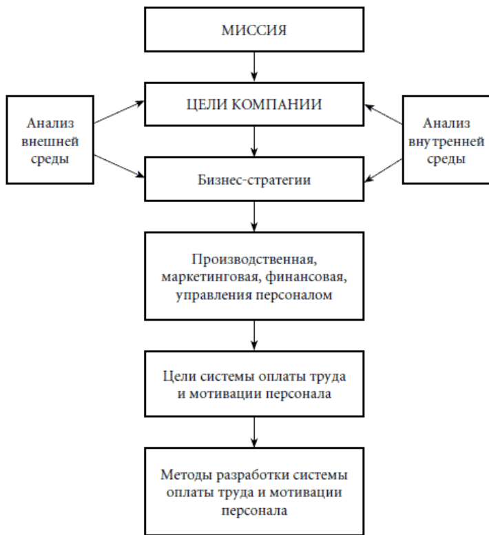
Рис. 1.1. Алгоритм разработки системы оплаты труда и мотивации персонала

Предлагаемая схема демонстрирует, что сначала на основе миссии компании, анализа ее внешней и внутренней среды нужно определить стратегические цели, выбрать страте-