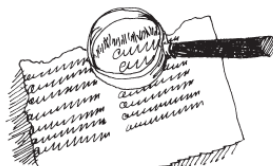
Рис. 2. Ищем волокна

Иногда бумагу метко называют «паутиной слов». На самом же деле бумага – это коврик из крошечных волокон растительного вещества, которое называется целлюлоза. В растениях эти волокна соединены между собой другим веществом – лигнином. Если растолочь их и подвергнуть химической обработке, то тонкие волокна целлюлозы разделятся. А потом, переплетаясь, они образуют «паутину», и завершающее давление сгладит волокна, превращая их в тонкий гладкий лист.