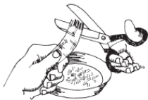
Рис. 4. В поисках волокон (первый шаг к получению бумаги)

Требуется: старый льняной или хлопчатобумажный носовой платок; ножницы; миска.