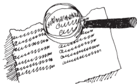
Рис. 2. Ищем волокна

Иногда бумагу метко называют «паутиной слов». На самом же деле бумага – это коврик из крошечных волокон растительного вещества, которое называется целлюлоза. В растениях эти волокна соединены между собой другим веществом – лигнином. Если растолочь их и подвергнуть химической обработке, то тонкие волокна целлюлозы разделятся. А потом, переплетаясь, они образуют «паутину», и завершающее давление сгладит волокна, превращая их в тонкий гладкий лист.