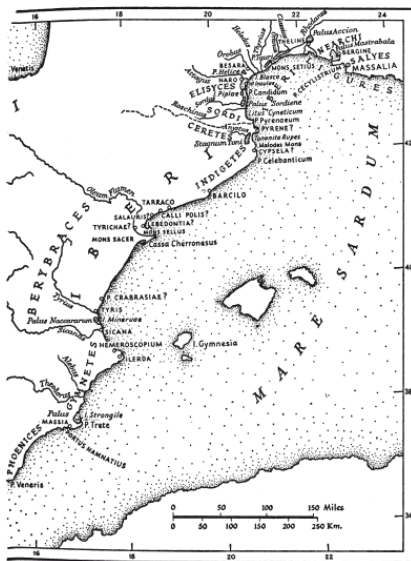
Рис. 1. Иберийский полуостров по « Ora Maritima » (в интерпретации Шультена и с поправками Гарсия Бельидо)

В античные времена, как и сейчас, Месета была хлебной житницей Испании. Древняя экономика основывалась на выращивании пшеницы, ячменя и ржи, а также на разведении овец и свиней.