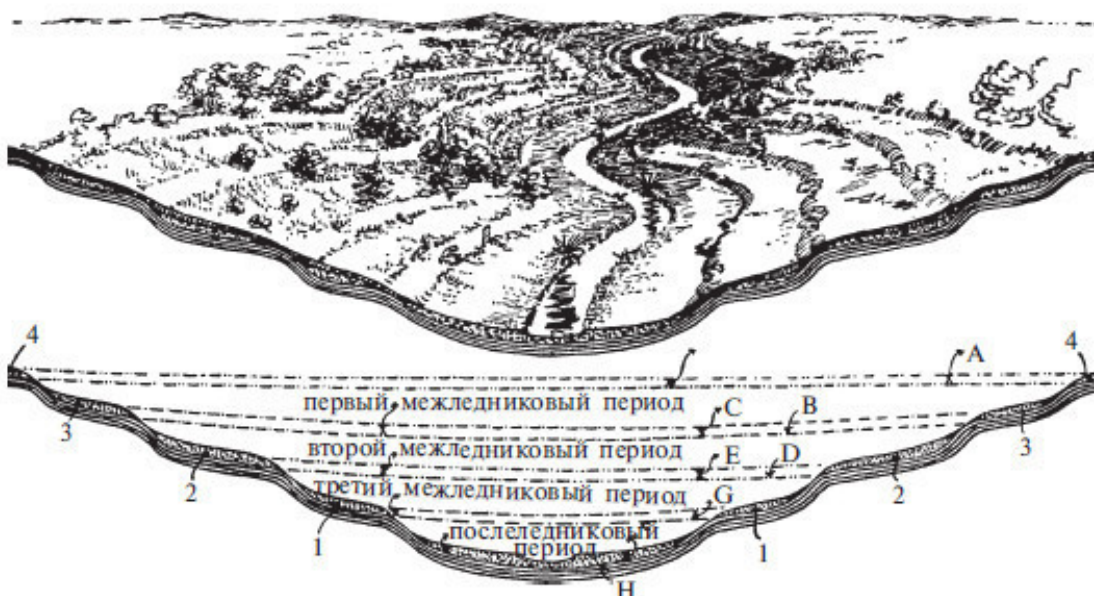
Рис. 3. Образование речных террас (сверху вниз) плейстоцен, или доледниковый период

Конечные морены обычно имеют веерообразную форму и представляют собой гряду каменных обломков, поднятых ледником с ложа и краев долины, образованную под давлением ледникового «языка». Появившиеся конечные морены, которые уже успели покрыться почвой, зарости деревьями и теперь напоминают холмы, свидетельствуют о прошедшем ледниковом периоде. На западе конечные морены обнаружены у французского города Лиона, и это доказывает, что в незапамятные времена швейцарские ледники простирались на огромные территории. «Бараньи лбы» на высоких пограничных склонах долины указывают на то, что когда-то ледники были гораздо глубже. Все эти факты помогают ученым сделать вывод относительно продолжительности ледниковых периодов и температуры в целом.