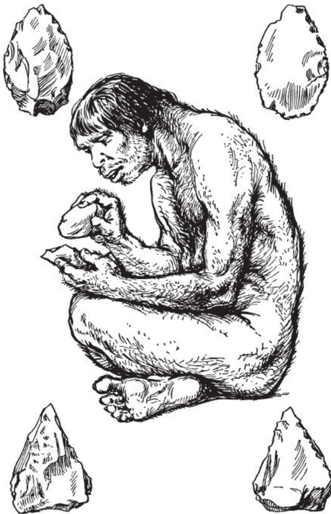
Рис. 5. Человек нижнего палеолита, изготавливающий кремневое орудие