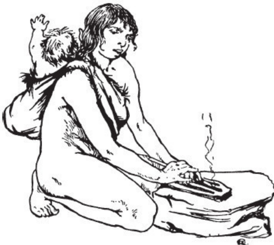
Рис. 6. Добывание огня

Когда человек открыл огонь, он уже мог готовить для себя еду и согреться и в то же время сделать твердой и острой деревянную палку, так что ей можно было пользоваться как копьем. Положите любую деревяшку в огонь; когда конец ее обгорит, отскоблите обуглившиеся части, – получится острие.