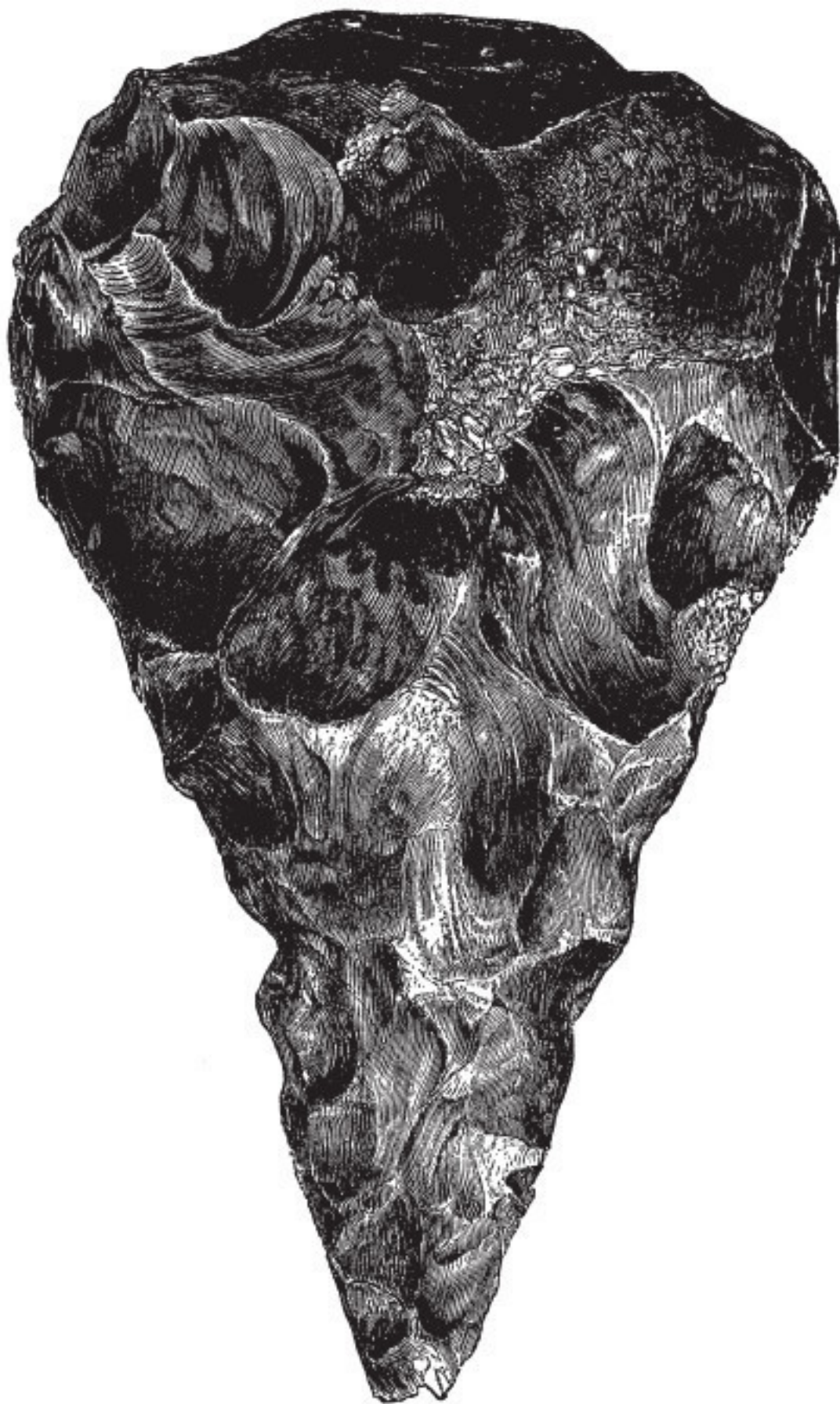
Рис. 7. Кремневое орудие, найденное в XVII веке на Грейз-Иин-Лейн. По Эвансу