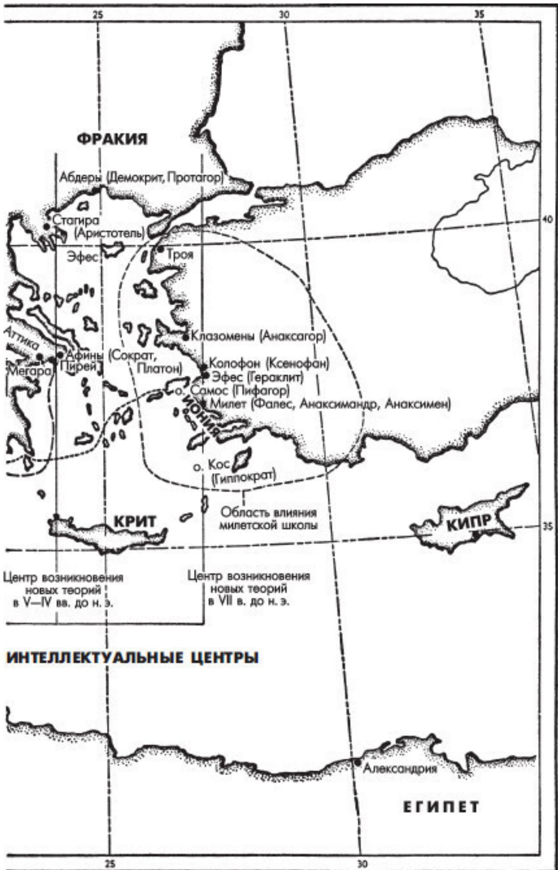
Центры греческой философии: Иония, Италия, Атика