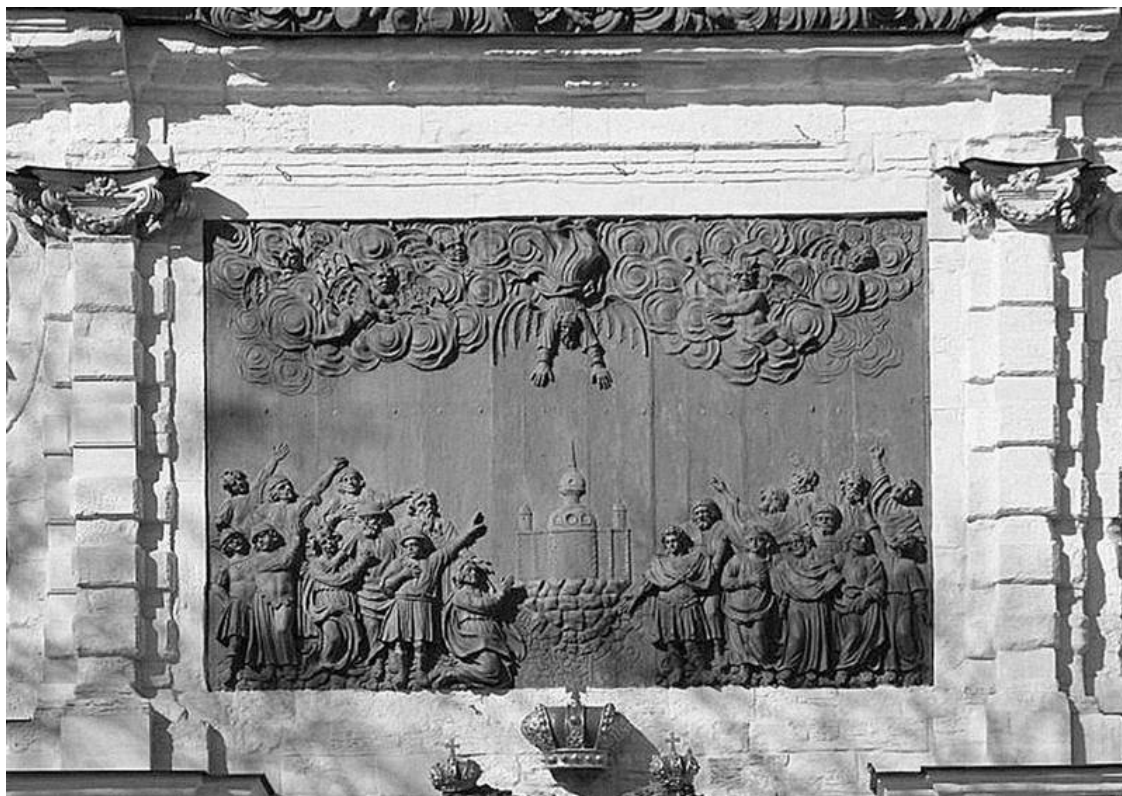
Горельеф «Низвержение Симона Волхва апостолом Петром»

Прочитируем фрагмент книги Елены Лелиной «Петропавловская крепость», вышедшей в нашей серии книг в 2012 году: