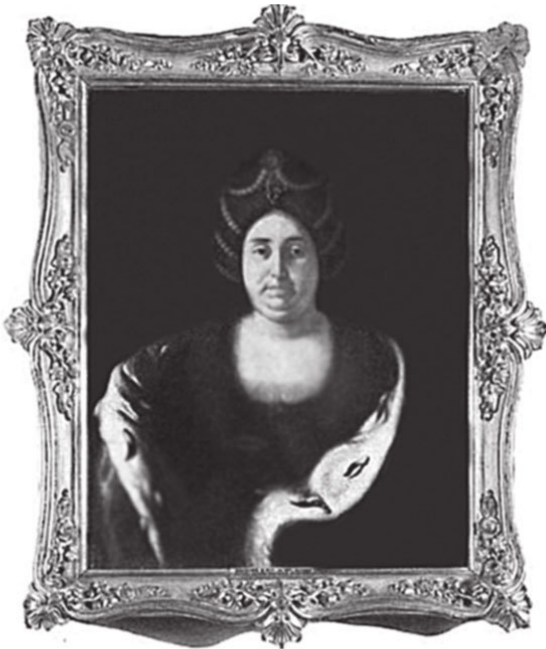
Портрет царицы Прасковьи Федоровны. Начало XVIII в.

Перехожу теперь к изображению царицы, или императрицы, Прасковьи Федоровны. Она была довольно дородна, что, впрочем, нисколько не безобразило ее, потому что она имела очень стройный стан. Можно даже сказать, что она была красива, добродушна от природы и обращения чрезвычайно привлекательного. Ей около тридцати лет. По всему этому ее очень уважает его величество царевич Алексей Петрович, часто посещает ее и трех молодых княжон, дочерей ее, из коих старшая, Екатерина Ивановна, – двенадцати лет, вторая, Анна Ивановна, – десяти и младшая, Прасковья Ивановна, – восьми лет. Все они прекрасно сложены. Средняя белокура, имеет цвет лица чрезвычайно нежный и белый, остальные две – красивые смуглянки. Младшая отличалась особенною природною живостью, а все три вообще обходительностью и приветливостью очаровательною. Любезности, которые оказывали мне при этом дворе в продолжение всего времени, когда я работал там портреты, были необыкновенны. Каждое утро меня непременно угощали разными напитками и другими освежительными, часто