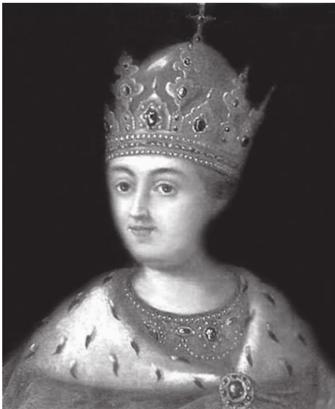
А.П. Антропов. Портрет царицы Софьи. 1772 г.

Царь Федор правил семь лет и показал себя рассудительным и деятельным юношей, подающим большие надежды, которым, однако, не суждено было воплотиться в реальность. После его смерти партия Нарышкиных на некоторое время взяла верх, им удалось провозгласить следующим царем юного Петра. Но Милославские, видя, что власть уходит у них из рук, подняли стрельцов на бунт. Многие Нарышкины были убиты. Стрельцы ворвались и в царские покои. Царица Наталья еле успела спрятать в церкви сына Петра и пасынка, 14-летнего Ивана, но там их настигли двое стрельцов с ножами. Кто-то крикнул, что у алтаря кровь проливать нельзя, убийцы замешкались, поссорились, и царица смогла спрятать царевичей в задних комнатах дворца.