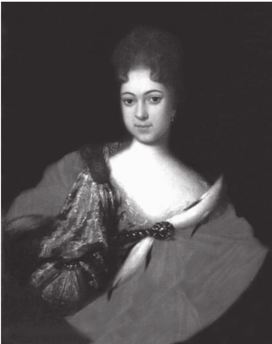
И.Н. Никитин. Портрет царевны Прасковьи Ивановны. 1714 г.

«За послом, – пишет секретарь Корб, – следовали музыканты, чтобы гармоническую мелодию своих инструментов соединить с тихим шелестом ветра, который медленно стекает с вершины деревьев. Царицы, царевич и незамужние царевны, желая немного оживить свою спокойную жизнь, которую ведут они в этом волшебном убежище, часто выходят на прогулку в рощу и любят гулять по тропинкам, где терновник распустил свои коварные ветви. Случилось, что августейшие особы гуляли, когда вдруг до их слуха долетели приятные звуки труб и флейт; они остановились, хотя возвращались уже во дворец. Музыканты, видя, что их слушают, стали играть еще приятнее. Особы царской крови, с четверть часа слушая симфонию, похвалили искусство всех артистов».