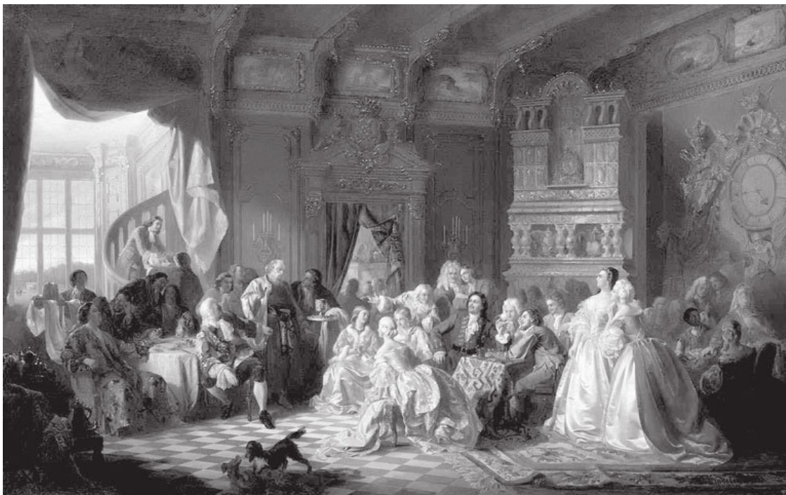
С. Хлебовский. Ассамблея при Петре I. 1858 г.

Но был еще особый, невиданный раньше род развлечений, который Петр I ввел в своем городе. Он назывался «ассамблеи».