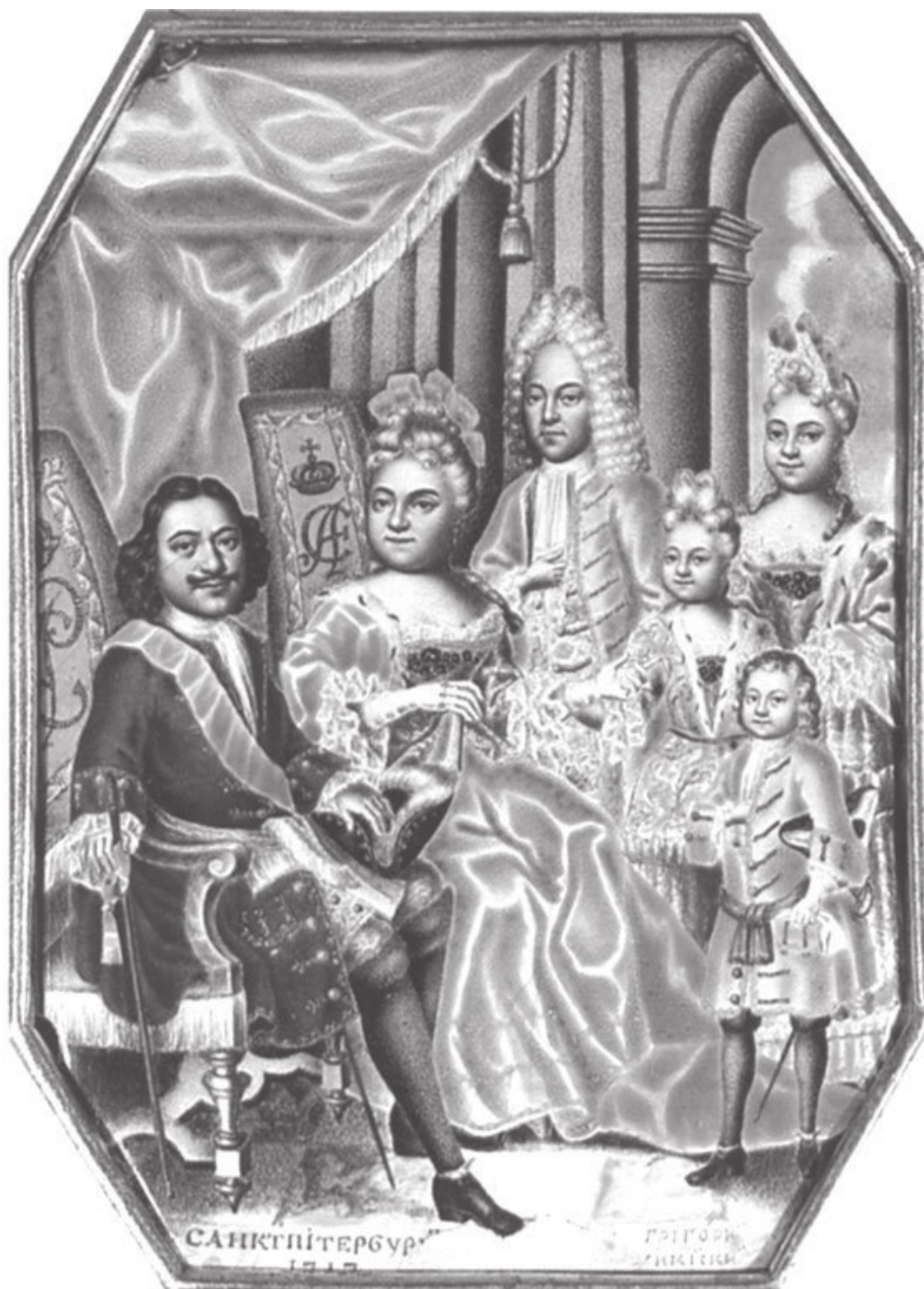
Г.С. Муסיкийский. Семейный портрет Петра I. 1716–1717 гг.

В браке рождаются дети, но они не живут долго. Царевны Наталья Петровна и Маргарита Петровна не прожили и года. Затем родился долгожданный сын Петр Петрович (через 12 дней после того, как София Шарлотта родила Петра Алексеевича). С тех пор Екатерины спешит сообщить своему «старiku» (прозвище Петра I) новости о «Шишечке» (прозвище Петра-младшего).