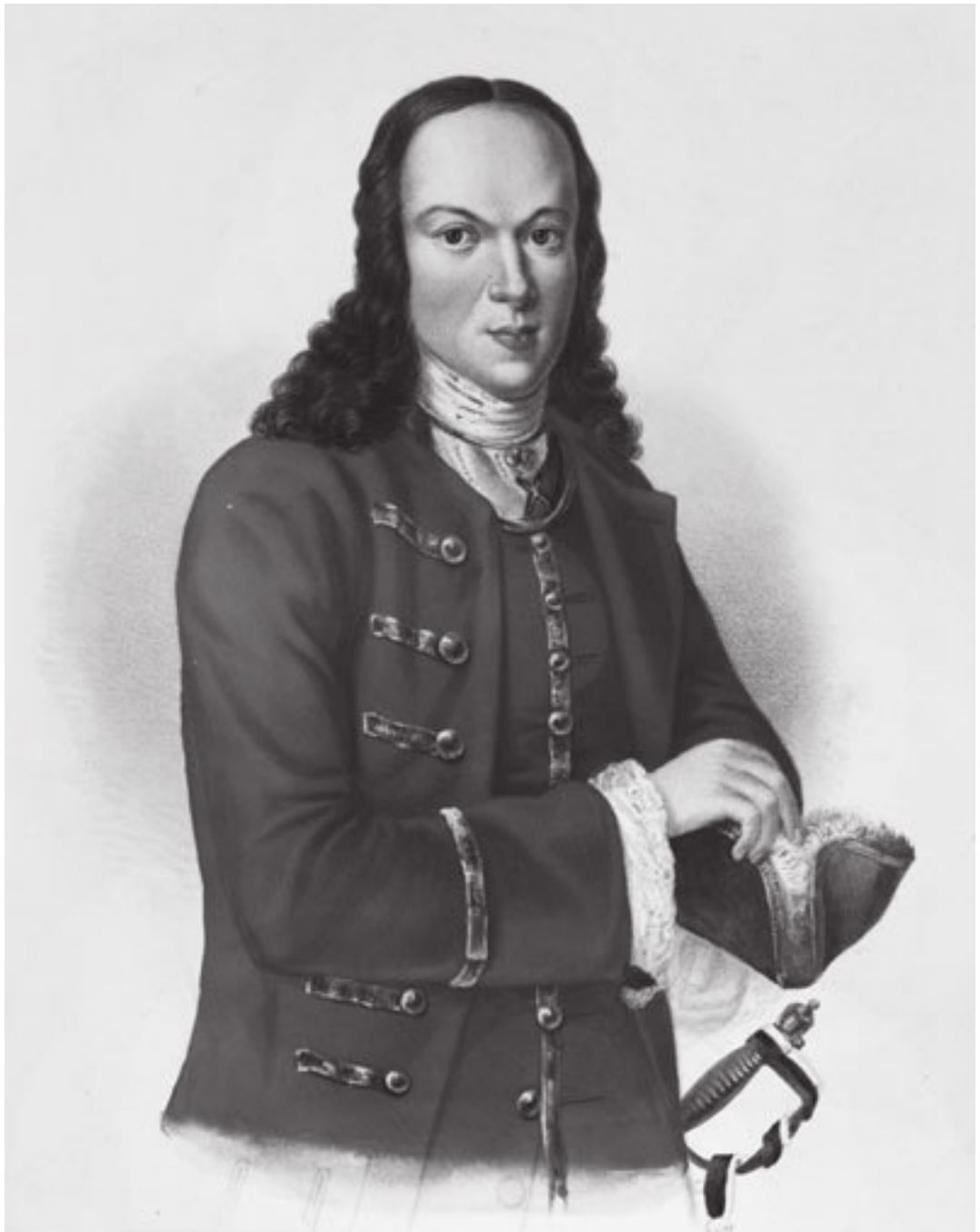
Царевич Алексей Петрович

Но эта иллюзорная страсть быстро рассеялась, и династический брак, связавший двух малознакомых людей, выросших в различных условиях, начал разрушаться изнутри. Царевич уезжал из дома, пьянствовал, изменял жене. Вскоре принцесса уже признавалась: «Мое положение гораздо печальнее и ужаснее, чем может представить чье-либо воображение. Я замужем за человеком, который меня не любил и теперь любит еще менее, чем когда-либо...»