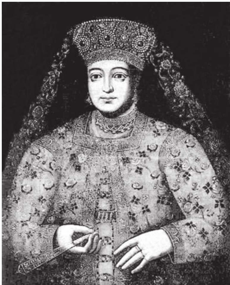
Неизв. худ. Портрет царицы Марфы Матвеевны. Конец XVII в.