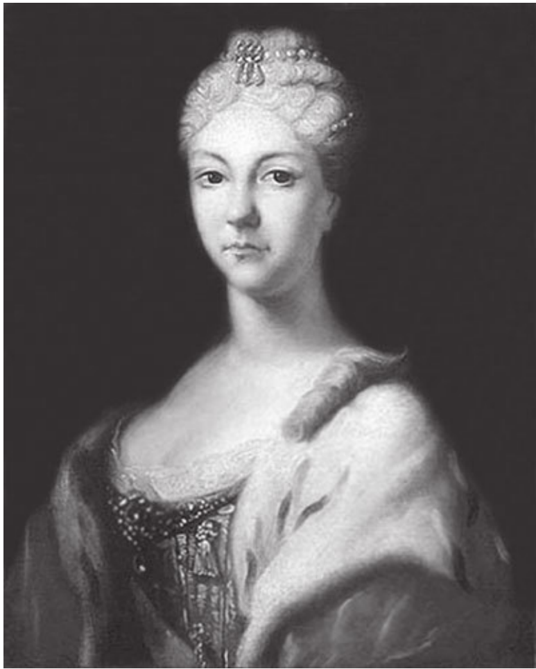
И.Н. Никитин. Портрет царевны Натальи Алексеевны. Начало XVIII в.