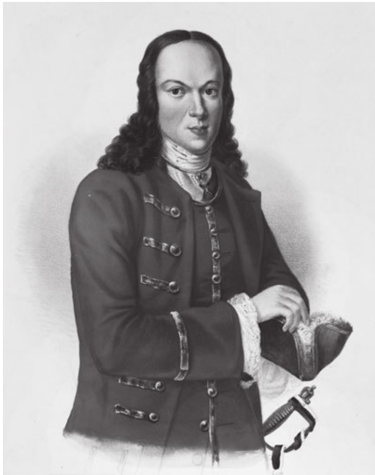
Царевич Алексей Петрович