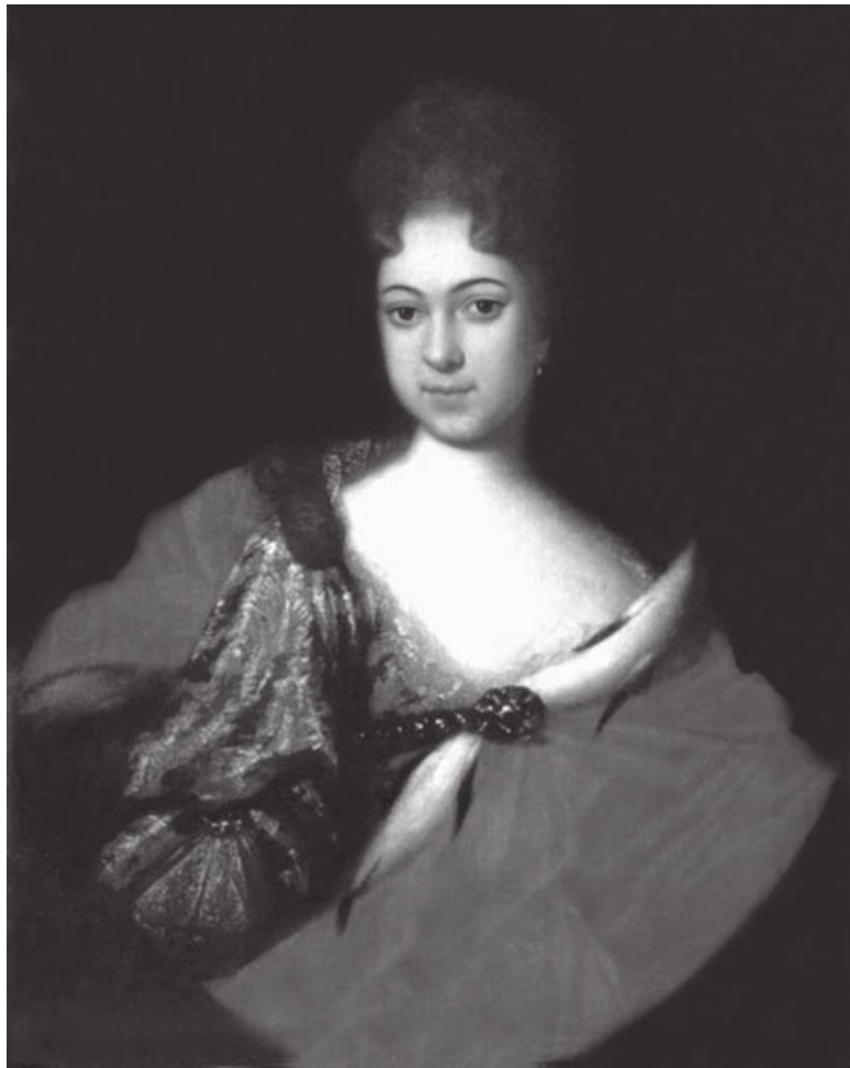
И.Н. Никитин. Портрет царевны Прасковьи Ивановны. 1714 г.