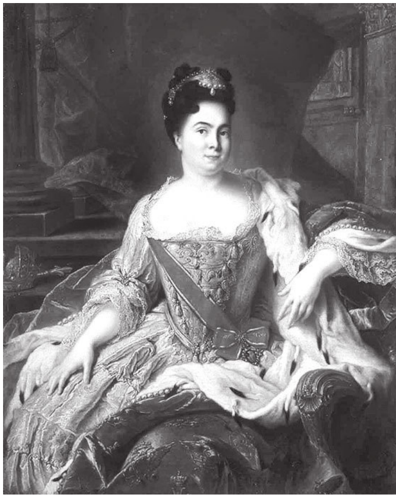
Ж.-М. Натье. Портрет императрицы Екатерины I. 1717 г.