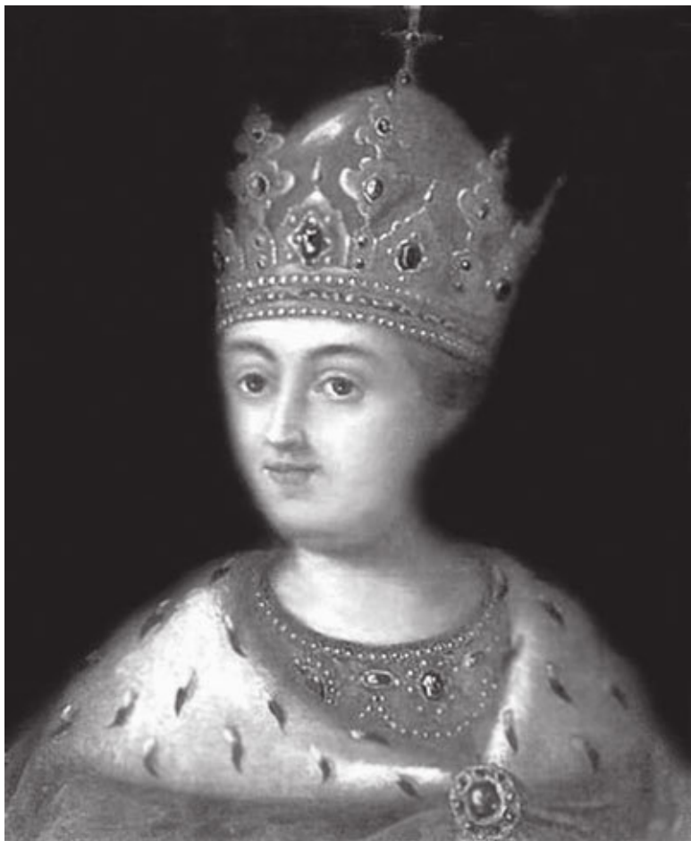
А.П. Антропов. Портрет царицы Софьи. 1772 г.

В конце концов был найден компромисс, хотя бы на сло-