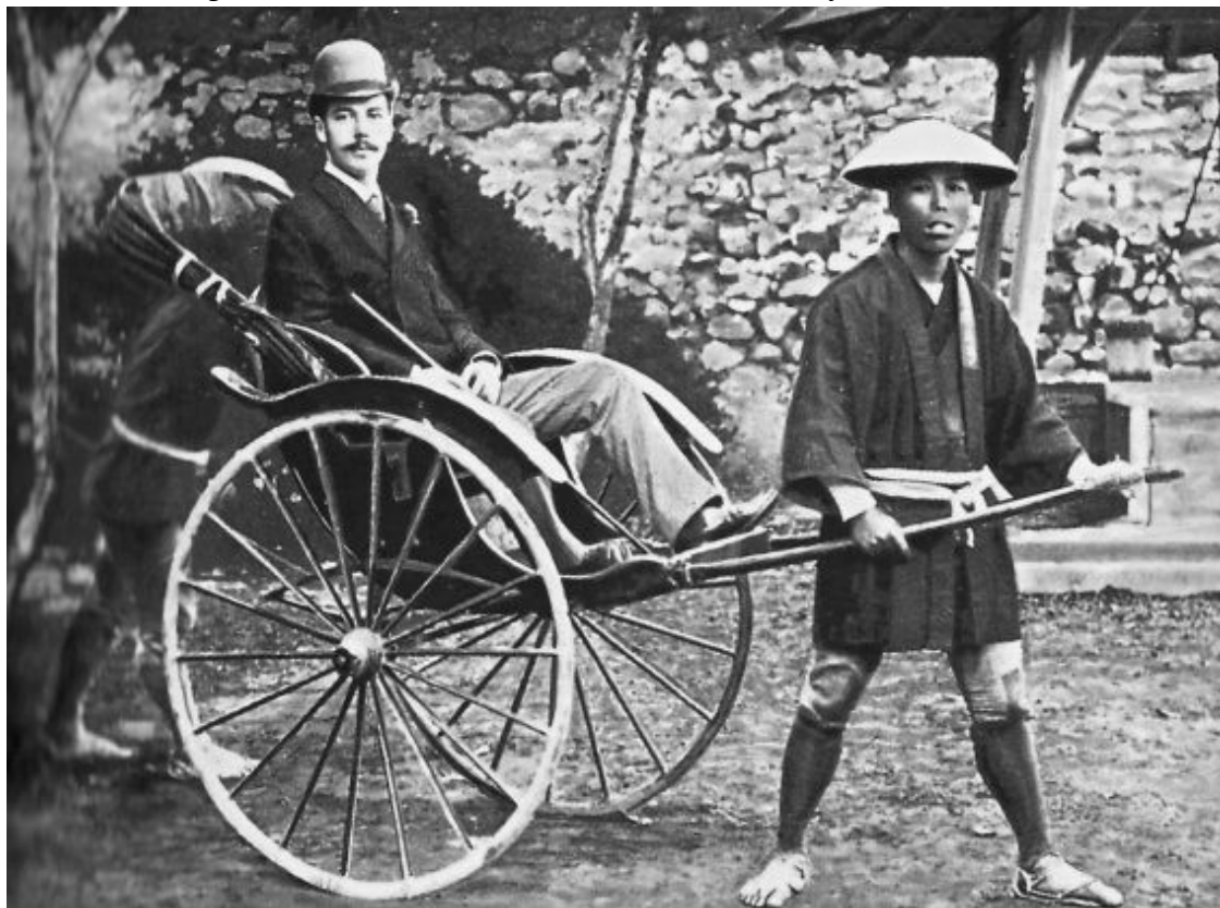
Цесаревич Николай Александрович во время путешествия по Японии. Фото 1891 г.

Традиционный и хорошо знакомый внешний облик российского императора Николая II сложился достаточно рано. Будучи еще наследником, в начале 1890-х гг. на лице молодого Николая Александровича появились небольшие, щегольские усики.