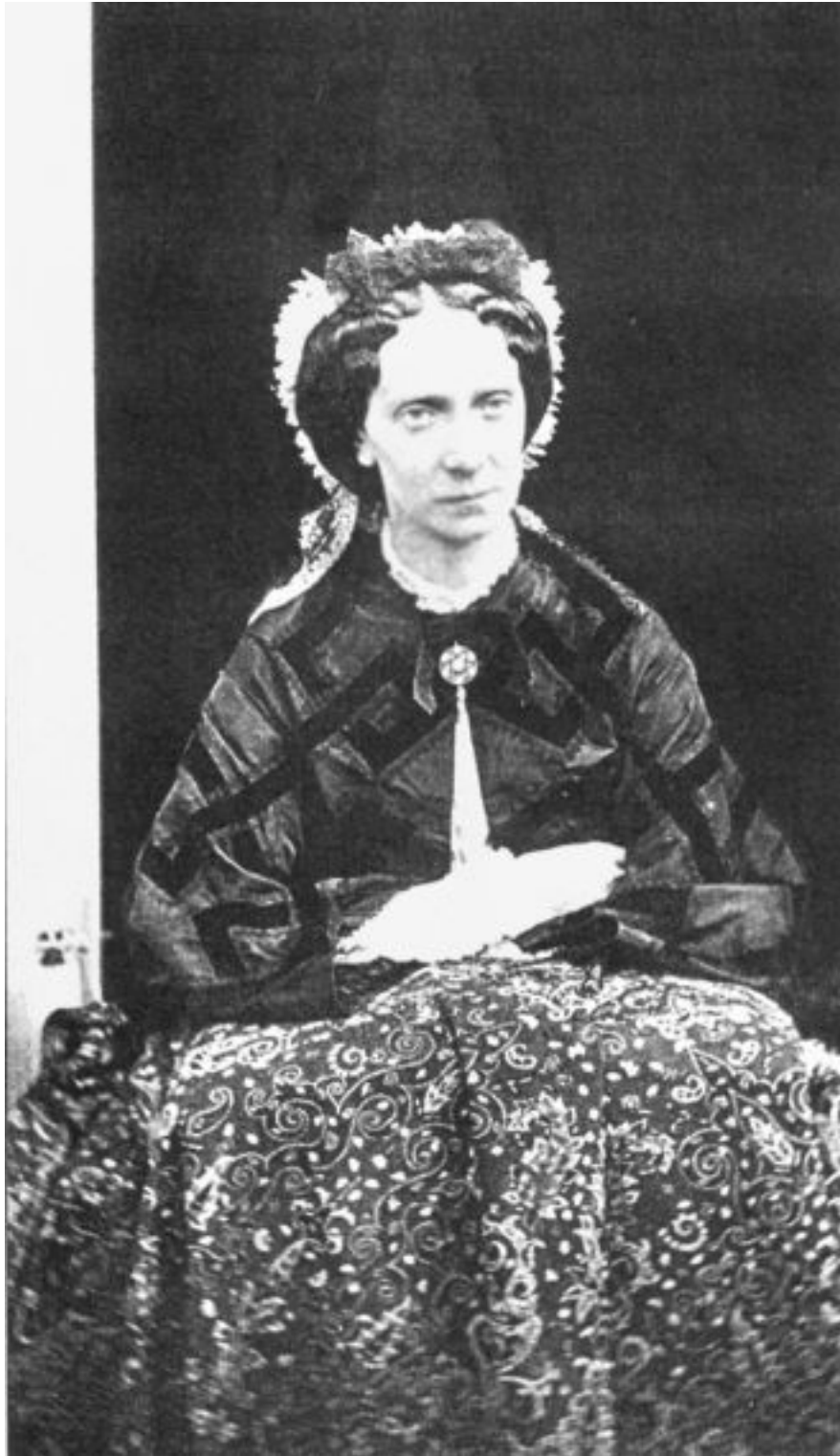
Императрица Мария Александровна. Фото 1860-х гг.

Именно о них писала камер-юнгфера императрицы А.И. Яковлева: «На левой руке она носила очень толстое обручальное кольцо и другое, такое же толстое, с узорною чеканкою, поперечник такой же толщины был прикреплен большим рубином. Это – фамильное кольцо, подаренное государем всем членам царской семьи» 46 . К сожалению, на картине правая рука императрицы просматривается не полностью, но камер-юнгфера упоминает, что «на правой руке, на четвертом пальце, великая княгиня носила множество колец; это были воспоминания