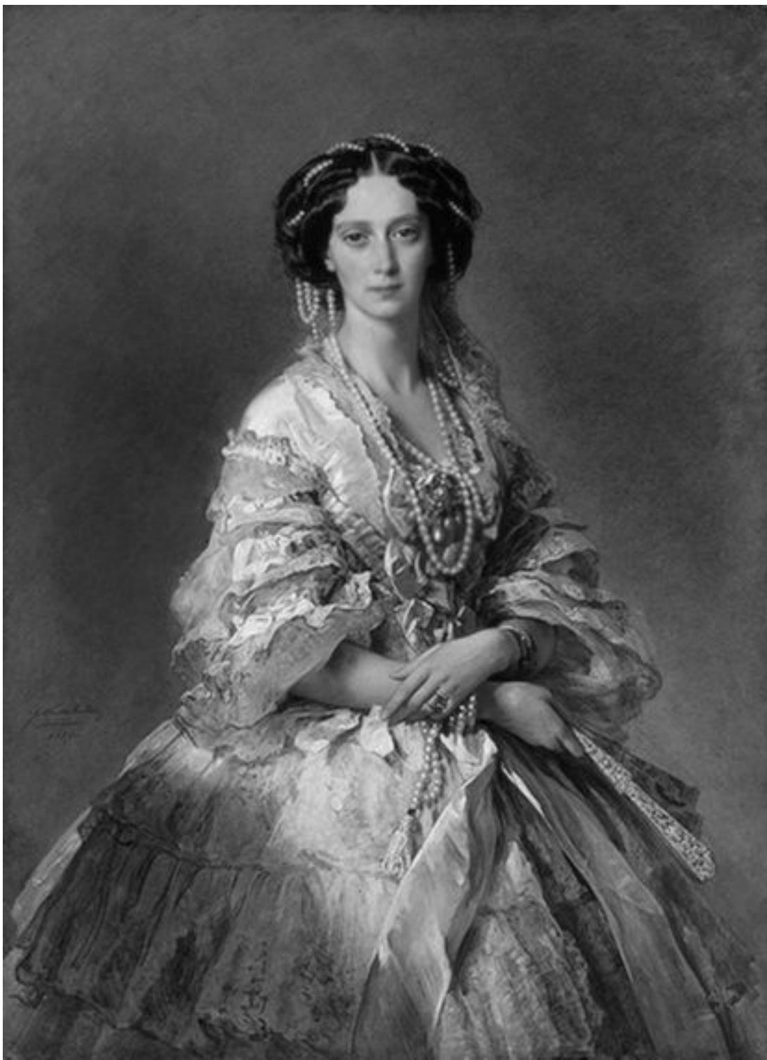
Императрица Мария Александровна. Ф.К.Винтерхальтер. 1857 г.