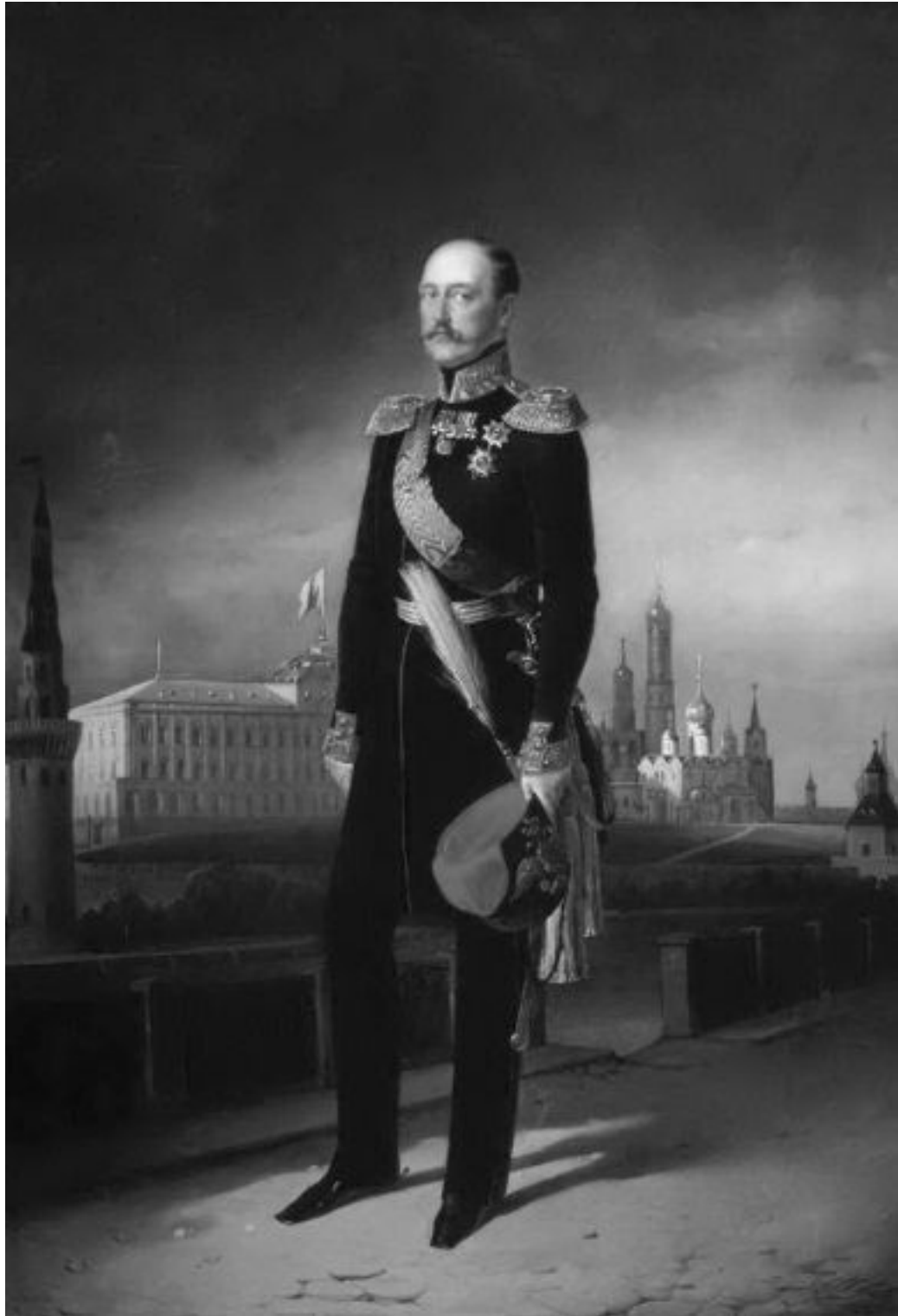
Император Николай I. ЕМ. Ботман. 1856 г.

Первый солдатский мундир по форме Измайловского полка, стоимостью в 10 руб., для великого князя Николая (будущего Николая I) был сшит в 1801 г., когда ему было только 5 лет. Первый генеральский мундир (стоимостью в 35 руб.) у Николая появился в 14 лет, в 1810 г. 15 Существовала традиция, по которой мальчики из дома Романовых с 5 до 7 лет носили солдатские мундиры, с 7 до 16 лет – штаб-и обер-офицерские, а после 16 лет – генеральские мундиры.