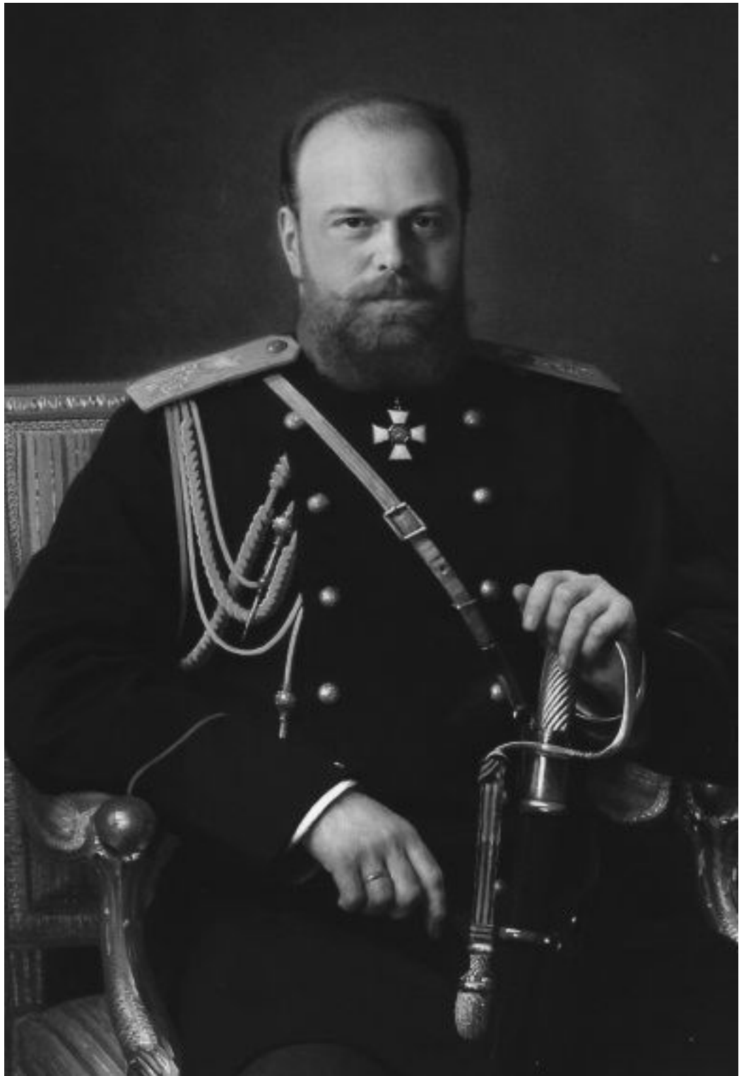
Император Александр III. И.Н. Крамской

После воцарения Александра III мода «на бороды» немедленно охватывает всю мужскую половину высшего света.