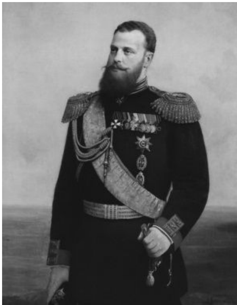
Великие князья Владимир (неизвестный художник, конец XIX в.) и Алексей Александровичи (А.И. Корзунин, 1889 г.)

Отметим, что появление бороды у цесаревича не было фрондой по отношению к отцу, хотя отношения между ними складывались очень сложно. Дело в том, что на время ведения боевых действий Александр II официально разрешил офицерам носить бороды. Как известно, «запретный плод» сладок, и в армии почти все офицеры начали отращивать бороды. Даже 20-летний великий князь Сергей Александрович начал отращивать бороду, записав в дневнике 9 июня 1877 г.: «Государь разрешил в кампании носить бороды, и мы отпускаем себе, я также» 60 . Однако, когда император возвратился в Петербург (10 декабря 1877 г.), он уже через неделю потребовал от своего ближайшего окружения привести себя в порядок. 19 декабря Сергей Александрович писал цесаревичу: «Мою чудную бороду пришлось обрить, это было очень печально и неприятно, но ПапА не хочет, по-видимому, чтобы носили бороды» 61 .