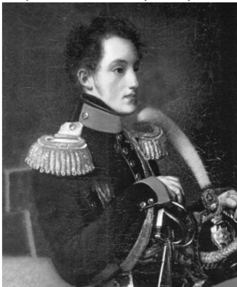
Великий князь Николай Павлович. О. Кипренский. 1816 г.

Это описание достаточно объективно. Царь действительно имел атлетическую фигуру. Надо заметить, что в мужской и женской моде того времени широко использовались корсеты.