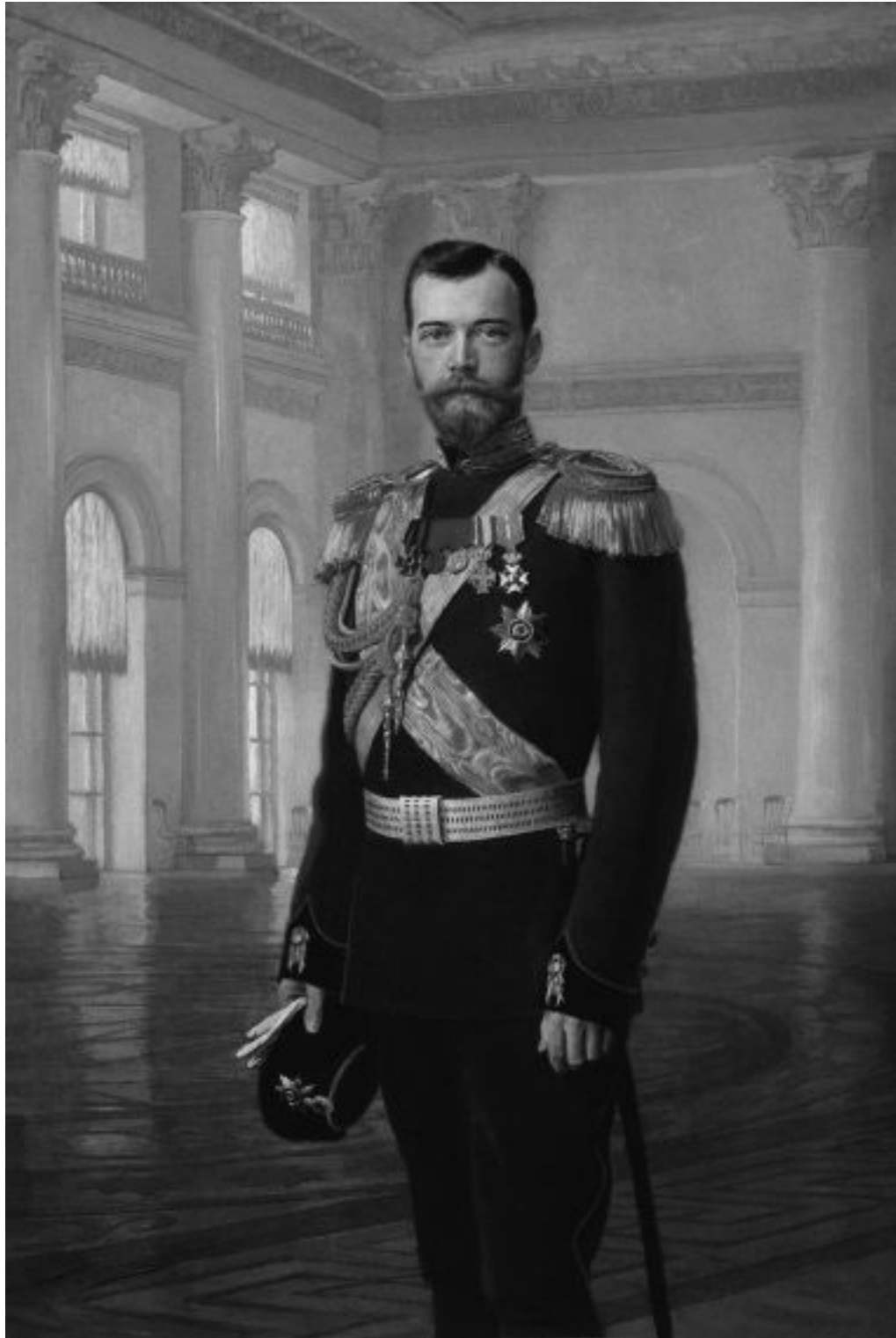
Император Николай II. Э.К.Литарт. 1900 г.

Николай II не сразу обрел навык и привычку к бесчисленным публичным выступлениям и к появлению на людях в качестве первого лица государства. Поначалу от этого он испытывал настоящий стресс. Однако со временем навык был приобретен, но, тем не менее, несмотря на его внешнее спокойствие и «непрошибаемость», он, как и всякий человек, нервничал, и «внешним образом смущение государя выражалось, например, в столь известном постоянном поглаживании усов и почесывании левого глаза» 76 . Эту сохранявшуюся внутреннюю неуве-