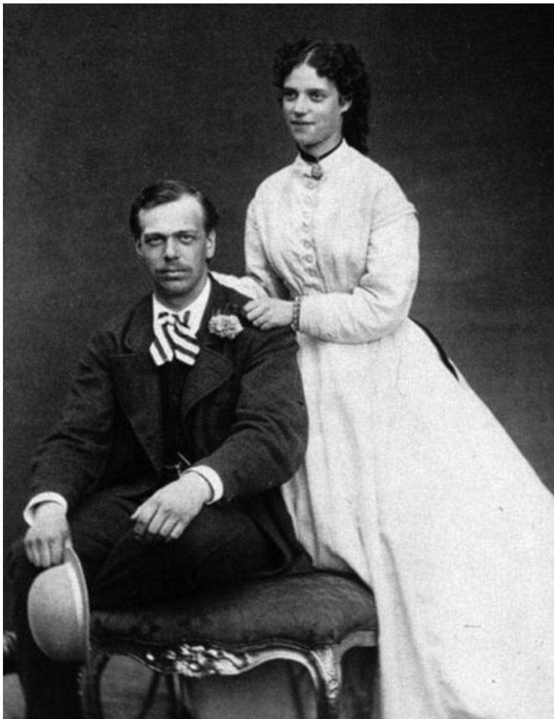
Цесаревич Александр Александрович и Дагмар. Фото 1866 г.

На одной из них молодой цесаревич в темном, двубортном сюртуке, белой рубашке с отложным воротником. На этой постановочной фотографии (а в то время только такие и были) цесаревич опирается о спинку венского стула, придерживая руками темный, в цвет сюртука, котелок и перчатки. Слегка просматривается пестрый галстук.