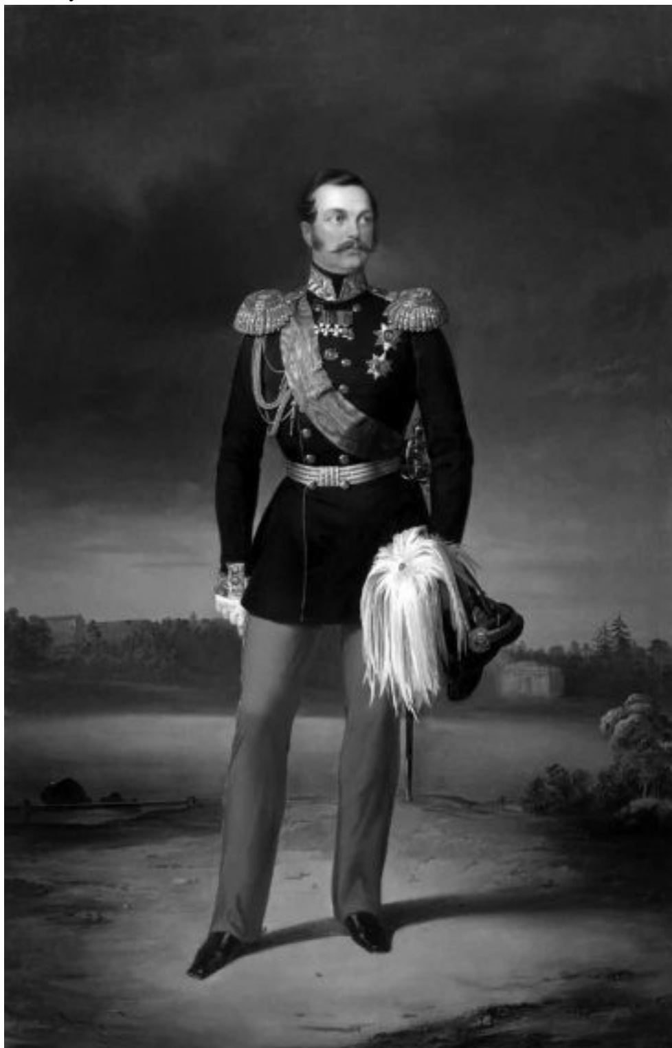
Император Александр II. ЕМ. Ботман. 1856 г.

ское платье и поехали в русскую церковь, где было отслужено молебствие. Вечером того же дня они были в театре des Varietes, на представлении Оффенбаховой оперетки «Герцогиня Геро-лынтейн»; в антрактах гуляли по бульвару, наслаждаясь своим incognito, как школьники, выпущенные на каникулы.