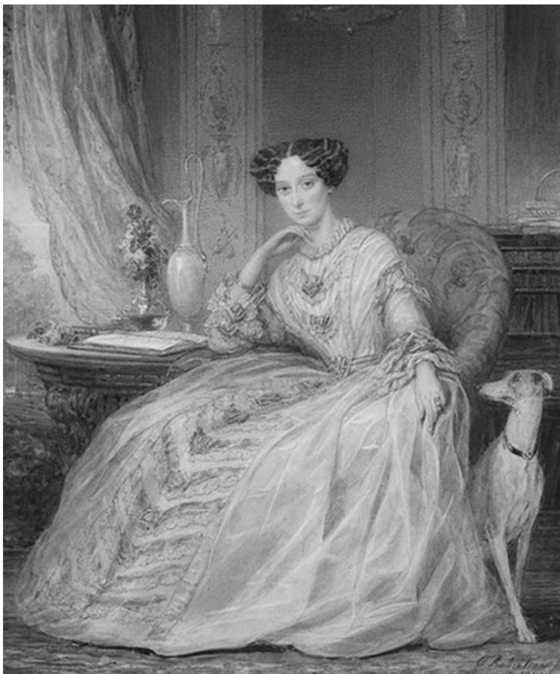
Великая княгиня Мария Александровна. К. Робертсон. 1850 г.

Несмотря на высокий рост и стройность, она отличалась худобой и хрупкостью, но это складывалось в совершенно особое изящество, «какое можно найти на старых немецких картинах». Мемуаристка отмечала, что цесаревна не являлась классической красавицей николаевской эпохи, поскольку «черты ее не были правильны». Но при этом у цесаревны – прекрасные волосы, нежный цвет лица, большие голубые (немного навекат) глаза, «смотревшие кротко и проникновенно. Профиль ее не был красив, так как нос не отличался правильностью, а подбородок несколько отступал назад. Рот был тонкий, со сжатыми губами... а едва заметная ироническая улыбка представляла странный контраст к выражению ее глаз» 44 .