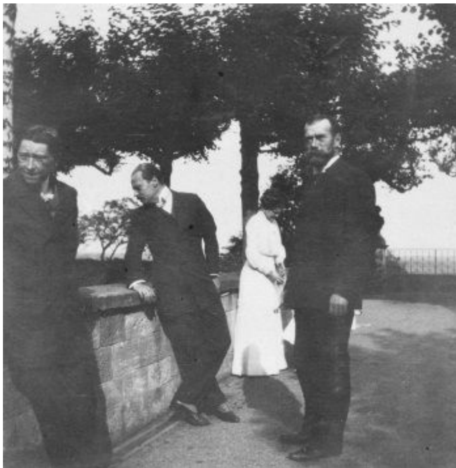
Император Николай II во время визита в Германию. Фото 1910 г.

При этом, как следует из бухгалтерских счетов, в гардеробе царя имелись все необходимые штатские вещи, и за ними тщательно следили. В 1897 г. во время поездки на родину жены в Дармштадт Николай II и Александра Федоровна совершили инкогнито поездку во Франкфурт-на-Майне. Одеты они были в обычные партикулярные костюмы состоятельных буржуа. Окружение молодого императора немедленно отметило, что Николай II не имел привычки носить штатское платье, и цилиндр на нем был плохого качества 69 .