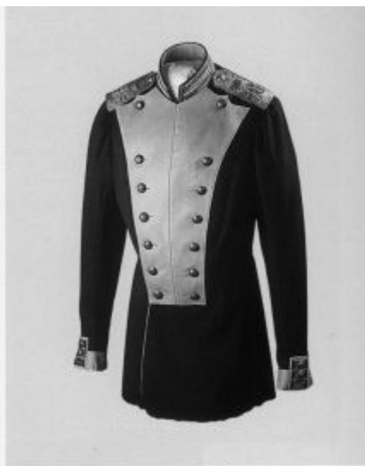
Мундир генерал-фельдмаршальский лейб-гвардии Литовского полка. Кат. 295