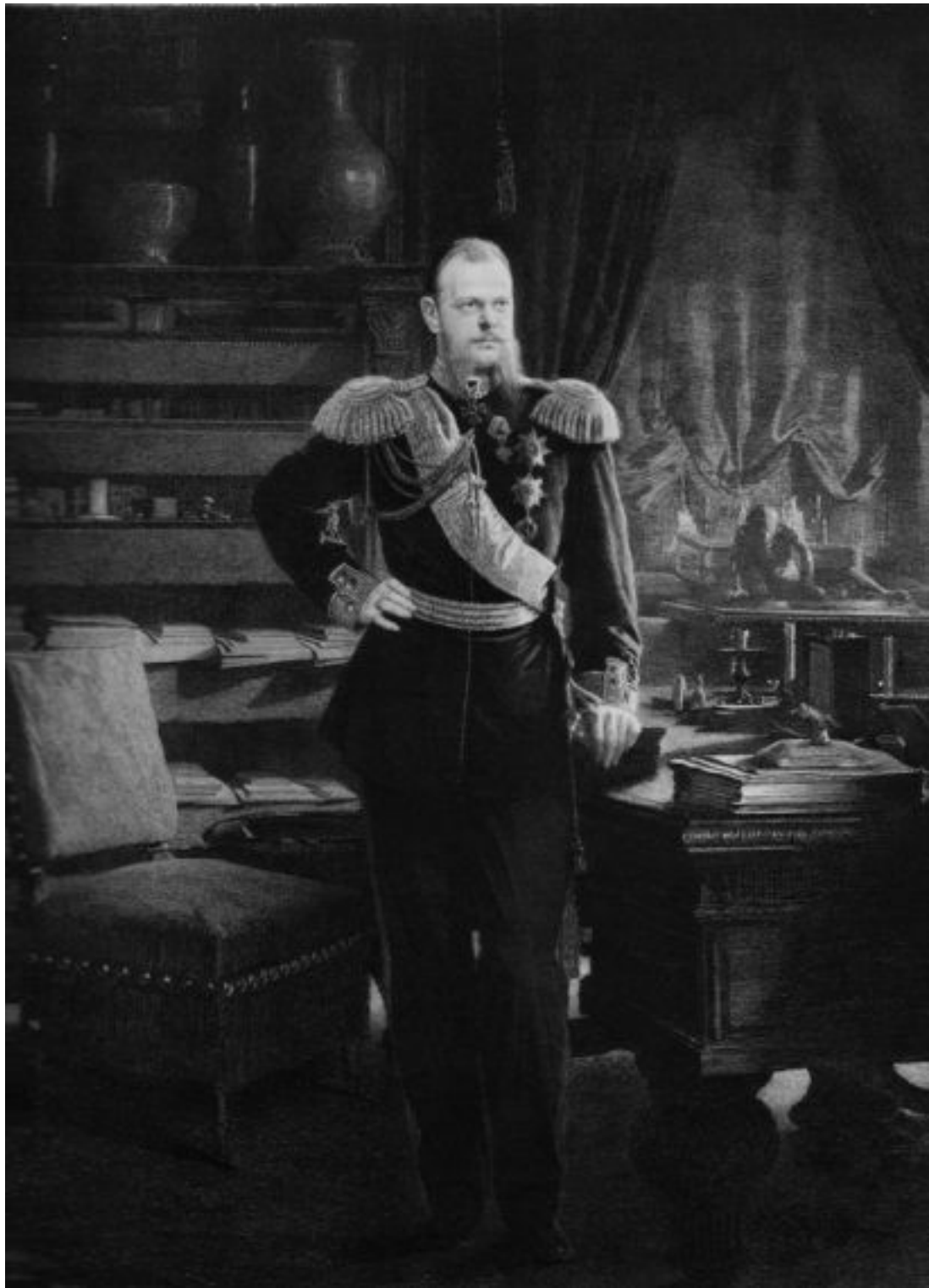
Император Александр III ( с бакенбардами )

Будучи великим князем, цесаревичем, а затем и императором Александр III всячески подчеркивал свою «русскость». И в этом отсутствовали наигранность, поза или ксенофобия. Это была органически присущая ему черта, которая выражалась и в использовании русского языка в светском обществе, и в его одежде, художественных симпатиях, и в самом внешнем облике. Поэтому его способность «ругнуть, иной раз сплеча» и говорить «прямо набело» – часть его искренней русской души. При этом Александр III прекрасно знал свою родослов-