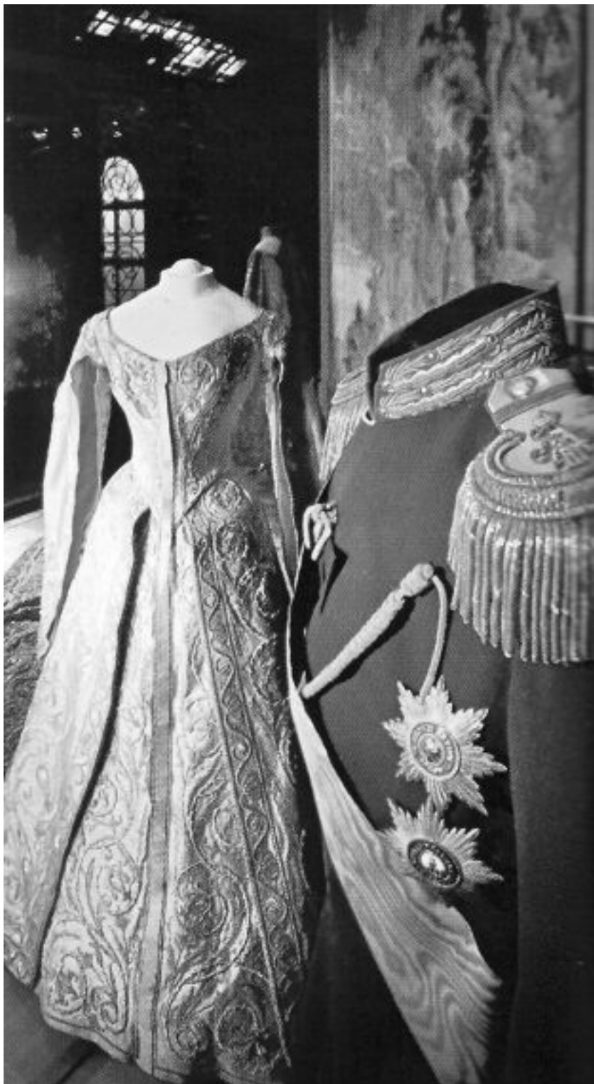
Коронационные платье Александры Федоровны и мундир Николая II