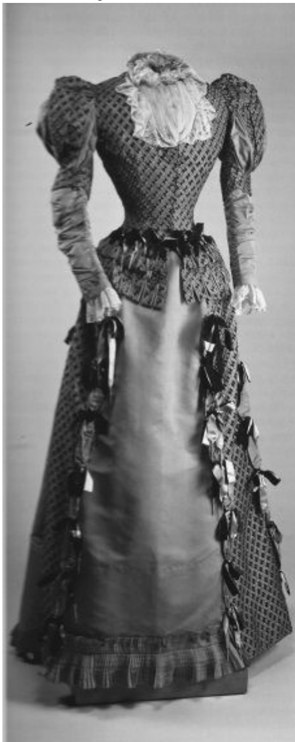
Платье из узорчатого бархата и шелка. Фирма «Ч. Ворт». Париж. 1880-е гг.

еще очень немного лет тому назад. Теперь, глядя на него, я с изумлением спрашивала себя, каким же образом произошла эта полнейшая перемена, которая меня в нем поразила; откуда у него появился этот спокойный и величавый вид, это полное владение собой в движениях, в голосе и во взглядах, эта твердость и ясность в словах, кратких и отчетливых, – одним словом, это свободное и естественное величие, соединенное с выражением честности и простоты, бывших всегда его отличительными чертами» 52 .