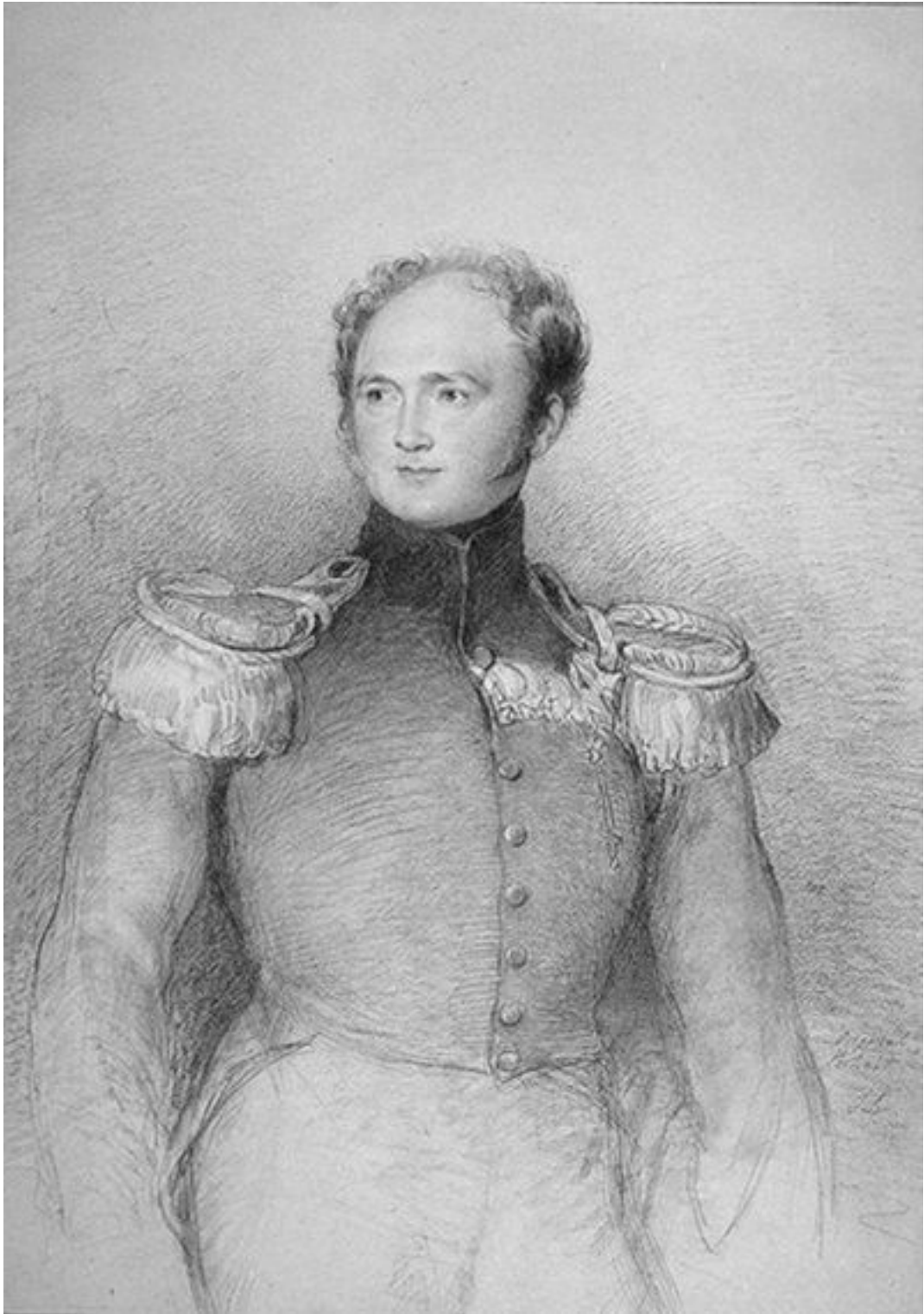
Император Александр I. Т. Лоуренс. 1818 г.

Имя часовщика Бреге дало название знаменитым часам – «брегетам». Этот мастер неоднократно выполнял штучные и, конечно, очень дорогие заказы, поступавшие от европейских монархов. Так, им были изготовлены часы для султана Османской империи, для принца-регента Великобритании и для российского императора Александра I.