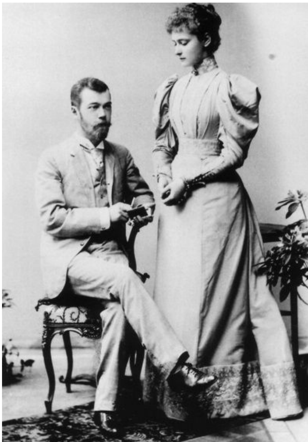
Цесаревич Николай Александрович и принцесса Гессенская Алиса после помолвки. Фото 1894 г.

Император Николай II носил небольшую светлую овальную бороду, отливавшую рыжеватым цветом, и имел спокойные серо-зеленые глаза, отличавшиеся какой-то особой непроницаемостью, которая внутренне всегда отделяла его от собеседника» 68 .