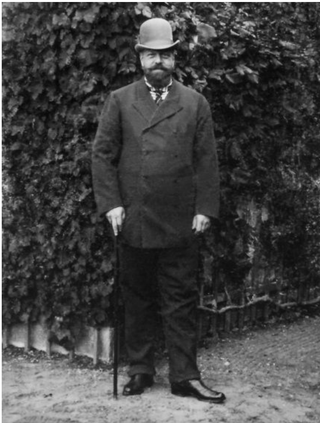
Император Александр III. Фото 1890-х гг.

На фотографиях хорошо видно, что пиджак мал, когда застегнут на все пуговицы, что карманы оттянуты и что его «украшают» многочисленные складки. Любопытно то, что одна из фотографий многовариантна в воспроизведениях. Видимо, фотографии российского монарха «по гражданке» были такой редкостью, что фотографы активно использовали ретушь при их подготовке для тиражирования. На исходной фотографии Александра III, одетого в гражданский костюм, держит под руку его жена, императрица Мария Федоровна. На последующих фотографиях Марию Федоровну трудами ретушеров «убрали», и император стоит один.