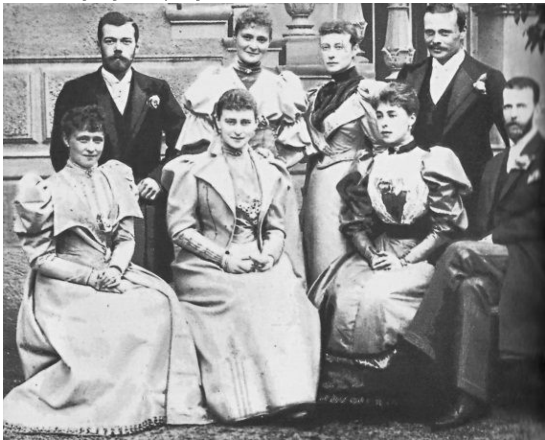
Первая семейная фотография Кобург. Апрель 1894 г.

Первая серия фотографий Николая II в статском платье относится к его поездке «на Восток» в 1890–1891 гг., когда он еще был цесаревичем. На этих фотографиях молодой 22-летний цесаревич одет в легкую «тропическую форму», и только во время официальных визитов он надевал офицерский мундир.