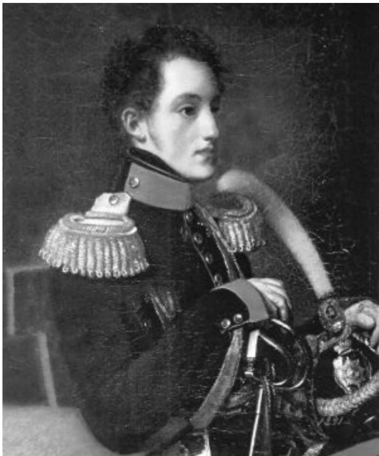
Великий князь Николай Павлович. О. Кипренский. 1816 г.