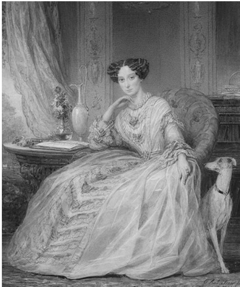
Великая княгиня Мария Александровна. К. Робертсон. 1850 г.