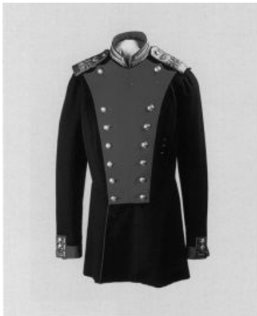
Мундир генерал-фельдмаршальский лейб-гвардии Павловского полка. Кат. 293