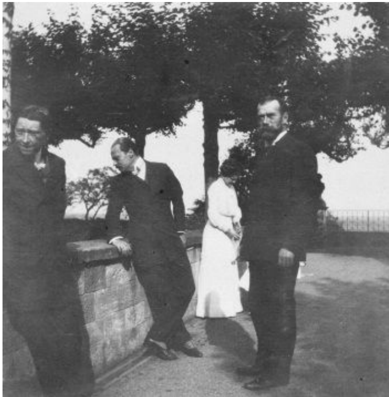
Император Николай II во время визита в Германию. Фото 1910 г.

При этом, как следует из бухгалтерских счетов, в гардеробе царя имелись все необходимые штатские вещи, и за ни-