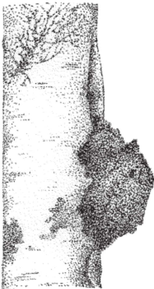
Рис. 1. Березовый гриб чага

Образование гриба проходит следующим образом: грибные споры проникают в древесину, постепенно ее разрушая. В месте первоначального проникновения спор (чаще всего это нижняя и средняя части стволов) развивается нарост, выступающий из-под коры, которая вследствие этого разрывается. Гриб вызывает на березе белую сердцевинную гниль, подобную той, которую образует на деревьях ложный трутовик. Именно поэтому на протяжении нескольких десятилетий чага считалась бесплодной формой ложного трутовика. Настоящие плодовые тела трутовика очень часто остаются незамеченными. Они растут под корой, которая вскоре в этих местах отпадает.