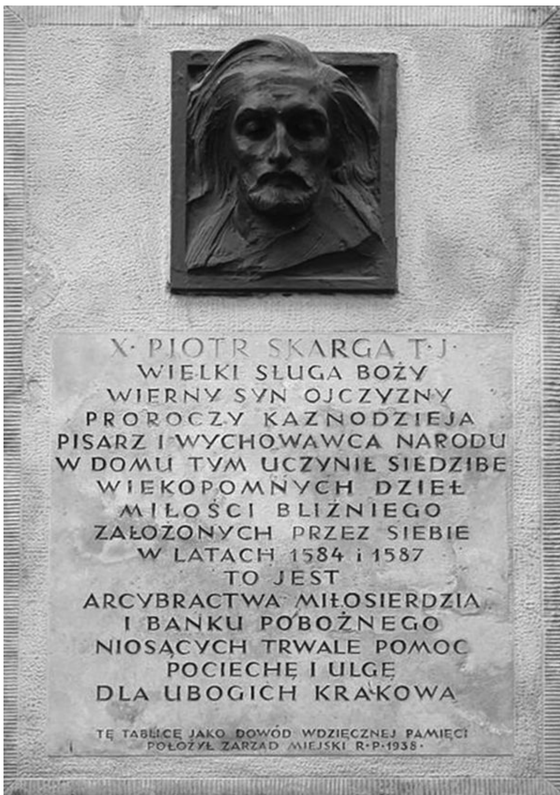
Мемориальная доска в честь Петра Скарги, установленная в Кракове городским управлением в 1936 году

Чем дальше полковник Замчинский описывал неосуществившиеся возможности Речи Посполитой, тем мне становилось приятнее от того, что я сам по матери принадлежал роду, происходившему от римско-католического пробста из Клаузена в Тироле и давшему нескольких своих ярких представителей Обществу Иисуса – каноников, теологов и даже профессов