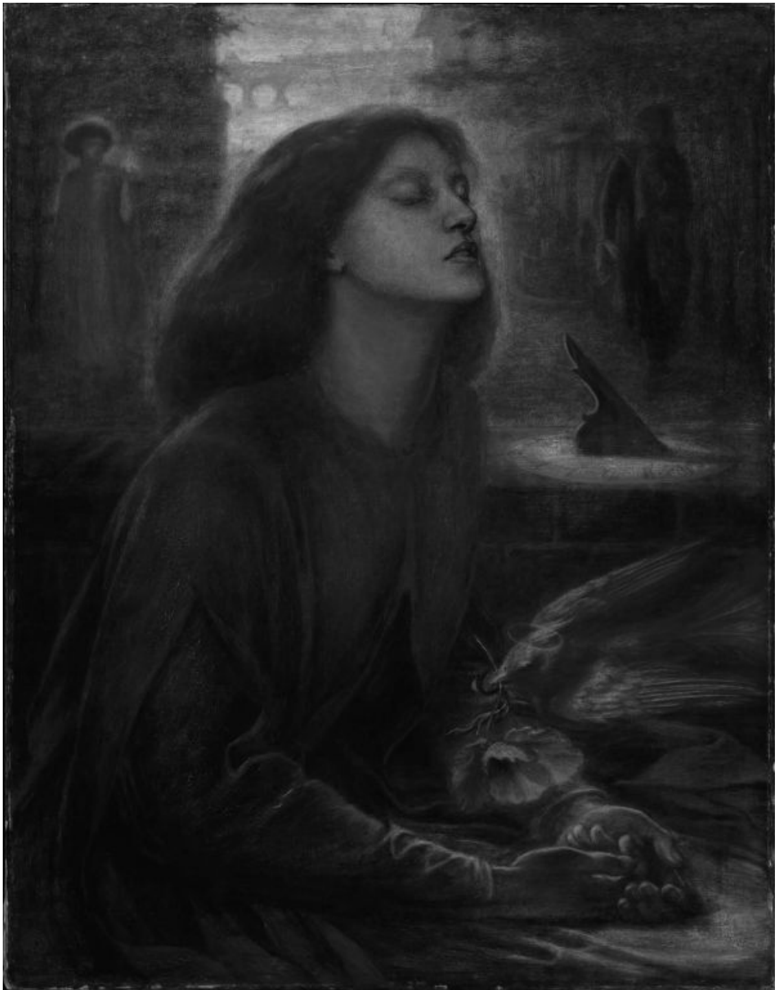
Данте Габриэль Россети. Beata Beatrix, 1864–1870