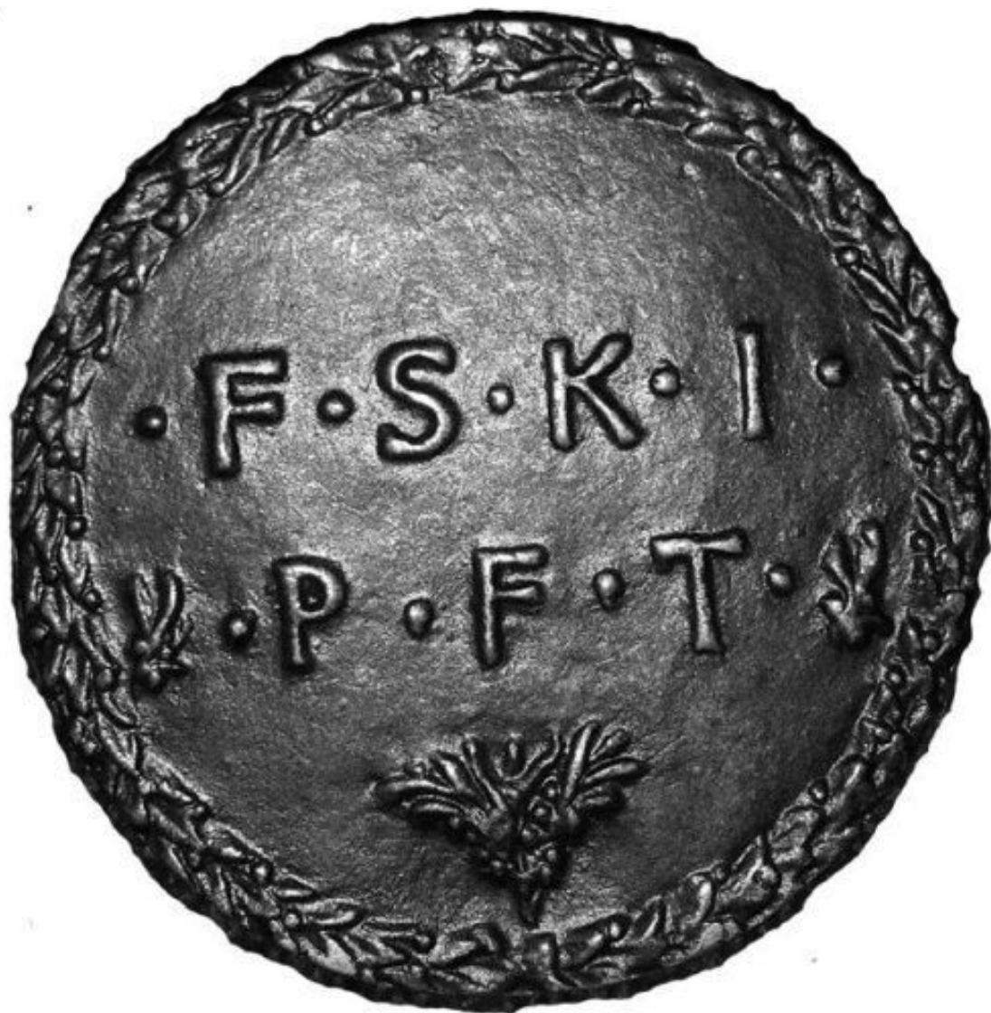
Оборотная сторона хранящегося в Вене медальона работы Пизанелло с изображением Данте

В целом, как нам представляется, суждение Жозефена Пеладана верное, учитывая то, что Данте Алигьери разделял учение о Трех Заветах цистерцианского аббата, поэта, теолога и мистика Иоахима Флорского (1132–1202), выраженное в его книге «Вечное Евангелие». В ней калабрийский игумен и основатель Флорского монастыря разбил всю историю человечества на три периода: 1) Отца, от Авраама до Иоанна Крестителя, 2) Сына, от воплощения Сына Божия до 1260 года, 3) Святого Духа – с 1260; вывод о 1260 годе он обосновывал словами Откровения Иоанна Богослова о «тысяча двухсот шестидесяти днях» (Отк. 11:3 и 12:6). У каждого периода свой Завет: Ветхий, Новый и Вечный (заметьте, и здесь наша арифметика: 2+1, 21). Но если наступление Третьего Завета Святого Духа для Иоахима Флорского связывалось с расцветом созерцательного монашества, то для Данте Алигьери означало власть рыцарства в светских и духовных делах, которая должна заменить папское и императорское господство. Именно это сближает «белого гфельфа» Данте с францисканцами-спиритуалами, среди которых образовалось концептуальное направление иоахимитов, видевшее в папстве апокалиптическую блудницу и рассматривавшее императорскую власть как опору церковной иерархии и своего ордена, вследствие чего иоахимиты были сторонниками Гогенштауфенов и других монарших родов в борьбе с папами. Стоит ли говорить, что подобных воззрений придержи-