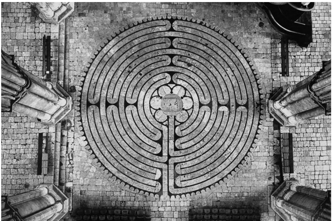
Лабиринт Шартрского собора Божией Матери

Шартрский собор. Возникает впечатление, что над мистической Розой возвышаются две колонны Соломонова храма, между которыми пирамида