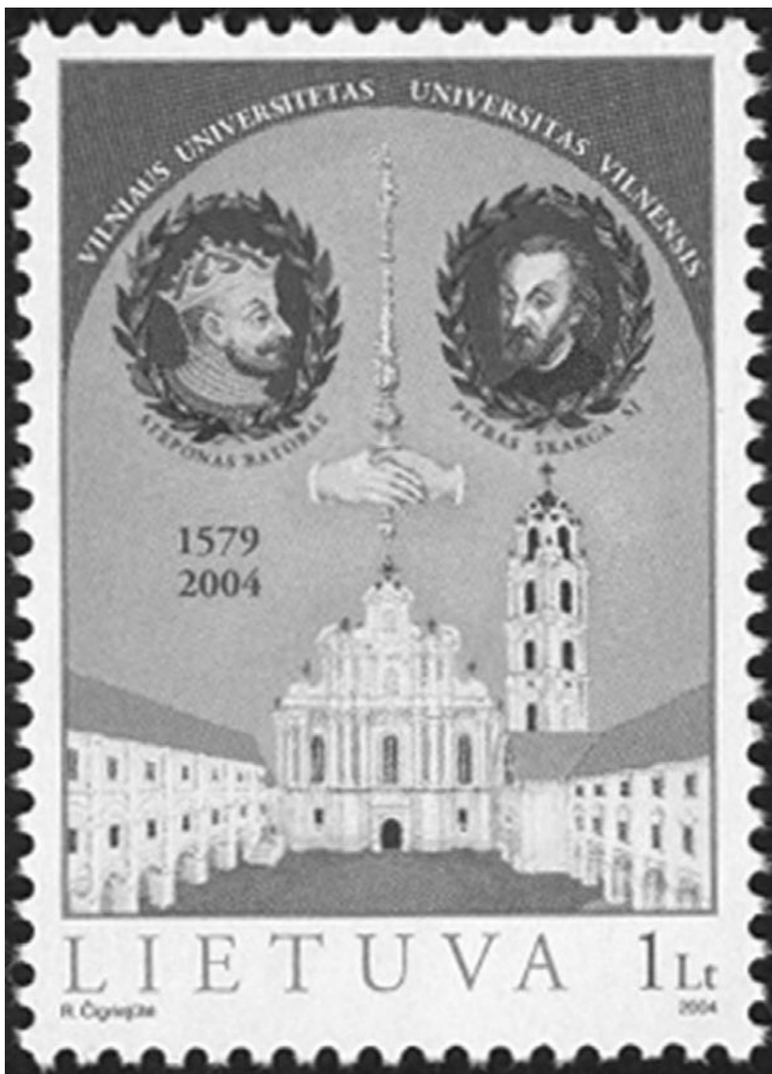
Стефан Баторий, Петр Скарга и Вильнюсский университет на марке 2004 года

В 1584 году, завершив свой апостолат в Вильно, Скарга был переведен в новую иезуитскую коллегию в Кракове, а в 1588 году новоизбранный король Сигизмунд III Ваза учредил должность придворного проповедника, и Скарга стал первым из священнослужителей, ее занявшим. Петр Скарга быстро вошел в доверие к королю, и Сигизмунд настолько полюбил его, что, когда иезуит попросил об отставке, Сигизмунд отклонил это, потребовав, чтобы он оставался при дворе как можно дольше. Яростно борясь с протестантизмом во всех его прояв-