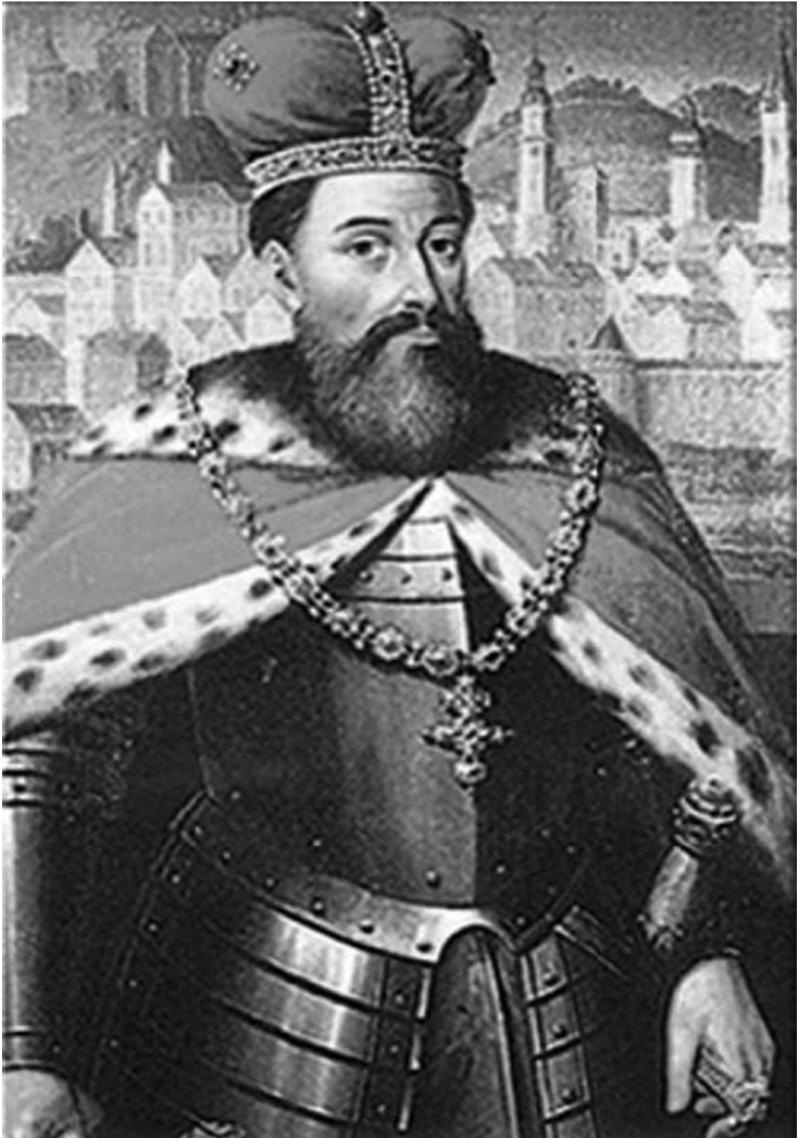
Даниил Романович Галицкий