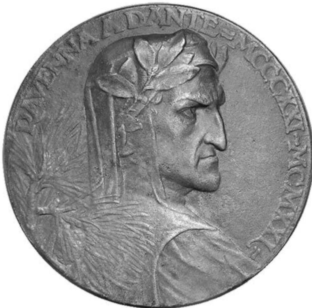
Памятная медаль с изображением Данте, приуроченная к 600-летию со дня его смерти (1921 год)

В этом отношении интересна и эзотерическая трактовка у Данте числа 9, символизирующего тройственный аспект каждого элемента человеческой трихотомии – тела, души и духа (тут же отметим, что нумерологическое значение рассматриваемого нами числа 21, как поэтического возраста или срока, не только 7 \times 3 ( 7+7+7 ), но и обычная триада, поскольку 2+1=3 ). Композиция «Божественной комедии» равным образом держится на числах 3 и 9: произведение разбито на три части, состоящие из 33 канцон (песен), написанных триолем ( 2+1 ; размер, применявшийся и Гумилевым в подражании средневековым классикам), что дает в сумме 99. Кроме того, девятка у Данте ассоциируется как с 9 основателями Ордена Храма и 9 лангами или провинциями исторического ордена, так с 9 степенями посвящения низаритского исмаилитского сообщества и властью рыцарства, которая, по его мнению, должна была заменить собой королевскую и папскую власть, что выражается в степени кадоша-тамплиера (ха-кадош – святой или посвященный на иврите), практиковавшейся, по предположениям некоторых исследователей, в тайном сообществе «Верные Любви». Девяти кругам дантовского «Ада», которые якобы связаны с пресловутым ритуалом жертвы Девятого круга, будто бы проводившимся иезуитами в Ватикане, противостоят девять небес «Рая», куда и ведут нас «кадоши»: христиане-иоанниты или поборники изначальной христианской тринитарной традиции; исмаилитские «Чистые братья» или «Ихван-ас-Сафа»; 9 первых основателей Ордена Храма; а также