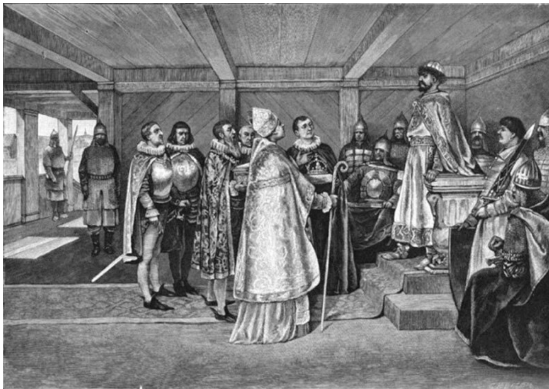
Папский нунций подносит князю Даниилу Романовичу королевскую корону