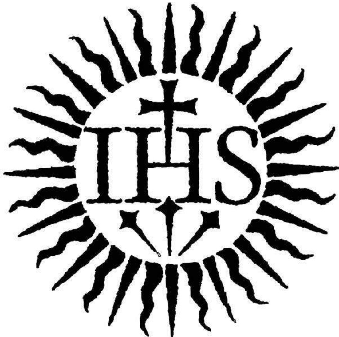
Герб Общества Иисуса с тремя гвоздями