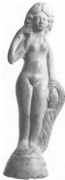
Рис. 4. Глиняная фигурка «нимфы», ок. II в. до н. э., найдена на юге Британии

Мы полагаем, что в описании красавицы Этайн следует обратить внимание еще на одну деталь. Волосы Этайн сравниваются с ярко-желтым цветком (ирл. ailestar 'гиацинт? ирис?' [TBDD 1963, 1, 16]), и при этом говорится, что они сверкали на зеленом шелке плаща, подобно золоту, так что на них было трудно смотреть (букв. forderg – «сверх-красные», т. е. «сверх-яркие», в переводе С. Шкунаева – опущено, см. [TBDD 1963, 1, 12]). В се вместе – зеленый плащ, ярко-желтые пряди волнистых волос и стояние у воды – создает образ цветка, а точнее – болотного ириса, который в поздней фольклорной традиции считался цветком смерти. В Ирландии вплоть до XVII в. практически не было распространено цветоводство, цветы не культивировали и, более того, они считались чем-то не только не нужным, но и опасным. Особенно это касалось цветов, растущих у воды, – лилий, кувшинок, ирисов и проч., поскольку своим видом эти цветы привлекали внимание детей, которые, пытаясь дотянуться до красивого яркого цветка, могли упасть и погибнуть в болоте или в омуте. Видимо, по этой причине детям было принято рассказывать страшные истории о цветах, которые, якобы, сажает водяной, сурово наказывающий того, кто решится сорвать его посадки.