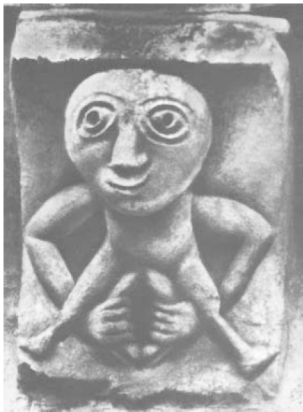
Рис. 6. «Шиле-на-гиг», Британия. Камень с рельефом, датируемым X в., использован при строительстве церкви св. Марии трактовку, согласно которой это «изображение кельтской

щих свои гениталии. Как пишет Э. Росс, данная фигура имеет «двойной смысл: плодородие, которое символизируют гениталии, и смерть, которую олицетворяет также гипертрофированная голова» [Ross 1973, 149]. В чем-то такая интерпретация опирается на более распространенную