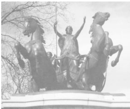
Рис. 1. Боудика. Бронзовая статуя на набережной Темзы, Лондон

в том, что никогда нельзя быть уверенным в том, какой своей стороной она сейчас повернулась и, более того, – кто это вообще.