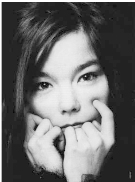
Рис. 2. Бьорк

В одном из ранних ирландских поэтических оградительных текстов, относящихся к жанру «Лорика» (Lorica, букв. 'броня') и датируемых VIII в., поэт, перечисляя злые силы, от которых он хочет себя защитить, говорит, в частности: