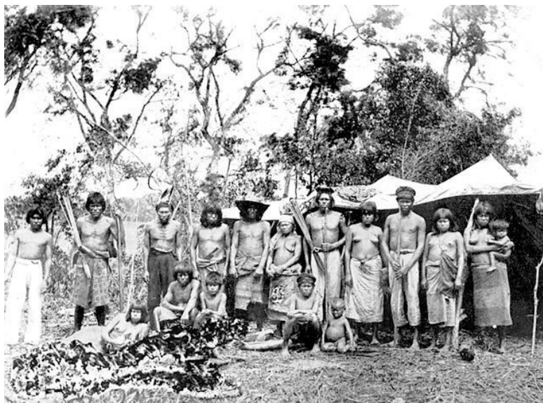
Группа тоба. Район реки Пилькомайо в Гран-Чако, 1892

каждой девушки становится луна. Если начались у нее месячные – значит, это луна к ней приходил, и через какое-то время ее можно выдавать замуж за обычного человека.