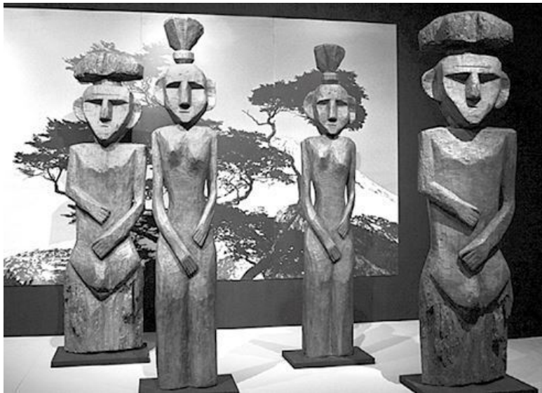
Идолы мапуче, Музей доколумбова искусства, Чили

А потом, во сне, наяву или между сном и явью, в состоянии транса, к ним приходили образы и истории, отвечающие на важные вопросы об этом мире. Они пересказывали их соплеменникам. И если истории были «сильными» — их передавали из уст в уста, от родителей и бабушек к детям, от одной группы людей к другой, рассказывали во время важных обрядов и праздников. Они обрастали новыми деталями, прожили много веков и дошли до нас.