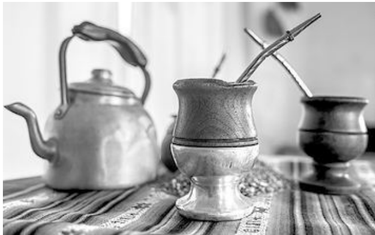
Набор для питья мате