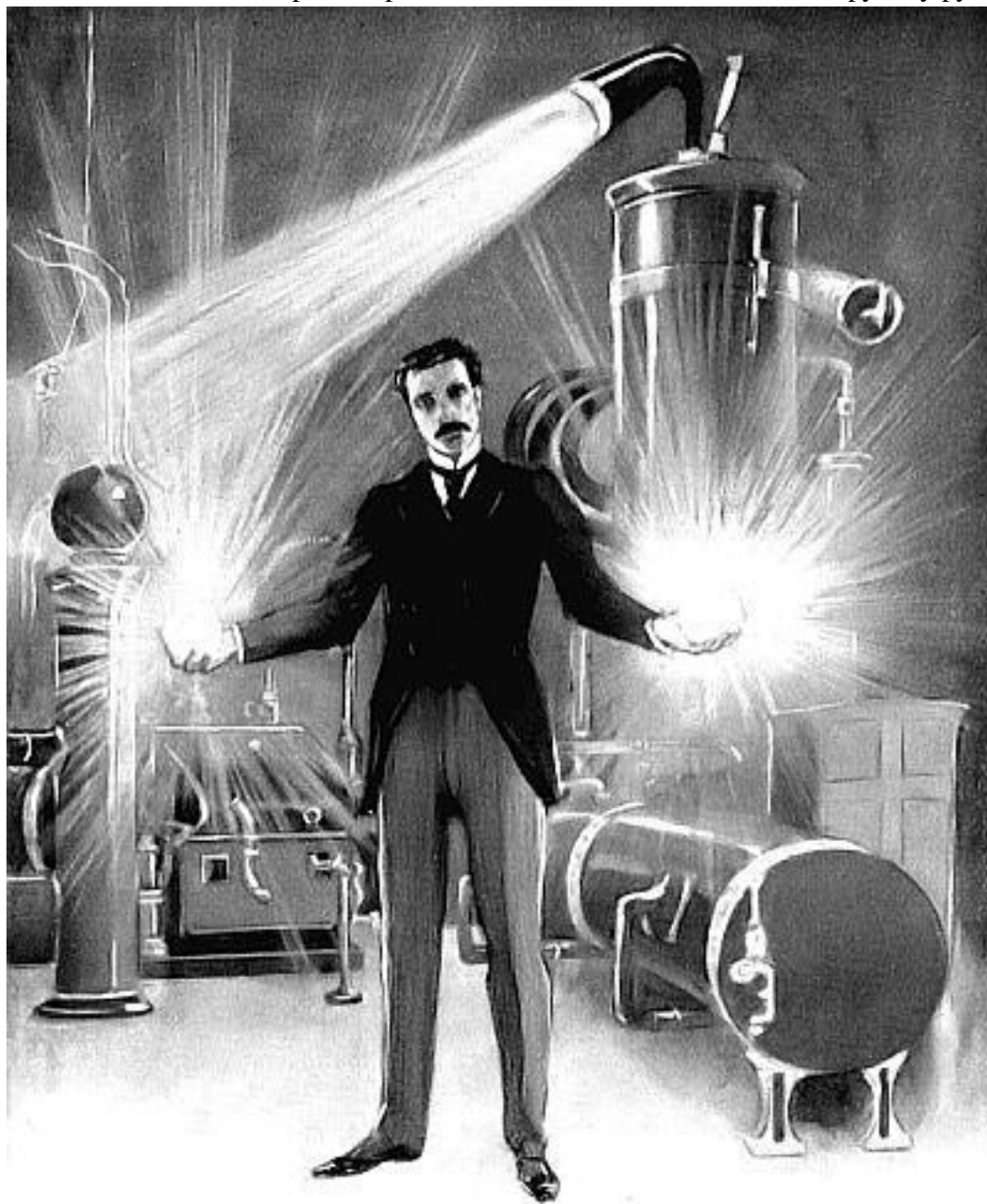
Никола Тесла держит в руках шары пламени.

До восьми лет я отличался слабым и нерешительным характером. Мне не хватало ни храбрости, ни сил для твердых решений. Мои чувства накатывались на меня как волны и всегда доходили до крайностей. Мои желания проявлялись с расточительной силой и множились подобно головам гидры. Меня угнетали мысли о страданиях жизни, смерти и религиозный страх. Мной управляли суеверия, и я жил в постоянной боязни злых духов, привидений, великанов-людоедов и других чудовищ темного мира. Затем совершенно внезапно произошло потрясающее изменение, которое направило течение всей моей жизни по другому руслу.