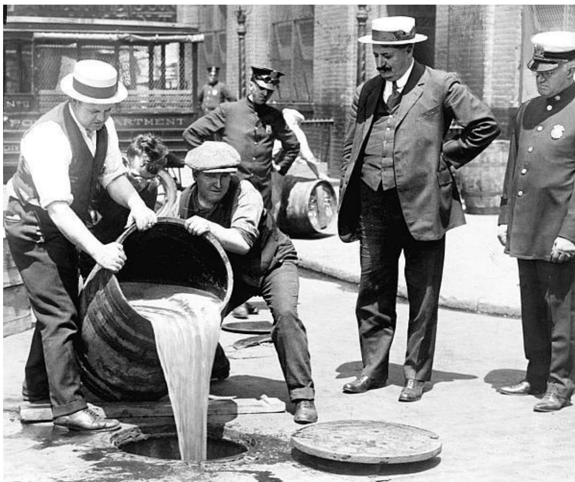
Уничтожение алкоголя во времена «сухого закона» в Америке.

Ни одно сообщество не может существовать и развиваться без жесткой дисциплины