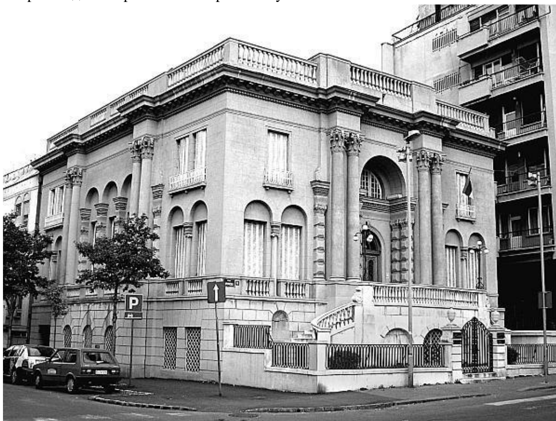
Музей Николы Тесла в Белграде

спиртного, и все же очевиден факт, что кофе, чай, табак, жевательная резинка и другие стимуляторы, к которым повсюду относятся снисходительно даже в отношении детей, в значительной степени вредны для нации, если судить по числу умерших. Так, например, в студенческие годы я читал некрологи, публиковавшиеся в Вене, родине любителей кофе, и пришел к выводу, что порой число смертей от болезней сердца достигало шестидесяти семи процентов от их общего количества. Подобные наблюдения можно было бы провести в городах, где имеет место чрезмерное потребление чая. Эти очень приятные напитки чрезвычайно возбуждают и постепенно истощают тонкие структуры головного мозга. Они также опасно влияют на артериальное давление, и их следует пить тем более умеренно, так как они вредят медленно и незаметно. С табаком легко и приятно думается, и он снижает напряженность и сосредоточенность, необходимые при каждом творческом и энергичном усилии интеллекта.