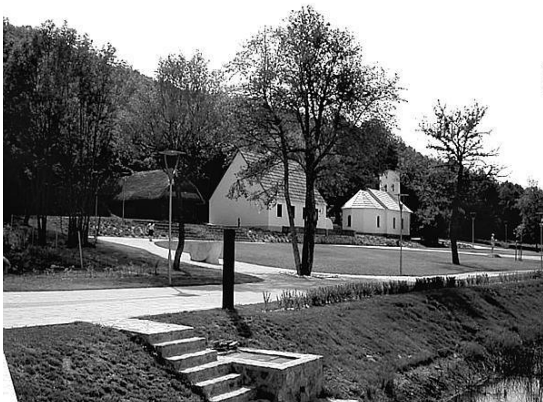
Так выглядит дом-музей Николы Теслы в деревушке Смилян в наши дни

Имелась и другая, еще более важная причина моего позднего пробуждения. В годы отрочества я страдал от необычных видений, зачастую являвшихся мне в сопровождении ярких вспышек света, которые искажали вид реальных предметов и мешали думать и творить. Это были изображения предметов и сцены, которые я видел как наяву, хотя впоследствии мне никогда их больше наблюдать не приходилось. Когда мне говорили слово – название какого-либо предмета, его образ живо предстал перед моим взором, и иногда я был совершенно не в состоянии определить, являлось ли то, что видел, материальным или нет. Это вызывало у меня сильное чувство дискомфорта и страха. Никто из ученых психологов или физиологов, с которыми я консультировался, не смог дать удовлетворительное объяснение этим необычным явлениям. Они кажутся уникальными, хотя я, вероятно, был предрасположен к этому, поскольку знаю, что мой брат испытывал такие же неприятности.